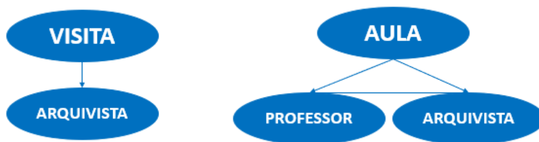
Figura 1 – Difusão educativa em arquivos.