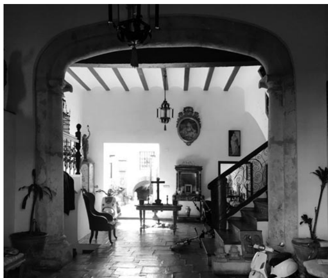
Fig. 6. Arco carpanel de la casa natalicia de Alejandro VI.