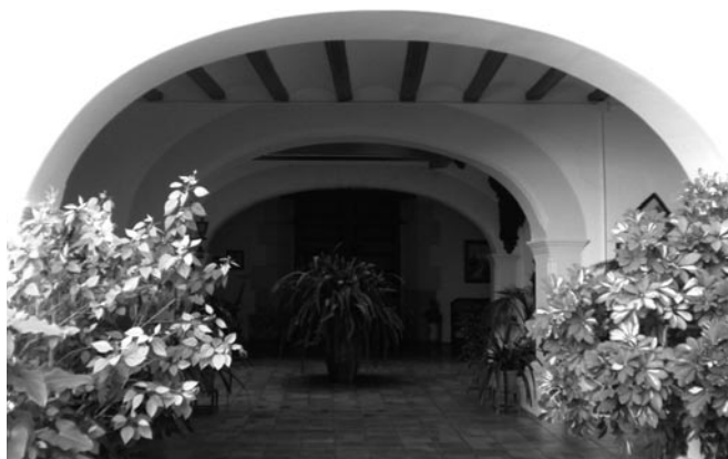
Fig. 8. Arcos apainelados de la casa Llácer.

También se localizan arcos del mismo tipo en la casa de don Luis Cerdà, en la calle Roca. En el vestíbulo de la misma se encuentra, adosada al cuerpo este y en uno de los ángulos del patio, la escalera, que conecta con el primer nivel, mientras que enfrente se ubica el entresuelo. Hay que atravesar la primera crujía mediante un arco apainelado en el que las impostas se muestran más ela-