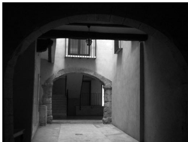
Fig. 5. Arco escarzano de la casa de los Cebrián en segundo plano.

Dentro de este grupo cabe destacar los que conforman el patio de la casa Llácer, en la calle de Sant Doménec. La entrada, a través de una puerta de contornos mixtilíneos, da paso a un vestíbulo desde donde se puede acceder tanto a dos entresuelos ubicados a ambos lados, como al patio, el cual queda separado por un arco rebajado construido con sillares, que descansa sobre unas impostas muy discretas, donde se ubica la escalera para acceder a la siguiente altura. En paralelo a la primera crujía se encuentra la segunda, cerrando el espacio distribuidor, y a la que se accede también pasando por un arco rebajado, éste no ya de sillares, sino de ladrillos