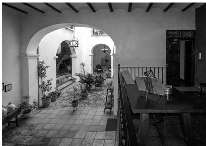
Fig. 9. Diferentes tipos de arcos de la casa Albero.

boradas que las anteriores para poder llegar al patio. Las jambas del mismo apoyan sobre un zócalo de fuerte presencia. Alineado con este arco, hay otro igual que cierra el espacio abierto por la parte sur. Dos crujías más, paralelas a la primera, acaban de conformar el edificio. Cabe remarcar que estos dos arcos también quedaban alineados a la puerta, y gracias a su luz y altura, permitían la entrada de carros.