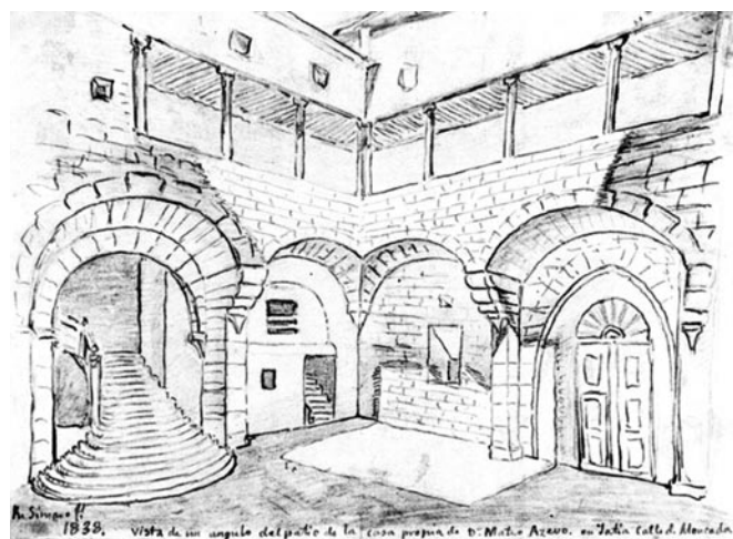
Fig. 3. Dibujo de Ramón Simarro del patio de la casa de los Sanç de Sorió, 1838, (publicado en P. Camarasa Balaguer, Arquitectura civil en Xàtiva. Siglos XIII al XIX, Valencia 2017 ).

A finales del siglo XV o principios del XVI se produjo una primera actuación destacable: el arco apuntado que daba acceso al patio fue cegado en parte con el fin de construir un arco escarzano aprovechando la luz del anterior 9 , mientras que en el cuerpo perpendicular a éste situado en el oeste, se levantó también otro arco de las mismas características pero de manufactura más