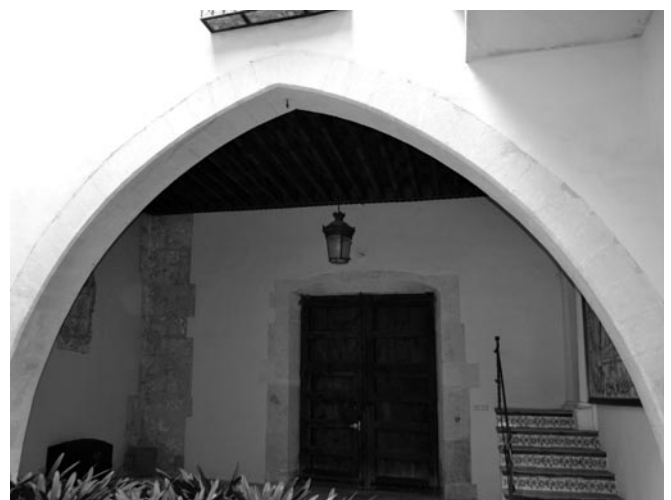
Fig. 2. Arco ojival del palacio del marqués de Montortal.

Dentro del parque edificado setabense existe un caso excepcional en el que, aunque en la actualidad varios de los vanos se encuentran cegados, conviven arcadas de medio punto con otras apuntadas. Se trata del palacio de los Sanç de Sorió, también en la calle Montcada. El mismo se vertebra mediante un patio central, del que en la configuración arquitectónica primigenia, y atendiendo al dibujo del pintor local Ramón Simarro, destacan una serie de puertas que se abrían a este espacio distribuidor donde la utilización de la piedra era, en estos huecos, muy llamativa. En la parte superior de los mismos se formaban una serie de arcos, algunos de medio punto y otros apuntados tal y como se ha señalado, sobre los que mediante un recreado también en forma de arco en cada uno de ellos se asentaba la galería volada del primer nivel. La singularidad del mismo reside, además de por la combinación de dos tipos de arcadas, por la continuidad de estas, lo cual, en el caso setabense, puede encontrarse en muy pocas viviendas, como la situada entre las calles Menor y Grau – actualmente en esta última numerada con el 20, la cual era el acceso principal – y que en el siglo XVII pertenecía al notario Andreu Doménech 8 . En esta, una serie de arcos apuntados delimitan el espacio abierto, el cual es de planta rectangular. La luz de los mismos es lo más destacable, ya que en unos casos esta está prevista para permitir el paso de carros, y en otros, únicamente el de personas [fig. 3].