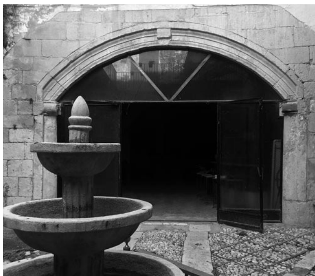
Fig. 7. Arco escarzano de la casa de los Peris.