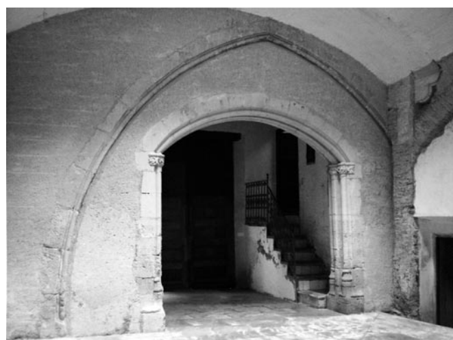
Fig. 4. Arco escarzano bajo arco apuntado de la casa de los Fenollet.

sencilla, empleando materiales de más baja calidad respecto al primero. Y es que este arco está compuesto por sillares muy bien trabajados por parte de los picapedreros, y con motivos florales en los capiteles. Se alineó la puerta con el arco de entrada al patio para así permitir un mejor acceso a los carruajes y carros.