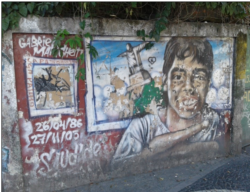
Figura 7 - Grafite de Gabriel Marighetti, 2005.