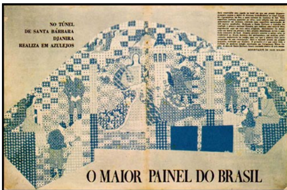
Figura 3 - Djanira da Mota e Silva. Azulejos, antes no Túnel Santa Bárbara, Rio de Janeiro, 1964.

Fonte: SILVA, Raul Mendes. Djanira. (Verbete). Dicionário de Artistas do Brasil . (Recurso Eletrônico). Disponível em: http://www.raulmendessilva.com.br/brasilarte/nacional/primeira.html . Acesso em: 10 jan. 2020.