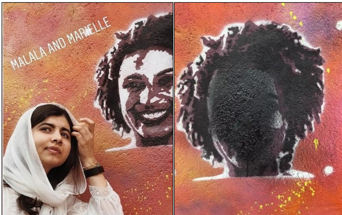
Figura 5 - Malala e Marielle Franco.