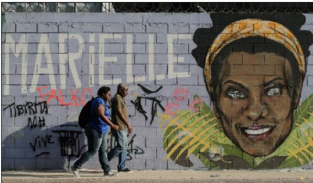
Figura 2 - Mural com Marielle no Rio de Janeiro.