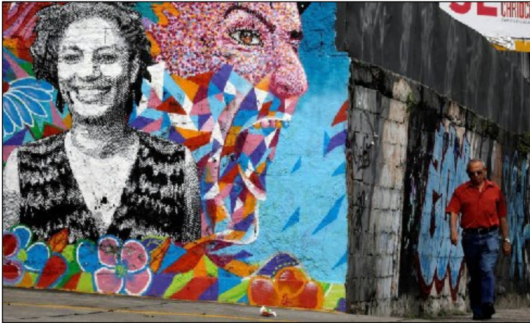
Figura 1 - Um transeunte ante um grafite de Marielle Franco, vereadora carioca assassinada.