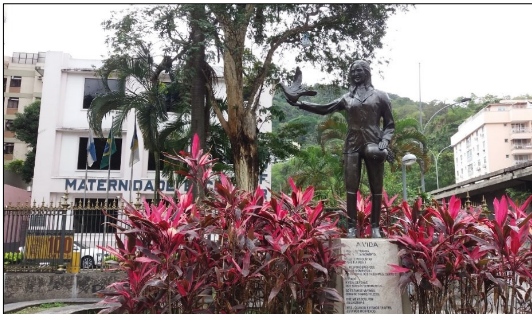
Figura 6 - Escultura de Ana Carolina da Costa Lino, 2001.