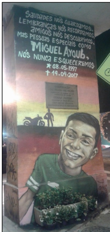
Figura 8 - Grafite de Miguel Ayoub, 2017.

De todos os jovens, o crime que aconteceu a Miguel Ayoub foi o mais noticiado por diversos veículos de imprensa, dentre os casos abordados aqui.