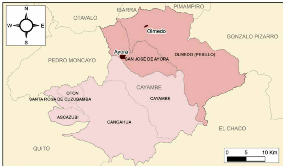
Figura 2. Parroquias rurales de Olmedo y Ayora, Cantón de Cayambe