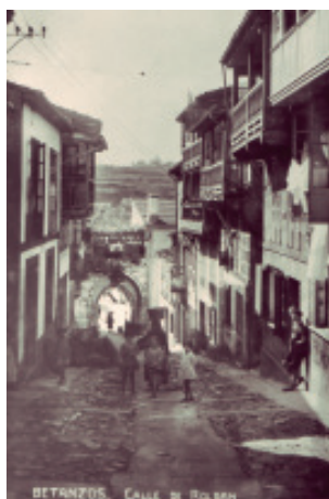
Anónimo (s.d.). A rúa dos Ferreiros a comezos do século XX cos baceles da porta da Ponte Nova.