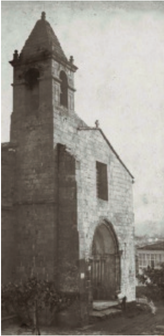
F. J. Martínez Santiso (ca. 1899). Obras da Praza da Verdura e da modificación da torre orixinal da igrexa de Santiago.