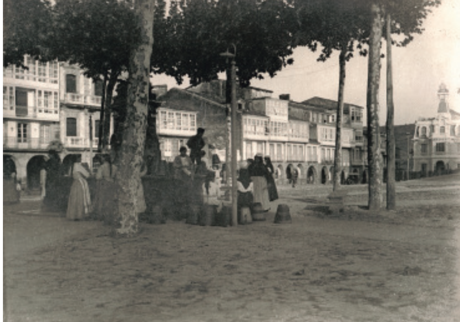
Anónimo (Anos 20). Augadoras na Fonte da Diana Cazadora.