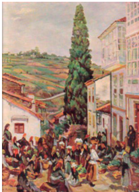
Pintura de Seijo Rubio desaparecida, ca árbore que se corta en 1940 baixo a Praza da Verdura, na 3ª venela.

Para dar a sombra necesaria ao gando e, en xeral, ás persoas que andaban pola feira, existía a necesidade de plantar novas árbores. Finalmente, plantáronse unha morea de