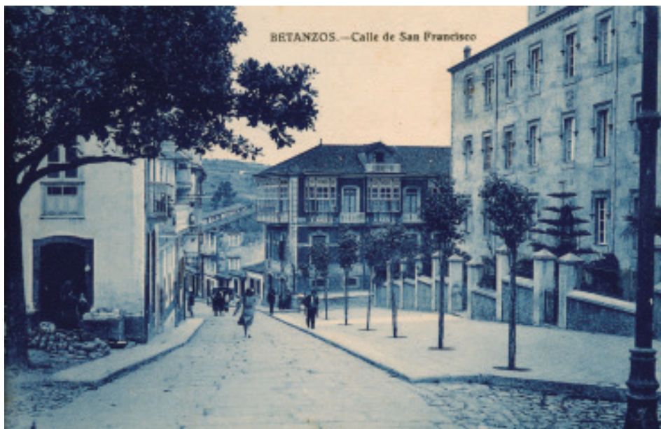
Anónimo (s.d.). Rúa de San Francisco entre 1919 e 1936.