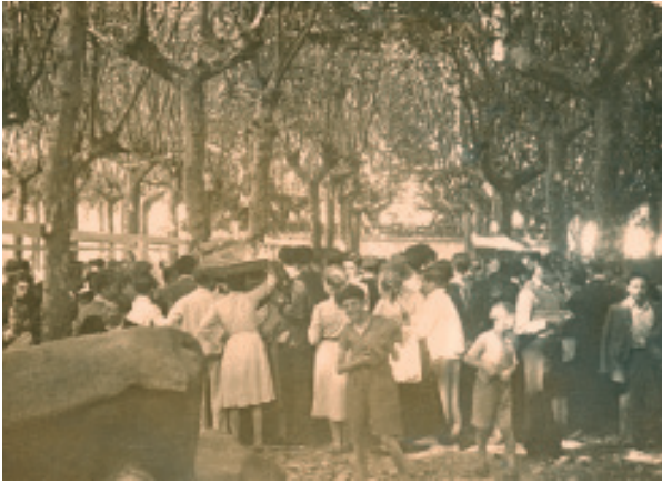
Anónimo (s.d.) Campo da Feira Nova.