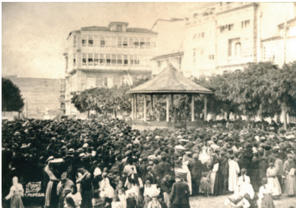
Mitin de Nicolás Salmerón no Palco da Música.

Formoso, onde as obras de renovación das canalizacións da zona parecen querer poñer punto e final a existencia doutro cedro de grandes dimensións que segue dando sombra ao pé do Mandeo.