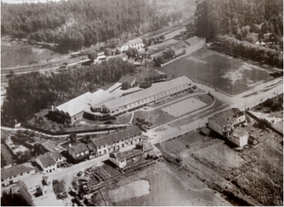
Anónimo (s.d.). Vista aérea do barrio da Magdalena, co Parque Municipal e o eucaliptal posterior. Arquivo da Asociación de Veciños da Magdalena e a Condomiña.