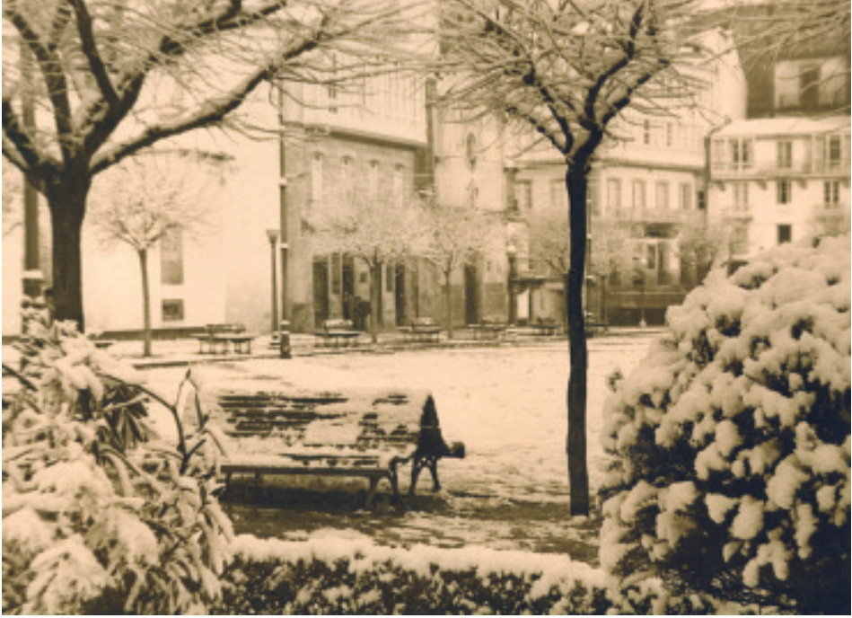
Germán Muíño (Anos 50). Xardíns nevados diante do Edificio Arquivo e no Cantón.

se talaran as especies que poboaban a zona e se substituíran por outras. Nunha nova do propio Concello con data de 29 de xaneiro do 2018 indícase unha nova substitución de especies, neste caso indicando que se trataba da: