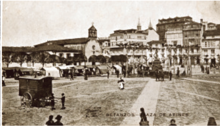
Ferrer (ca.1905). O Campo arredor de 1905.