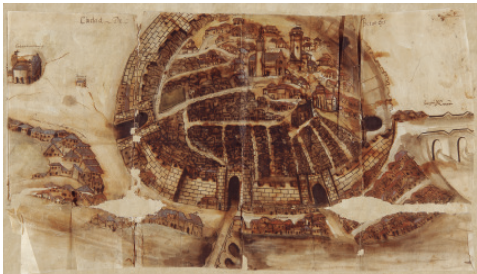
Antonio Vázquez (1616). Mapa da cidade de Betanzos para representar o incendio de 1616.