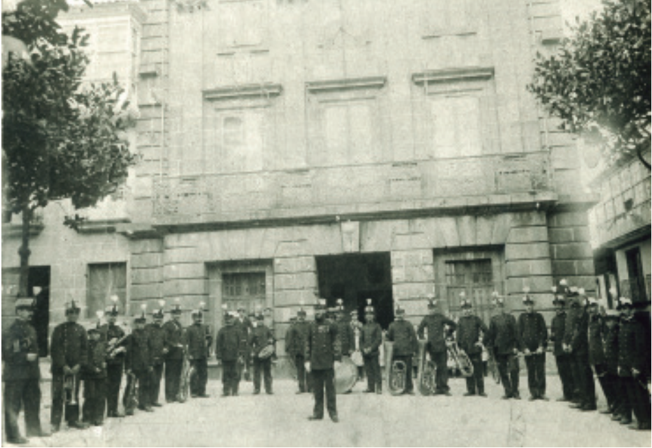
Fotografía da Banda Municipal de Betanzos no Programa de Festas Patronais de San Roque de 1911 cas dúas ringleiras de árbores.

Esta cita final está tirada, con moito rancor, da petición realizada por outros veciños ao Concello de Betanzos para que mantivese os exemplares no seu lugar, nun documento que rezaba o seguinte 23 :