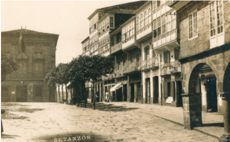
Ferrer (ca.1905). Praza da Constitución cas dúas ringleiras de árbores.