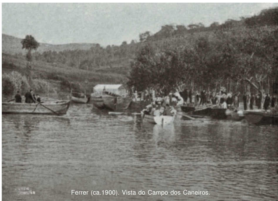
Ferrer (ca.1900). Vista do Campo dos Caneiros.