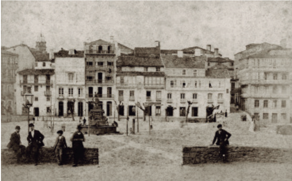
Francisco Javier Martínez Santiso (ca.1900). Vista da Praza do Campo dende o adro de San Domingo.

pinaster ) no quilómetro 14 da estrada N-651 da parroquia de Leiro (Pontedeume) ou un alcornoque ( quercus suber ) do Pazo de Santa Cruz de Mondoí (Oza-Cesuras).