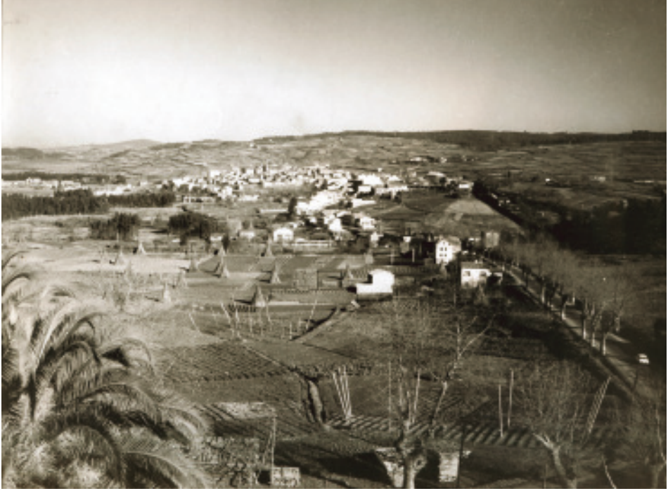
Anónimo (Anos 60). Vista de Betanzos arredor da década dos 60.