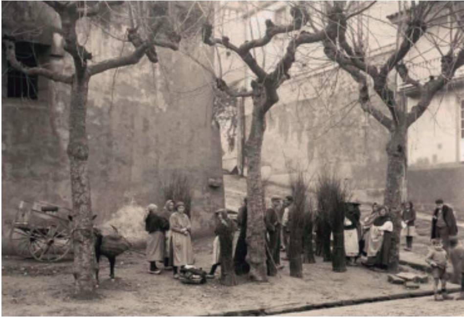
Fotografía do mercado dos vimbios na rúa dos Cabidos.