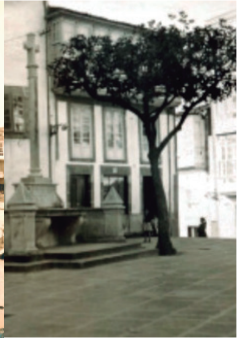
Anónimo. Monumento aos Caídos por Dios y por España inaugurado en 1946.

daños y perjuicios sin que dejen de reñir, de igual modo, con las buenas reglas de la estética y moderna exornación de las ciudades; todo ello según iremos viendo.