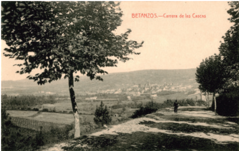
Fondo Alberto López (Principios do s.XX). Vista de Betanzos dende a Estación do Norte.