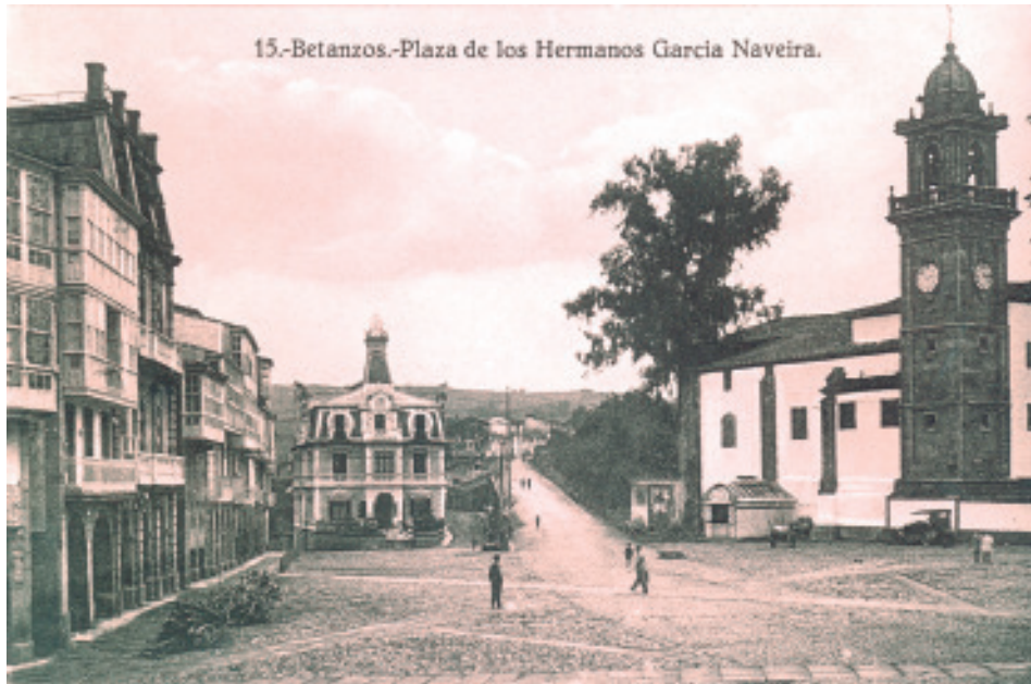
Anónimo (Anos 20). Imaxe da gran árbore ao pé da igrexa de San Domingo.

nese costado norte; así mesmo, tamén se indica que se plantan as árbores correspondentes co cantón pequeno e coa zona inmediata aos Soportais. Finalmente, por ornato e para evitar os desperfectos que causaba o tráfico de gando no enlousado da praza, desprázase o mercado de animais para a zona posterior do Picardel, actual praza de Afonso IX.