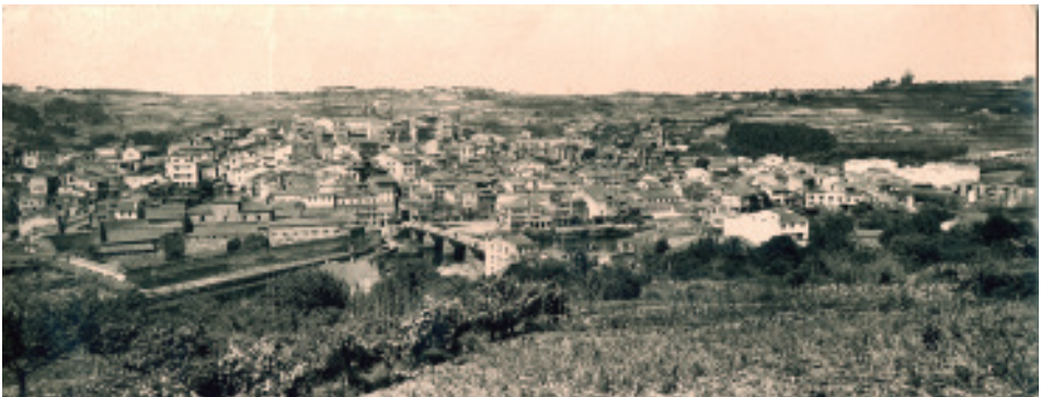
06 - Anónimo (Anos 60). Vista de Betanzos arredor da década dos sesenta.

Na comarca de Betanzos existen doce especies arbóreas catalogadas. Un dos lugares máis destacables é o insigne Pazo de Mariñán, onde os marqueses de Mos implantaron os xardíns de tipo mixto que se conservan. Nel consérvanse mirtos ( mirtus communis ), plátanos de sombra ( platanus x hispanica ), eucaliptos ( eucaliptus globulus ), unha pacana de Illinois ( carya illinoensis ) e un madroño ( arbutus unedo ), árbores que foron plantadas a finais do século XIX (Sánchez, 1999). Non en balde, polo resto de localidades próximas tamén se foron catalogando nos últimos anos varias árbores de interese histórico-natural: a secuioia xigante ( sequoiadendron giganteum ) do Pazo do Casal en Santa Marta de Babío (Bergondo), o teixo ( taxus baccata ) do antigo Pazo de Baldomir de Guísamo (Bergondo), o cocoteiro chileno ( jubaea chilensis ) plantado por Emilia Pardo Bazán no Pazo de Meirás (Sada), o pino insigne ( pinus radiata ) do Castelo de Santa Cruz (Oleiros), o ombú ( phitolacca dioica ) no Centro Cultural de Santa Cruz, un pino marítimo ( pinus