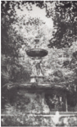
Anónimo (s.d.) Fonte das Catro Estacións no Parque do Pasatempo, a comezos do século XX.