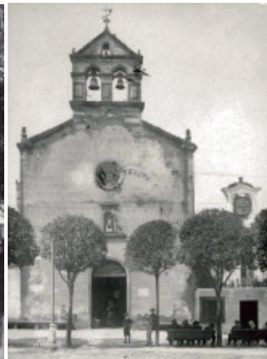
Francisco Javier Martínez Santiso (s.d.). Antiga capela de San Roque no Cantón Pequeno a comezos do século XX.

Nese plano medieval, non se concibía a posibilidade a integrar árbores monumentais no espazo público, como si sucedeu a partir do século XIX. O lugar predilecto para a introdución de especies vexetais eran as pequenas hortas traseiras das casas. Polo tanto, desta época apenas se poden contabilizar especies singulares.