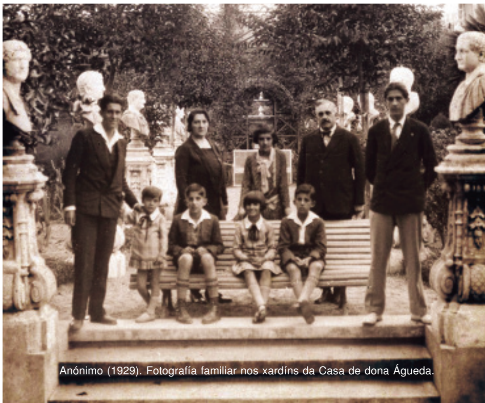
Anónimo (1929). Fotografía familiar nos xardíns da Casa de dona Águeda.