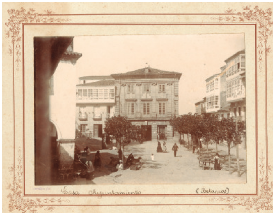
Avrillon (ca.1900). Praza da Constitución arredor do 1900 cas dúas ringleiras de árbores.

Mais non foi neste episodio cando o Concello de Betanzos arrancou os dezaseis magnolios da Praza do Concello, xa que ata os propios concelleiros chegaron a pedirlle ao alcalde que non o fixese para evitar que se «alterase el orden público» 25 ; nin tampouco en 1936, cando os veciños quixeron aproveitar as obras na rúa Sánchez Bregua para levantar as magnolias.