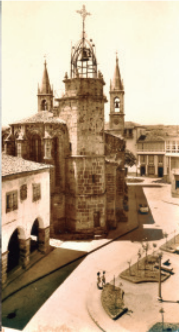
Anónimo (s.d.) Foto do xardín que se levanta despois de 1938.