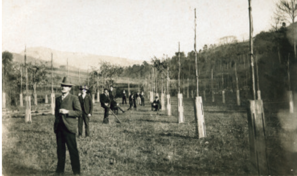
Anónimo (1901). Plantación das árbores no campo dos Caneiros.