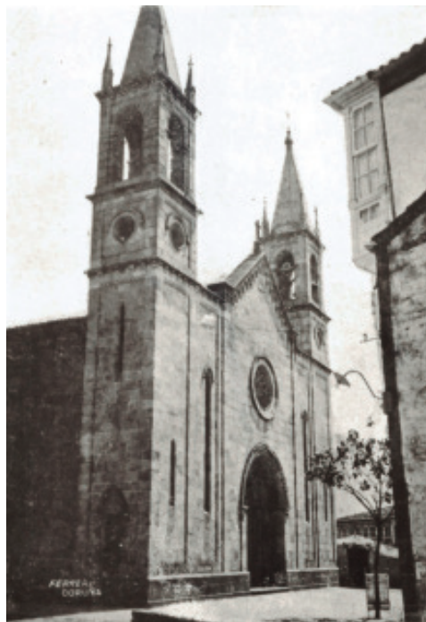
Ferrer (Inicios do s.XX). Fotografía do magnolio na primeira década do século XX.

2º Ignoramos si mientras dichos árboles fueron nuevos pudieron embellecer la mencionada Plaza -acaso le prestasen hermosura- pero hoy, podemos afirmarlo, solo sirven para causar