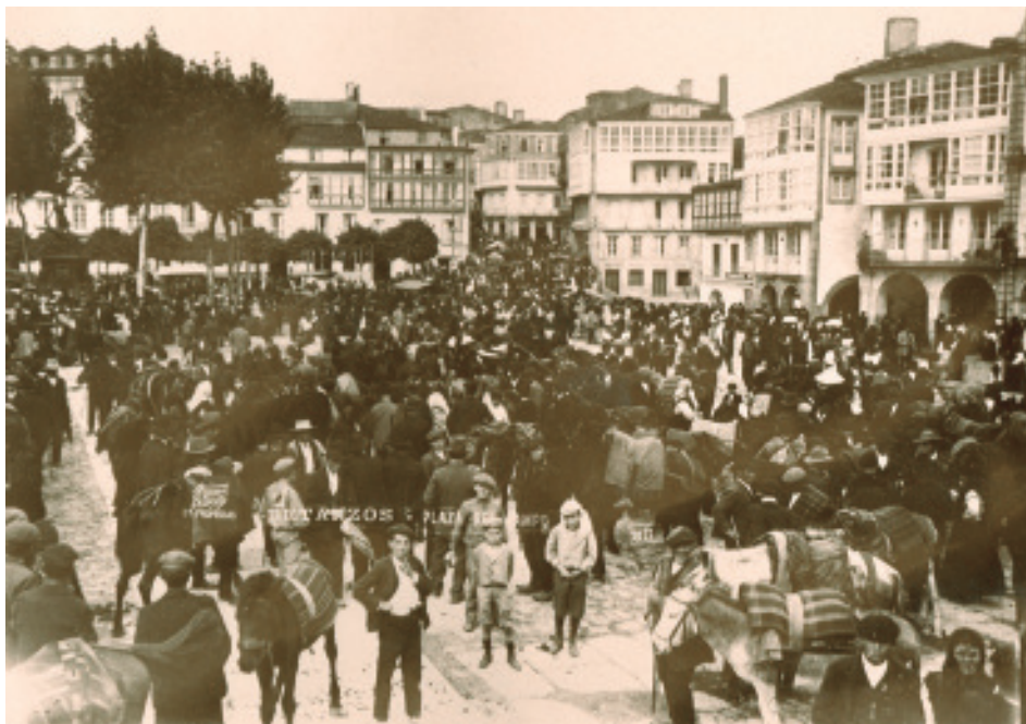
Ferrer (ca.1905). A Praza do Campo nun día de feira arredor de 1905.

requírese facer unha pescuda documental que, cando menos, permita dotar a estas árbores dun corpus escrito de referencia. Para iso hai que ter en consideración a consulta e análise dos proxectos de parques e xardíns que se conservan no Arquivo Municipal de Betanzos, fontes documentais que foron estudadas para este traballo e que achegan unha boa cantidade de datos inéditos.