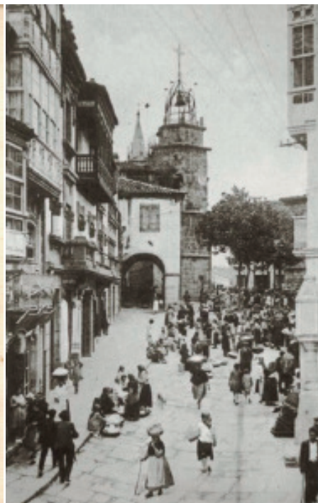
Anónimo (ca.1930). Día de feira na Praza da Constitución, ca ringleira de magnolios.

Es justicia que no dudan alcanzar del reconocido celo de esa ilustrada Corporación por todo cuanto redunda en beneficio de sus administrados.