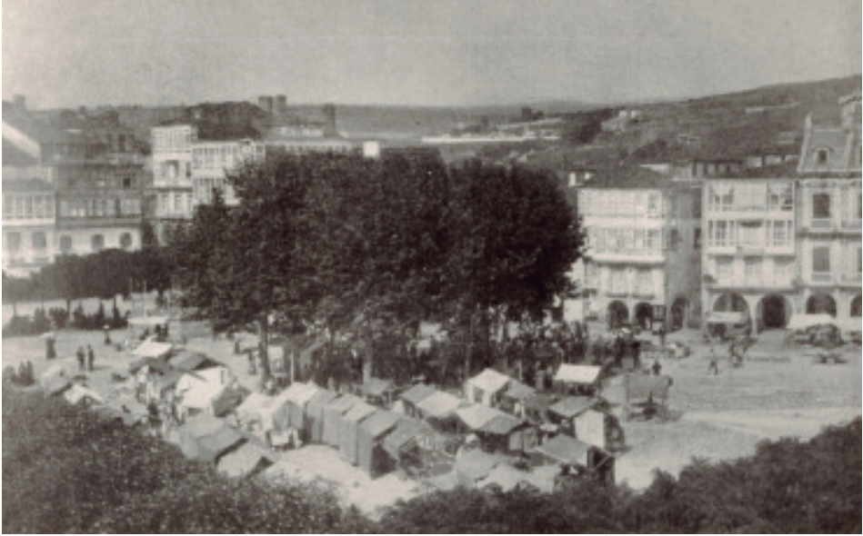
Campo da Feira a comezos do século XX.