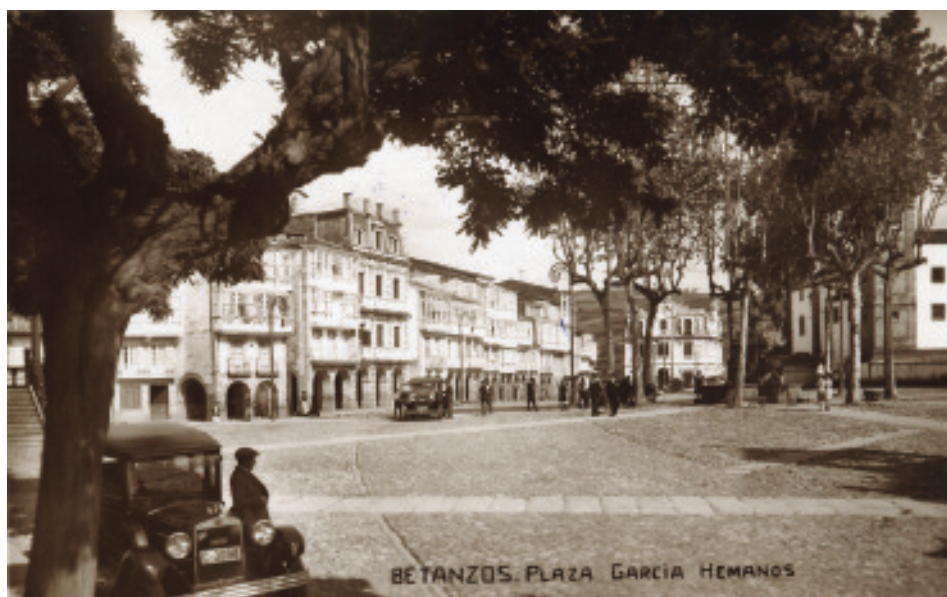
Anónimo (ca.1930). A Plaza García Irmáns en torno aos anos trinta.

de Sobrado, pero ante a orde de Felipe II se esixen unhas características que, grosso modo , consistían en que cada árbore tiña que ter unha altura de tres varas -aproximadamente dous metros e medio- e un grosor de un venablo -aproximadamente 0,55 centímetros 11 .