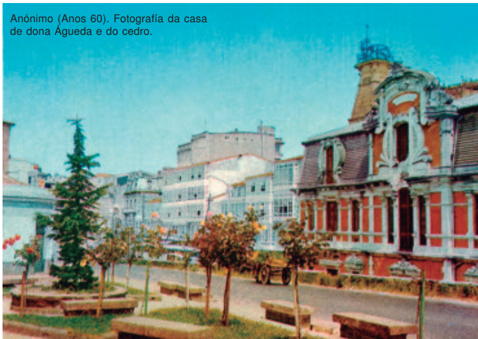
Anónimo (Anos 60). Fotografía da casa de dona Águeda e do cedro.