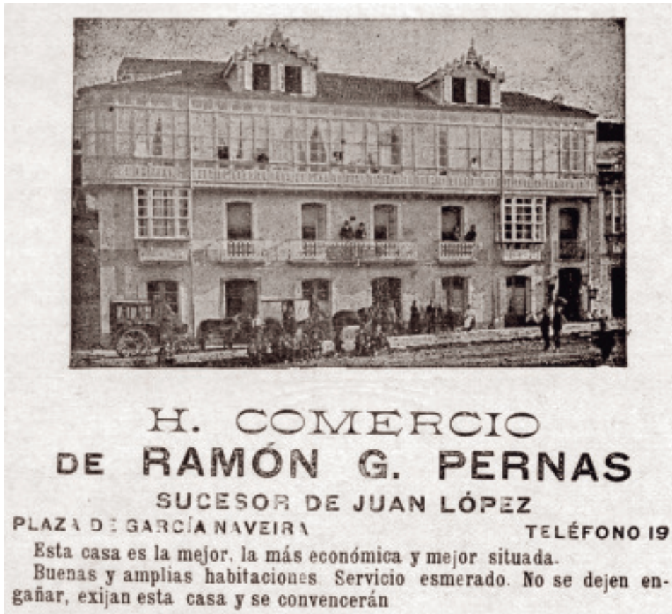
Anuncio do Hotel Comercio para o Programa das Festas de San Roque de 1923.

substituídas, motivo polo que non aparecerían nas imaxes de principios do ano 1900 pero si nas do mesmo ano nun período algo posterior. De feito, si aparecen árbores pequenas tiradas desde o adro en documentos gráficos dese mesmo ano e, xa con certo porte, en fotografías do 1905. Dese mesmo lustro deben ser as situadas por diante do adro e separando os espazos da actual praza García Naveira da Praza de Galicia -que se situaba fronte ao Edificio do Arquivo-.