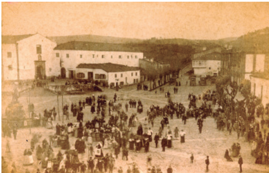
Francisco Javier Martínez Santiso (1894). Procesión de Xoves Santo.

Mandeo e Mendo contiñan unha orografía moi irregular, os terreos eran moi propicios para a actividade agrícola, cuxa colleita se vendía na súa meirande parte nas feiras.