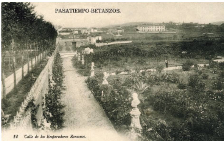
Avenida dos Emperadores na parte baixa do Pasatempo.