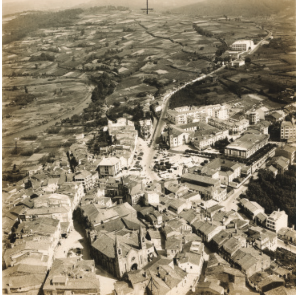
Anónimo (ca.1960). Vista aérea de arredor de 1960 na que se distingue o magnolio diante da igrexa.