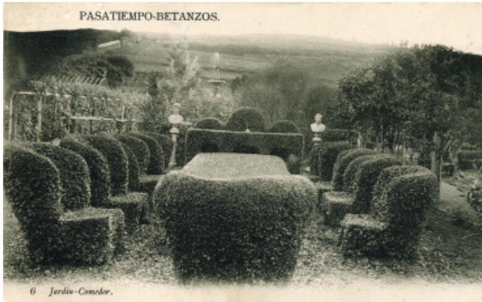
Anónimo (s.d) Xardín-Comedor representado con buxo na parte baixa do Pasatempo.

dormitorio e o comedor da casa (Arcay, Duo, Souto, 2020: 276-277) do maior dos Naveira, nunha réplica que chamaba enormemente a atención dos visitantes; era unha verdadeira obra da topiaria máis sofisticada.