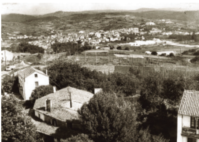
Gabín (Anos 60). Vista de Betanzos dende a Angustia.

distinción ten como obxectivo a conservación dunha especie vexetal no tempo, de maneira que sexa percibida na sociedade como un elemento máis do patrimonio natural e cultural que vive no día a día.