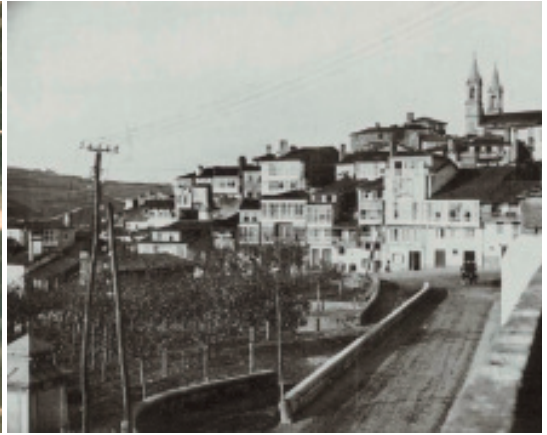
Anónimo (ca.1910). Vista da plantación de árbores da Feira Nova.

plátanos na primeira década do século XX. Mesmo desde o xornal Nueva Era 30 chegan a solicitar, en 1913, que se faga unha inversión nun xardín que eles xa chamaban «del Buen Retiro» pechando cunha verxa a zona do antigo Picardel, decorando con cadeiras e mesas de ferro e aproveitando as iniciativas industriais que quixesen explotar o negocio de bebidas para deleite de todos os que se achegaran a esta zona de Betanzos, xa ambientada cos plátanos da Feira Nova.