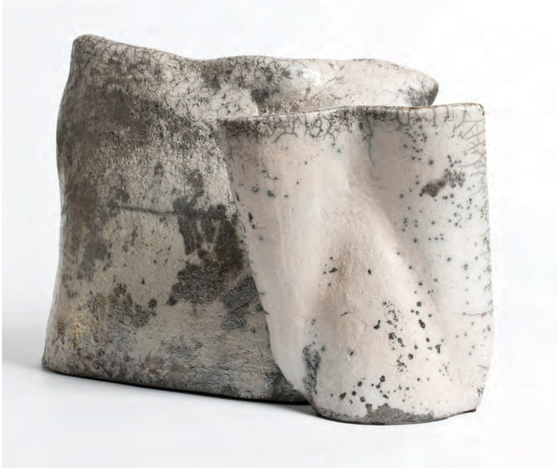
Unidas . Rakú, barro de Zacatecas, blanco cracket, 29 x 20 x 28 cm, 2012