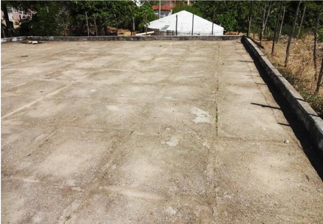
Figura 4. Cisterna de calçadão do P1+2.

Podemos dizer que as cisternas representam o “principal exemplo de como é possível atender à demanda hídrica familiar, pelo menos sob o ponto de vista da saúde e da segurança alimentar e nutricional, combinando elementos de participação social, atuação do poder público e emancipação das famílias” (Arsky et al. 2013: 142).