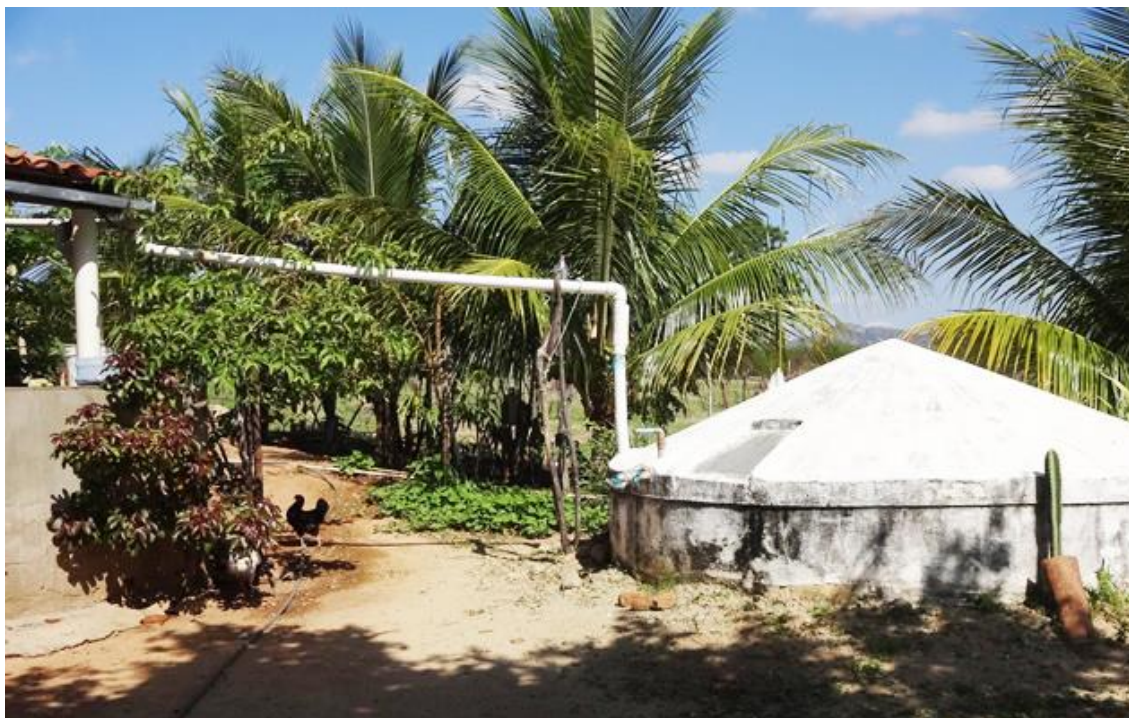
Figura 3. Cisterna de placa do P1MC.

e, principalmente, o entendimento de que a água é um direito e a cisterna é uma conquista da família.