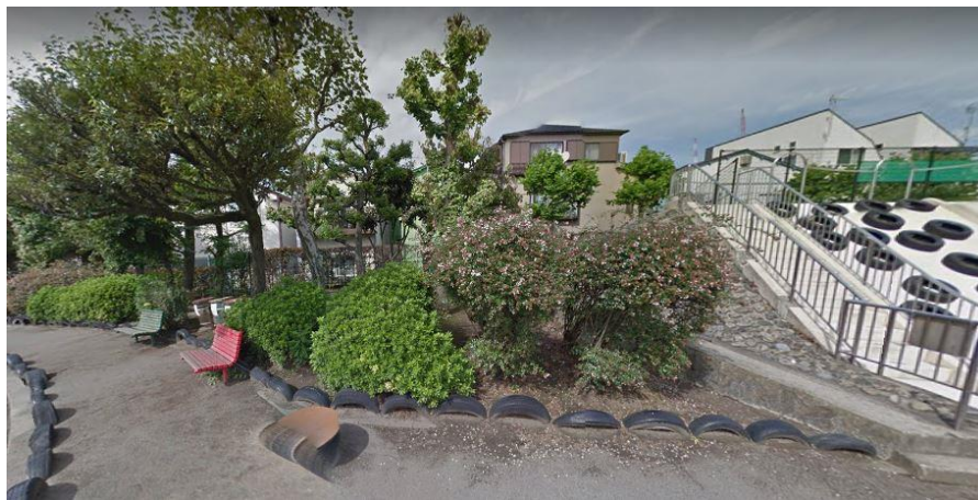
Figura 8. Vegetación diversa dentro del parque