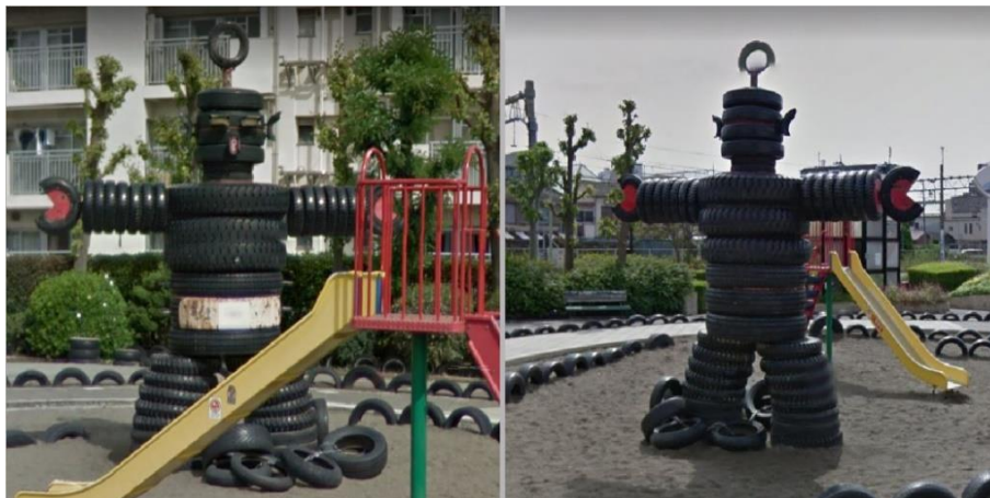
Figura 4. Escultura del robot con neumáticos reciclados