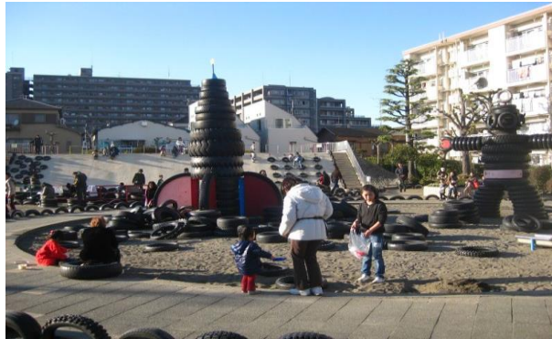
Figura 7. Familia en el parque Nishi-Rokugō, Tokio (Japón)