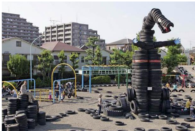
Figura 6. Escultura del enigmático personaje conocido como Godzilla