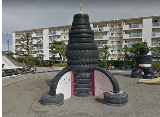
Figura 5. Nave espacial a base de neumáticos reciclados