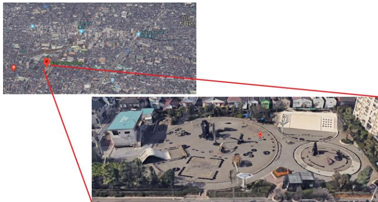
Figura 2. Ubicación del parque Nishi-Rokugō (Parque de los neumáticos)