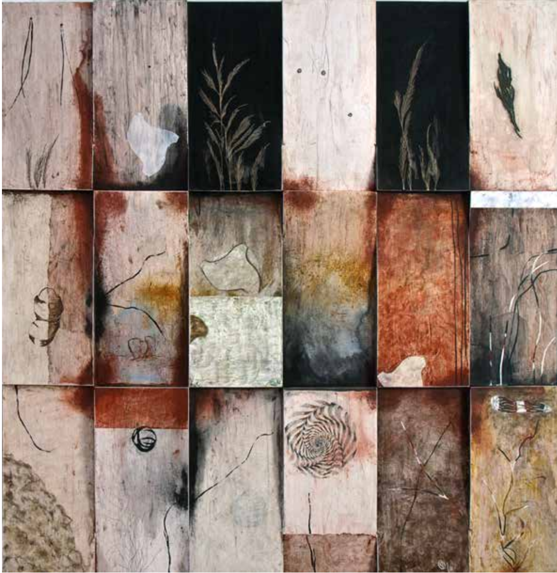
Sin título (detalle del políptico de 36 piezas (díptico). Encáustica/madera, 120 x 200 cm, 2011