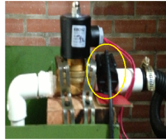
Figura 4. Sensor de caudal instalado.

Para sensar el nivel, establecido en 4 puntos específicos, se usa el sensor de nivel por ultrasonido, referencia SRF06 , que presenta una señal de salida de 4-20 mA , sencilla de acoplar al PLC, el cual basado en estos valores, toma la decisión necesaria en el proceso. La figura 5 muestra uno de los tres sensores instalados.