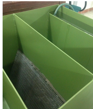
Figura 1. Equipo separador CPI.

Antes de iniciar con la construcción del separador, se hace necesario conocer su funcionamiento: en primer lugar, se da el ingreso de la mezcla, que reduce su velocidad de tal manera que permite que los sólidos se precipiten al fondo mediante la trampa de arena, así las gotas de aceite suspendidas flotan hacia la superficie. Luego, la mezcla ingresa a través de un amortiguador, el cual la distribuye hacia las placas corrugadas; quienes tienen la forma de un panal de abejas, atrapando al aceite libre, para luego llevarlo hacia la superficie, en la medida que el tamaño de la partícula de aceite sea lo suficientemente grande; posteriormente, se descarga por la salida que haya sido asignada y el agua que pasó a través de estas placas es enviada hacia la salida. En la figura 1 se puede apreciar el esquema del separador implementado.