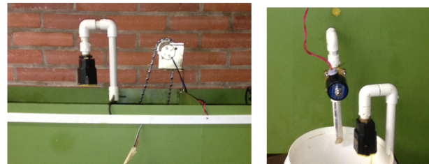
Figura 5. Sensor de nivel por ultrasonido.