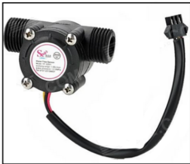
Figura 3. Sensor de caudal YF – S201.

Con respecto a la medición del caudal, se ha establecido como apropiado el sensor YF-S201 , mostrado en la figura 3, no solo por su costo, sino por sus características, su facilidad de uso y fiabilidad en la señal medida, evidenciado en las pruebas realizadas previamente a su montaje.