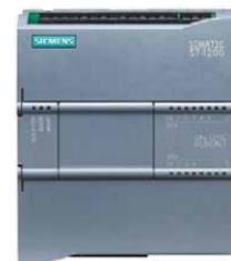
Figura 6. Controlador lógico programable.

Para llevar a cabo la Automatización del sistema, se usa el Controlador Lógico Programable, SIMATIC S7 1200, mostrado en la figura 6, que realiza las siguientes tareas: