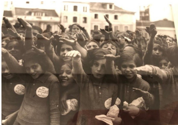
Figura 3 – Crianças dos asilos e escolas de Lisboa em 1889

Abaixo, segue ilustração de crianças dos asilos e escolas de Lisboa no fim do século XIX, encontrada em exposição iconográfica na Coleção Moderna do Museu Calouste Gulbenkian, no mês de novembro de 2019.