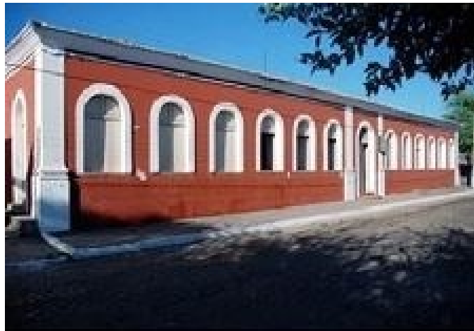
Figura 1 – Fachada recente do prédio onde funcionou o Estabelecimento Rural São Pedro de Alcântara