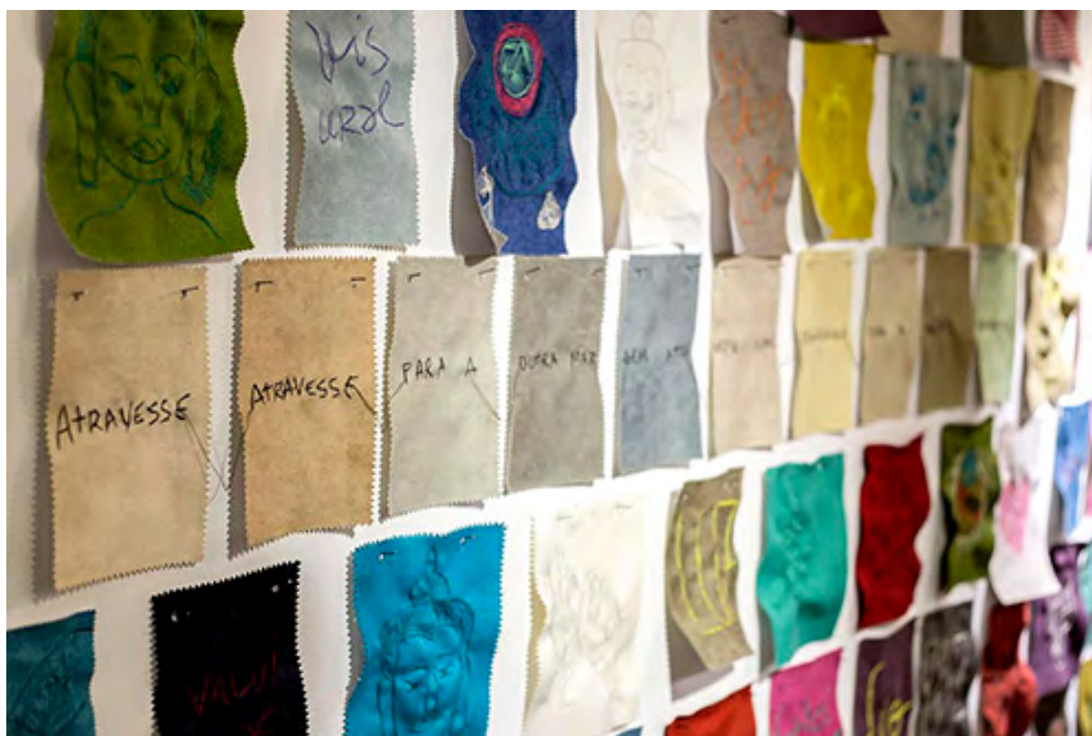
Foto 10: Exposição despida de palavras (2018), Galeria Teix, Curitiba (PR).