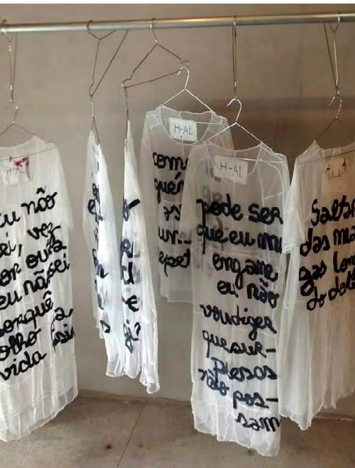
Foto 11: Vestidos com a letra da música Vez por outra , escrita por Benito Rodrigues e musicada pelo Grupo Fato (2016).