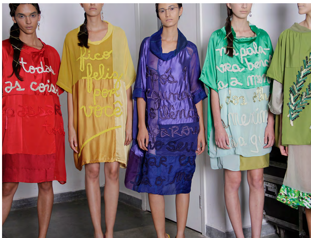
Foto 9: Backstage do desfile poesia desilusória (2017).