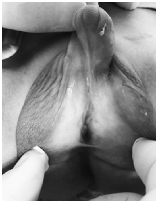
Imagen 2. Hipospadia perineal con escroto de aspecto vulvar. Valoración urológica: meato uretral en escroto, hernia inguinal izquierda con gónada disgenética, gónada derecha mejor desarrollada, falo corvo severo

Biopsia de gónada: testículo disgenético con escasa albugínea, túbulos seminíferos de diferentes formas y tamaño, células de Sertoli presentes, escasas gonias, microcalcificaciones; debajo de la albugínea estroma tipo ovárico.