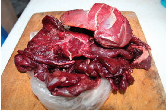
Carne de venado, utilizada como alimento.