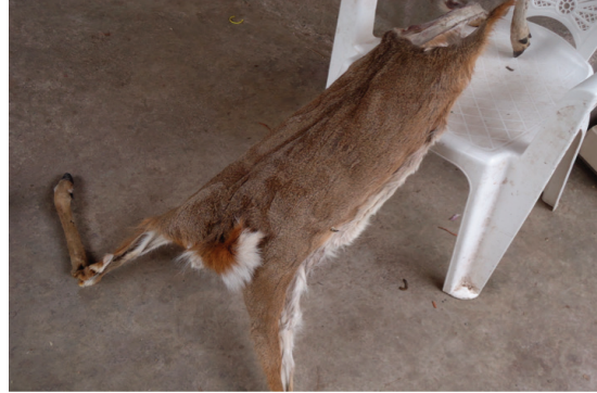
Piel de venado cola blanca con valor de uso de adorno.

grasa y estructuras anatómicas, como colmillos, patas y garras) para el autoabasto.