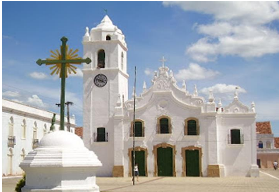
Icó-Ceará, 2008.