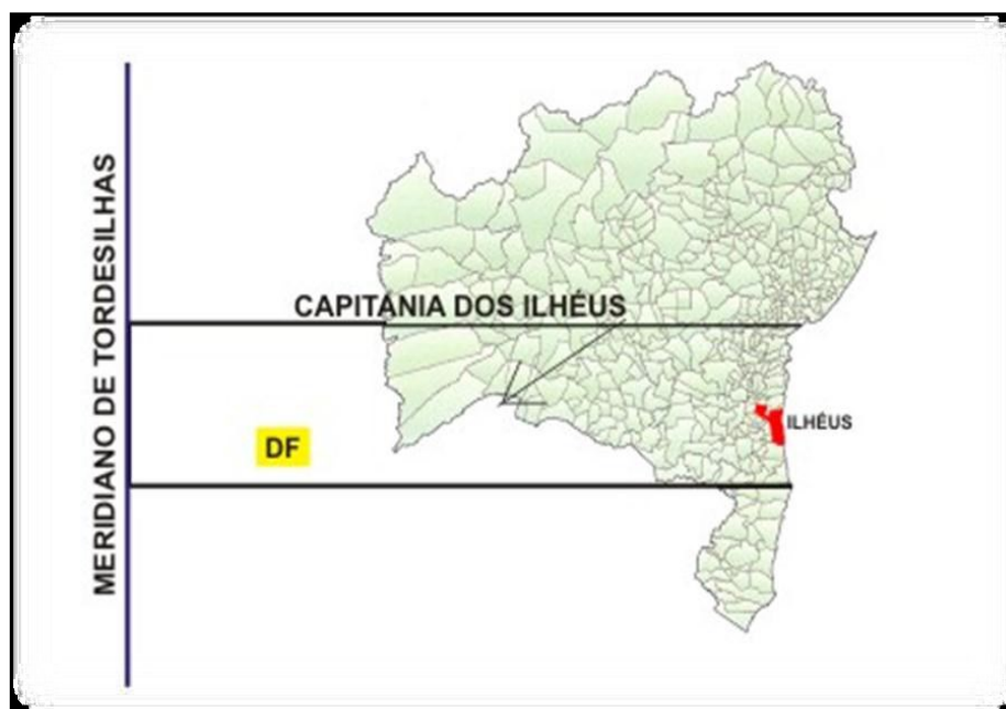
Figura 2- Mapa do Estado da Bahia com traçado correspondente ao território da Capitania de São Jorge dos Ilhéus 22 .

Paulo, na Península de Marau, até o rio Jequitinhonha, em Belmonte 20 – e, ainda, pelo abastecimento interno da capitania da Baía de Todos os Santos 21 ; o que escancara duas realidades sobre estas populações: a intensa condição de escravização a que eram submetidas e a insurgência, protagonismo e resistência como mecanismos de luta pela vida, pela sobrevivência, pela liberdade e pela terra. Abaixo o mapa apresentado delimita o perímetro da Capitania de São Jorge dos Ilhéus.