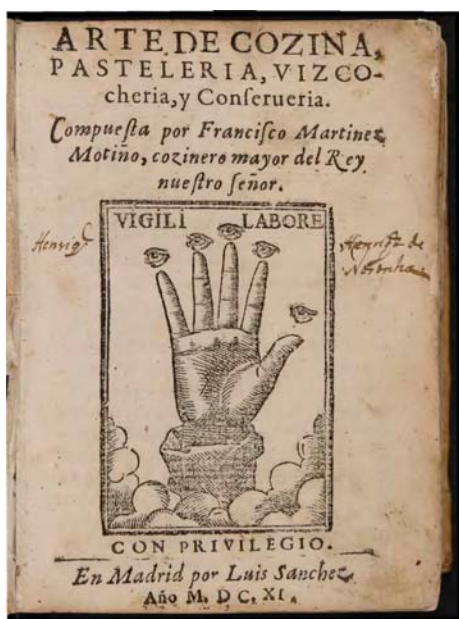
Fig. 1. Portada 1ª edición (1611), Library of Universidad de California San Diego.