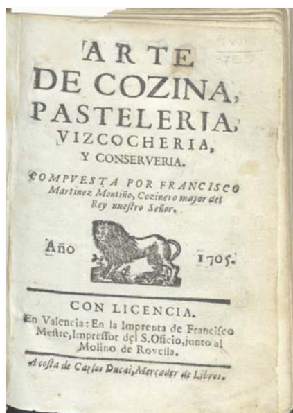
Fig. 2. Portada edición 1705, Biblioteca Valenciana Nicolau Primitiu.