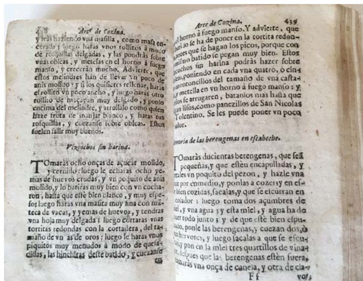
Fig. 4. Primer error de paginación de la secuencia 439-448.

de paginación en la secuencia 439-448, característico de esta impresión valenciana (Fig. 4).