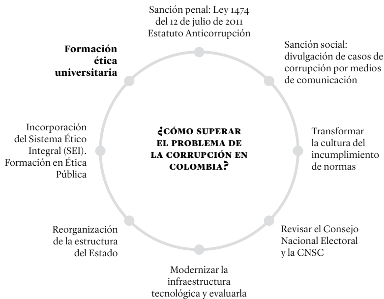
FIGURA 2 | Alternativas para superar el problema de la corrupción en Colombia

Frente al panorama planteado, aparece una pregunta ineludible: ¿por qué el Estado es tan proclive a la corrupción?, Más aún, ¿cómo superar el problema de la corrupción en Colombia? Para dar respuesta a estos planteamientos, han aparecido diversas estrategias que se pueden consolidar en la Figura 2: