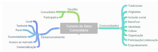
Figura 1: Diagrama de análise a partir das produções da base Scielo, sciencedirect, capes, sbecotur.

Os termos “local”, “indígena”, “tradicional” têm surgido com frequência, chamando atenção para pluralidade de sistemas de produção de saber no mundo e para importância nos processos de desenvolvimento. O Turismo de Base Comunitária e seu desenvolvimento tem encontrado em comunidades tradicionais e originárias possibilidades de contribuir como alternativa econômica ofertando trabalho e renda e contribuindo para diminuir a vulnerabilidade social e econômica de regiões menos favorecidas. Especificamente nos textos analisados foram identificados (Figura 1) colaborações que justificam essa afirmativa.