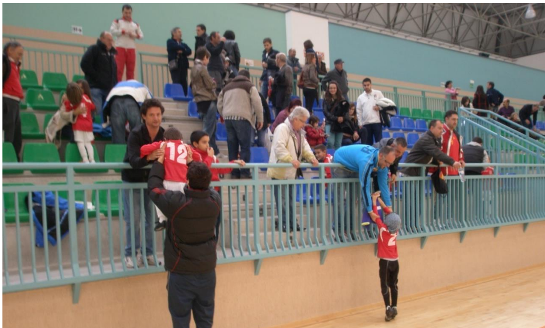
Figura 2. Al final del partido los familiares recogen con cariño a sus niños y les ayudan a cambiarse (Imagen tomada el 17 de noviembre).

En gran número de ocasiones, las familias modifican sus propias dinámicas para acudir y atender la actividad deportiva de sus niños, implicando una organización o aplazamiento de quehaceres instrumentales.