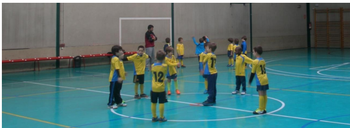
Figura 3. Los jugadores realizan el calentamiento de forma autónoma y mecánica ante la atenta mirada de su entrenador (Imagen tomada el 8 de enero).

Se promueve que los jugadores, liderados por compañeros con más dotes físico-sociales, sean capaces de desarrollar un calentamiento de forma autónoma, a modo de buen hábito útil para su futuro.