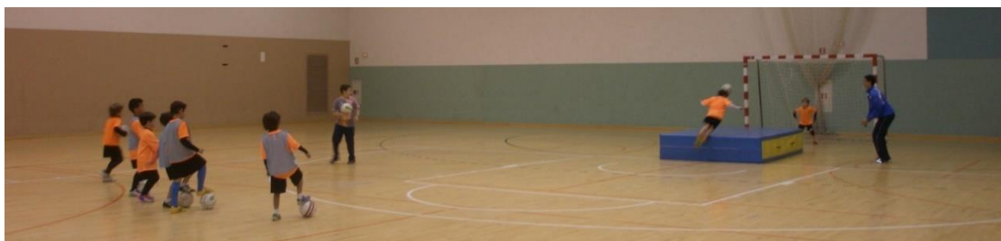
Figura 5. Premio de una actividad lúdica en la que hacer filigranas por un buen entrenamiento (Imagen tomada el 16 de diciembre).

El entrenador tiene muy buen humor desde el inicio del entrenamiento, además no ha preparado tanto el entrenamiento como es habitual. Tras las tareas importantes del entreno valora que ha sido buen entreno, por lo que hay premio: pone una colchoneta y comienzan a golpear de cabeza y de chilena -figura 5-, algo muy poco habitual (Diario de Campo: 737, 16 de diciembre).