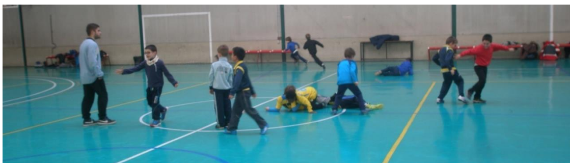
Figura 4. Los jugadores emprenden un juego motriz espontáneo en espera del entrenador principal antes de un entrenamiento (Imagen tomada el 27 de enero).

Un entrenador lamenta de forma recurrente “Esto parece el patio del colegio” cuando se muestra desbordado por el caos de juego que desarrollan los niños cuando no atienden normas adultas para jugar (Diario de Campo: 34, 16 de octubre).