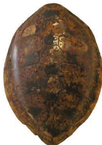
(Fig. 7) Casca de tartaruga que antigamente estaba no Museo Pedagóxico das Escolas García Naveira. Museo das Mariñas.

se conservan no Museo das Mariñas, así que, polo menos, pódese imaxinar o que había no recinto grazas a el.