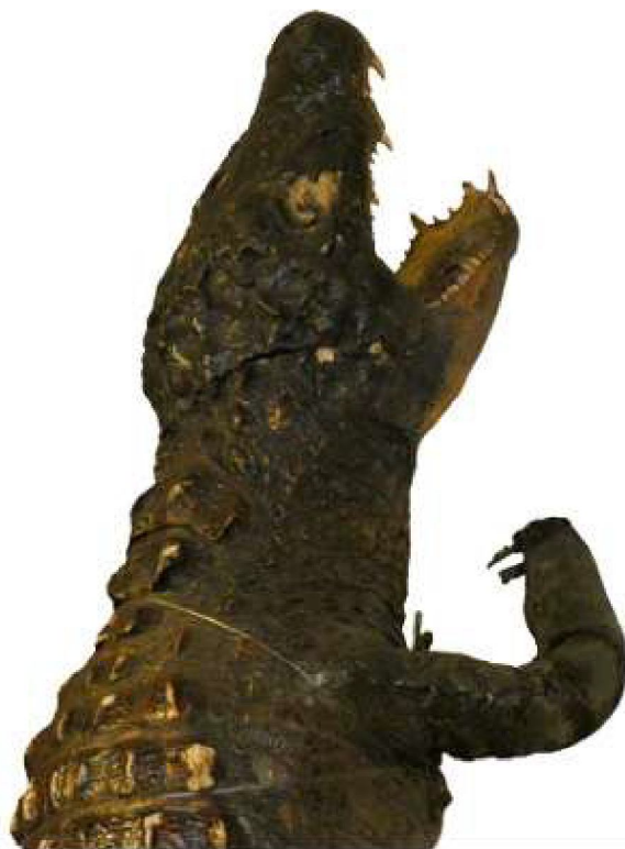
Fig. 8) Crocodilo disecado que antigamente estaba no Museo Pedagóxico das Escolas García Naveira. Museo das Mariñas.