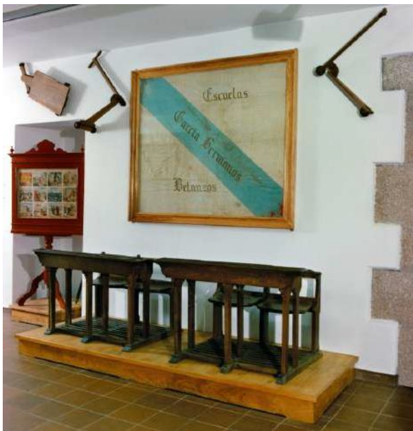
(Fig. 2) Sala dedicada ás Escolas García Irmáns no Museo das Mariñas de Betanzos.

Con todo, no presente traballo transcribíense catro inventarios que se conservan no Arquivo Municipal de Betanzos 1 . Estes serven para coñecer a historia e procedencia que atinxe a cada un dos obxectos expostos no Museo das Mariñas que proceden das antigas Escolas e Asilo García Irmáns, así como para imaxinar que outros obxectos había na institución dos García Naveira. Neste sentido, caben mencionar tres inventarios relacionados coas Escolas –concretamente, un das aulas femininas, outro as masculinas e un último das de párvulos– e un do Asilo. Así mesmo, a datación destes inventarios permiten coñecer como eran as escolas e o asilo no momento no que se inauguran, xa que os das escolas datan de setembro de 1914 e o do asilo, aínda que non estea datado, intúese que é de 1912, ano no que se funda dito recinto.