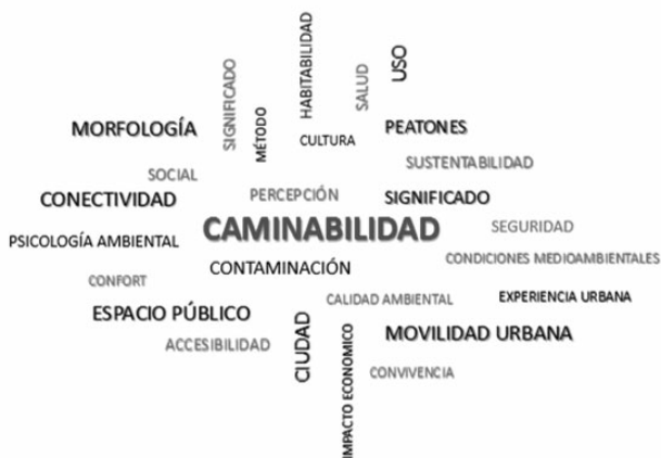
Ilustración 3, Elaboración propia. Relación de conceptos para su estudio en la complejidad.

Continuando con el estudio del imaginario, está la contribución de Guzmán (2016) quien señala que “a partir de los imaginarios constituidos por imágenes, informaciones, experiencias simbolismos y fantasías se reconstruyen visiones del mundo con efectos y propósitos de la acción cotidiana expresados en el hábitat.