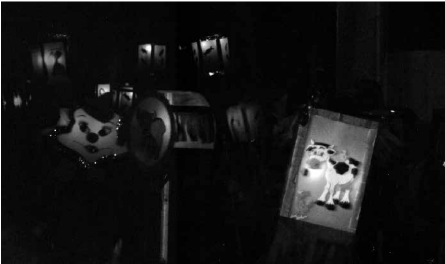
Caperuzas de La Pandorga, 2000