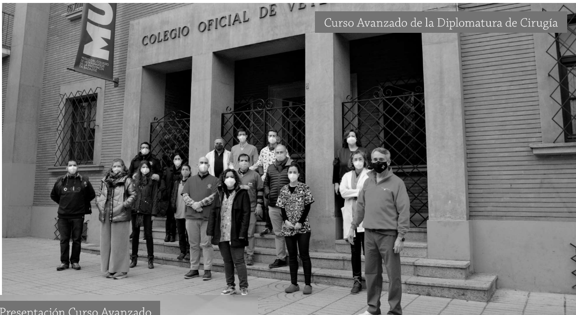
Presentación Curso Avanzado

Este contenido teórico se materializó con las sesiones prácticas que consistieron en la realización de; estenosis de los orificios nasales; cirugía de paladar elongado; premaxilectomía unilateral; hemimandibulectomía; drenaje torácico; abordajes al tórax; lobectomías; tumores de la pared costal; esofagostomía; ductus y cuarto arco aórtico; traqueotomía; la técnica Billroth y nefrotomías.