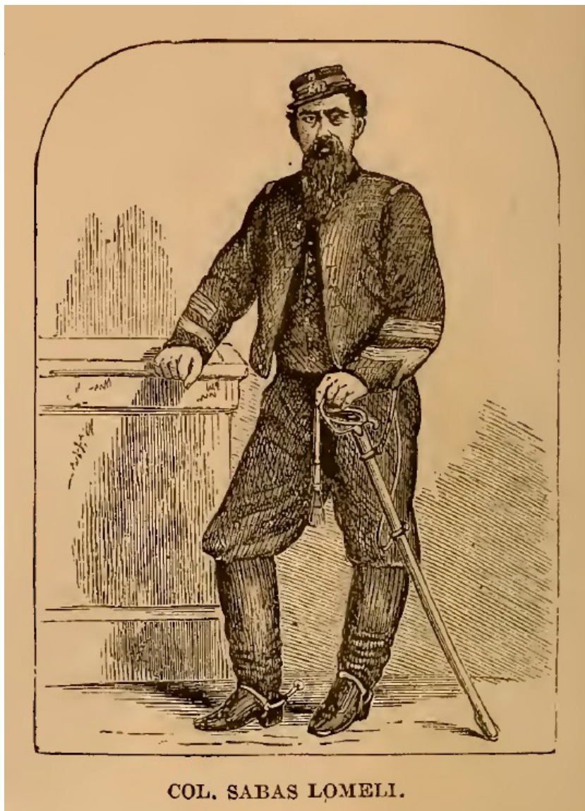
Imagen 1. Coronel Sabas Lomelí.