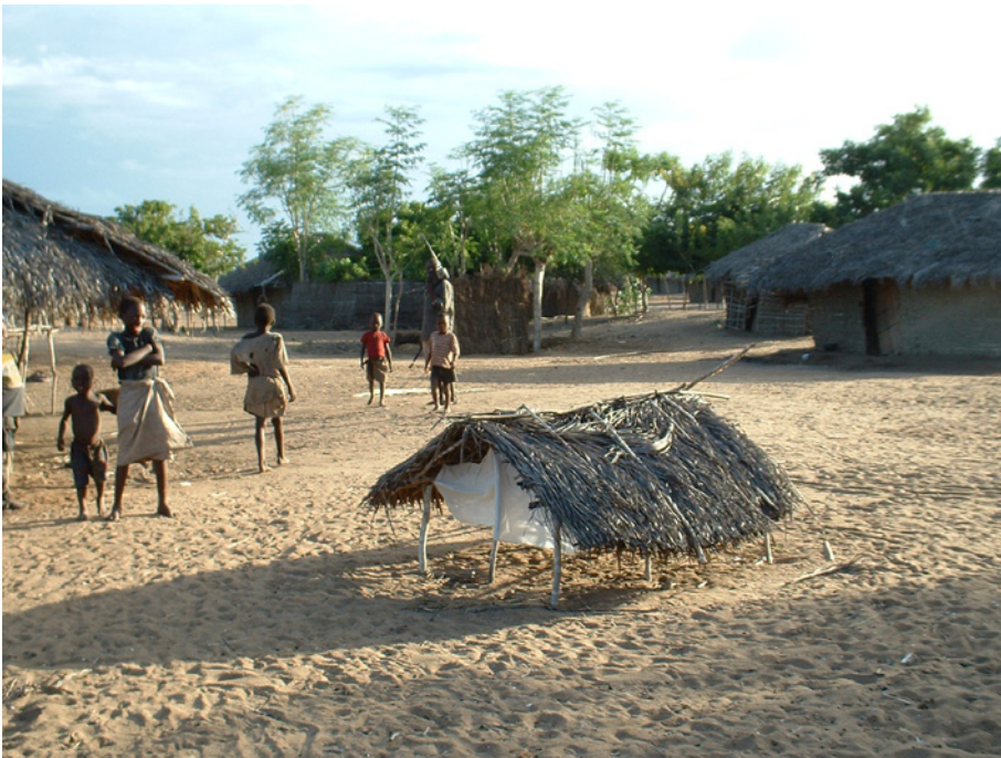
Figura 5: representa lo que sería la versión más minimalista de un ikuitti .

Veamos tres ejemplos gráficos (figuras 5, 6 y 7) de estas construcciones denominadas ikuitti . Como se aprecia, la forma puede variar mucho. Para la descripción remito a los pies de foto.