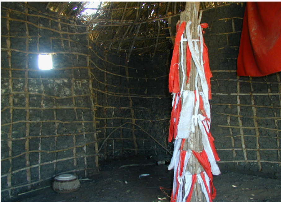
Figura 7: interior de otro ikuitti distinto, de la misma tipología que el anterior. Apréciase la vasija, tapada con un plato, en la que se deposita comida para el jini y el pilar central denominado nrima , donde la curandera realiza sus oraciones e invocaciones; también se aprecia el ábside que reproduce la forma del mihrab .