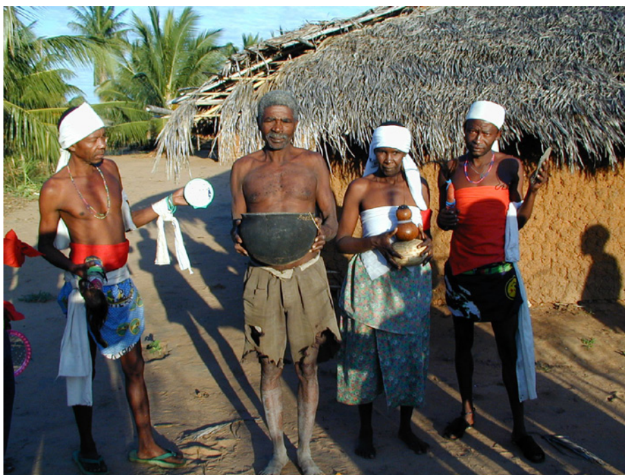
Figura 4. Aldea de Muinde, actuación contra la hechicería a cargo de los curanderos de Siriça, junio de 2004. En la imagen aparecen tres de los curanderos participantes, una mujer y dos hombres, con sus atuendos de akhulukana y algunos de los instrumentos usados para localizar hechiceros y hechizos (ellos con rabo de animal o muilla y espejo y ella con calabaza). Con el torso desnudo aparece uno de los acusados de hechicería, llevando en la mano la vasija de barro en la que guardaba su hechizo según le obligaron a confesar.

se le obliga a bailar semidesnudo de forma grotesca delante de todos, provocando la mofa de la comunidad. Incluso por momentos se le hace danzar sobre brasas. Cuando este circo concluye, se somete al hechicero a una muerte simbólica: es enterrado vivo. Se le entierra superficialmente de forma que no llegue a sufrir asfixia, pero se le llega a cubrir de tierra. Permanecerá así el resto de la noche. Al alba será desenterrado. Simbólicamente ha muerto y resucitado; ha muerto como persona que hace el mal y resucita como malhechor que ha purgado su culpa. Pero en este proceso ritual todavía faltan dos detalles. Primero, el curandero le practica una pequeña incisión en el escroto e introduce una especie de pasta vegetal que se supone que es un medicamento tradicional contra la hechicería, de forma que si el hechicero vuelve a realizar hechizo dicha sustancia actuará matándolo.