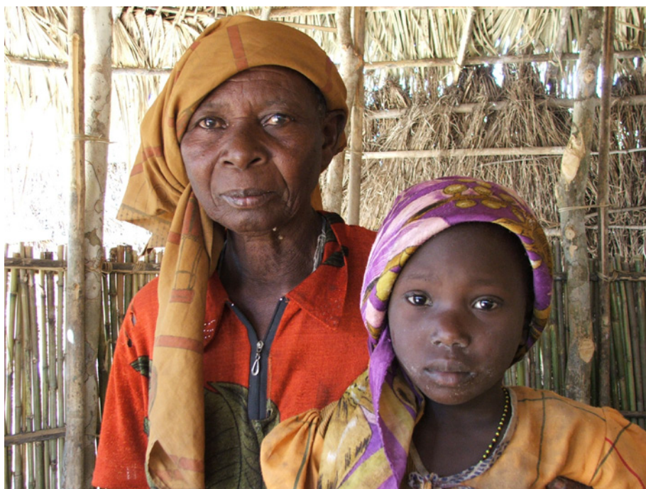
Figura 2. Julio de 2005. La apwiamuene de Natuco, la anciana Massapura, máxima autoridad tradicional. La niña que aparece con ella ha de ser su sucesora, siendo educada por la anciana desde muy pequeña para que aprenda todos los conocimientos asociados al cargo.

La apwiamuene y los mahumu —como consejo de ancianos— formaban la estructura de poder político tradicional, con funciones tanto políticas —hoy en día muy menguadas por la modernización política— como religiosas. La cabeza de esta jerarquía es la apwiamuene seguida del humu del linaje dominante y luego el resto de los mahumu 11 . Sobre esta estructura tradicional se impone la estructura administrativa oficial del estado moderno, las coloquialmente conocidas como autoridades gubernamentales en oposición a las autoridades tradicionales : jefes de barrio, aldea, localidad y distrito. Sin olvidar la importancia política fáctica que desempeña el siempre temido jefe local del todopoderoso partido Frelimo (se trata de un área monocolor Frelimo ); en ciertos casos puede llegar a ser el mayor poder político en la sombra, por encima del jefe de aldea.