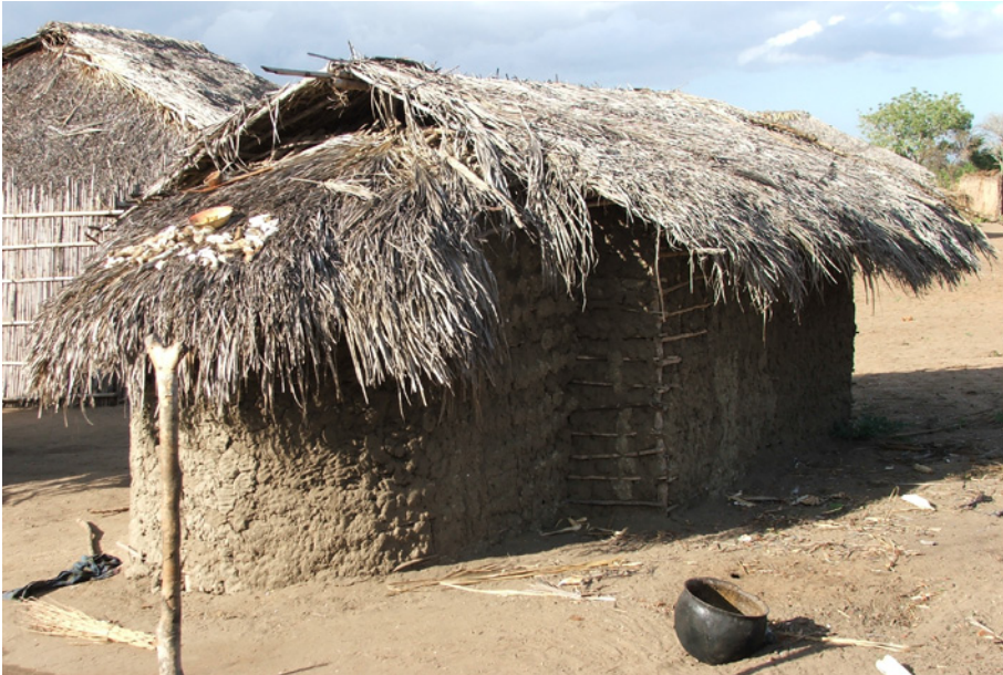
Figura 6: representa una forma más compleja que reproduce la morfología de una mezquita tradicional, incluyendo el clásico mihrab de las mezquitas; este ábside es el lugar concreto que ocupa el jini .