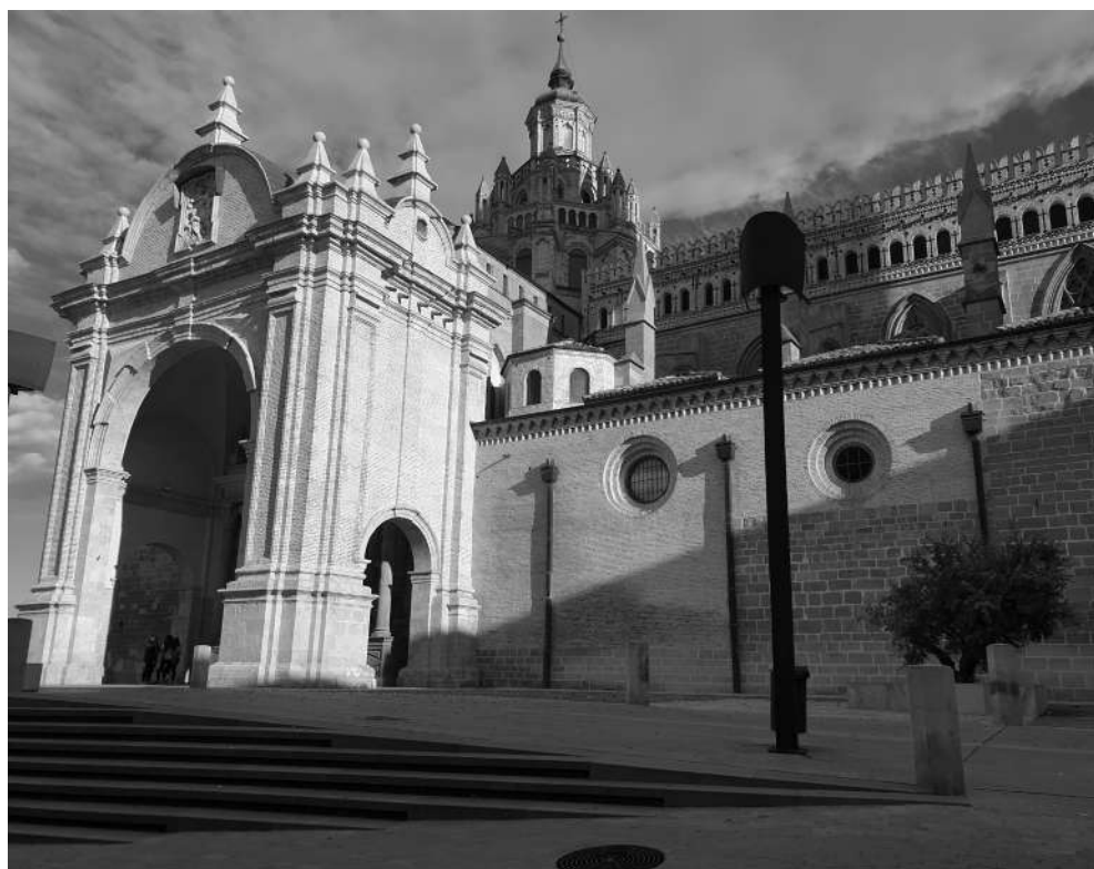
Catedral de Tarazona (2019). GRA

pular y se interpretaron obras suyas por doquier, desde México hasta Santiago de Chile. Las obras de Ripa localizadas en el archivo arzobispal de Lima datan del período 1767-1771.