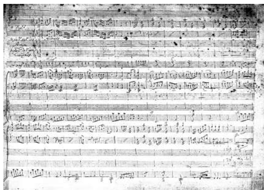
Loa de Antonio Ripa (1765).