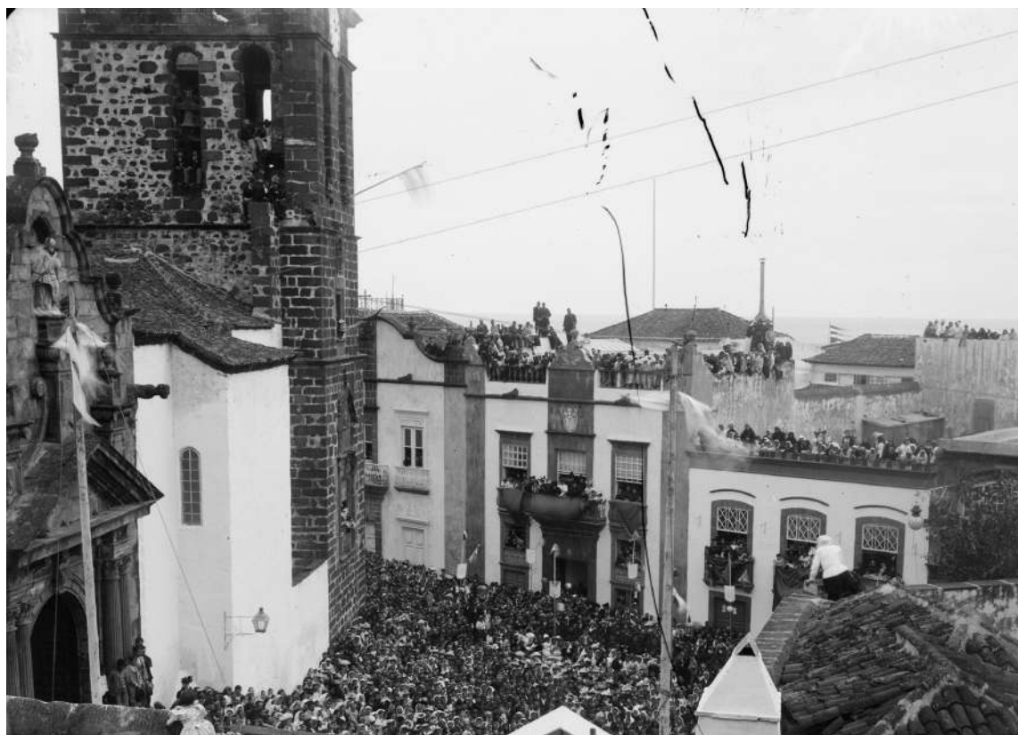
Plaza de España e iglesia de El Salvador durante la interpretación de la Loa de Recibimiento (ca. 1910).

El valor religioso-festivo, social e histórico de la partitura se establece al entender que su contexto es una manifestación que llega hasta nuestros días y forma parte de la cultura insular que con tanta intensidad viven sus habitantes en estas fiestas. Se trata de un patrimonio que se debería conservar e intentar recuperar.