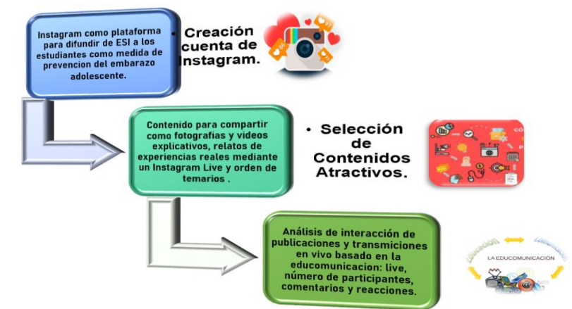
Figura 1: Propuesta: Promoción de Educación Sexual a través de Instagram. Elaboración: Los autores.

Cristina Magaly Zhapa-Bravo; Sergio Constantino Ochoa-Encalada