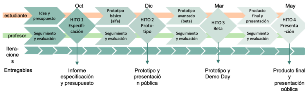
Figura 1. Cronograma.

Respecto al plan de trabajo, se proporciona un calendario completo de las fechas importantes del proyecto al inicio del curso, lo que facilita su planificación y seguimiento (figura 1). La división en hitos (con un hito o punto de control cada 3 meses aproximadamente) e iteraciones (con una duración de 2 semanas cada una) favorece el establecimiento y consecución de objetivos a largo y corto plazo y el desarrollo de un trabajo continuo durante todo el curso. Con la incorporación de la figura de tutora o tutor grupal se ha ganado en confianza del grupo pues ayuda a velar por su buen funcionamiento, resolver conflictos grupales y asesorar en la presentación de resultados del proyecto. Al mismo tiempo, la responsabilidad de tutorizar un grupo contribuye a aumentar la implicación del profesorado en la metodología.