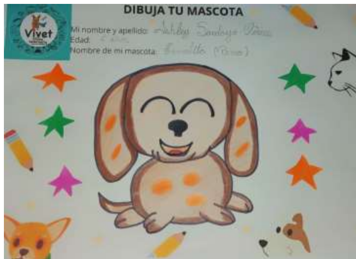
Figura 3: Tamalito