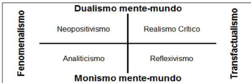
Figura 1. Tipos ideales de metodologías en función de las apuestas filosóficas.