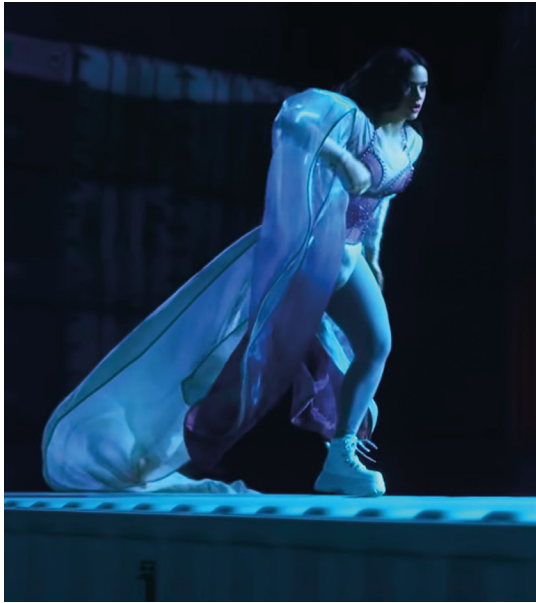
Figura 11. Rosalía en videoclip A Palé.