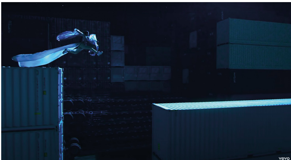
Figura 17. Escenario (C).

En el tercer escenario (C) es donde salta. Se tratan de secuencias más alejadas del espectador; nunca ve a la cámara ya que su mirada está fija en llegar al otro lado del contenedor, no hay tantos movimientos de cámara y los planos amplios, como si se tratara de un momento personal el cual no quiere compartir tan de cerca (Fig. 17).