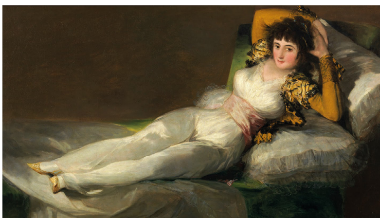
Figura 4. La maja vestida. Fuente: de Goya (1798).

Por otro lado, la Duquesa de Alba no es la única mujer ilustre aludida en el video. La uniceja que conforma el beauty look de Rosalía (Fig. 5) hace una referencia a la pintora mexicana Frida Kahlo (Fig. 6). Esta tampoco es la primera vez que sucede, ya que en la imagen promocional de la canción Que no salga la luna del disco El Mal Querer (Fig. 7), está inspirada en el cuadro de Las dos Fridas (González Freyre, 2019) (Fig. 8).