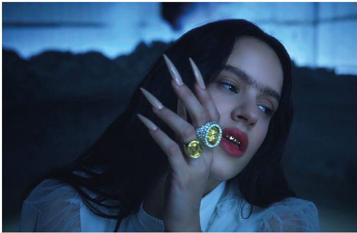
Figura 9. Rosalía en videoclip A Palé.

Como ya mencionamos, en el video Rosalía usa unos chunky shoes , algo que se ha vuelto habitual en ella. Para este audiovisual usó un color blanco de la marca Naked Wolfe (Ojea, 2019). Por otro lado, sus manos siempre aparecen en el video con sus icónicas uñas largas, que a comparación de videos como Aute cuture , no tienen pedrería ni colores y están en un tono nude; sin embargo, usa anillos dorados XXL. El resto de la cara contó con un maquillaje en tonos naturales y mucho volumen, a veces, con labios rojos (Rodríguez, 2019) (Fig. 9).