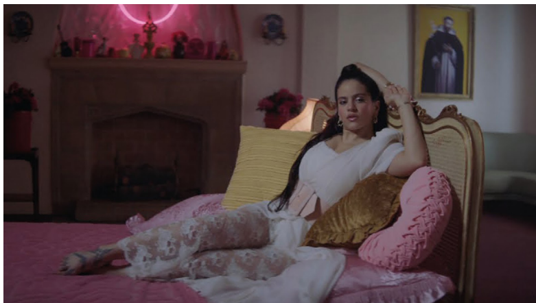
Figura 3. Rosalía en videoclip Di Mi Nombre .