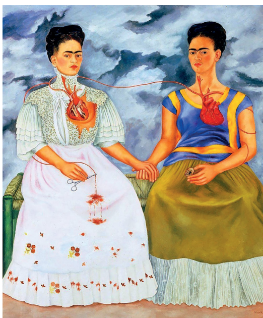
Figura 7. Imagen publicitaria del sencillo Que no salga la luna.