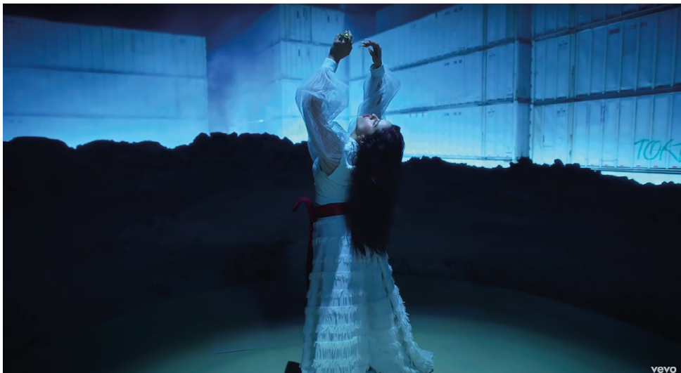
Figura 15. Escenario (A).

En el primer escenario (A), y durante los primeros 30 segundos, la mayoría de los ángulos son en picado o frontal, lo que nos refleja una Rosalía que pone al espectador por encima de ella. En ese tiempo su mirada es elusiva y las secuencias son de entre 4 y 9 segundos. Después del cambio de ritmo, cuando Rosalía aparece en este lugar los planos son frontales e incluso llegan a ser contrapicados lo que refleja una superioridad recién adquirida. Sin embargo, aún esconde la mirada con su pelo, de una forma deliberada cuando baila. Además, es a partir de entonces que se ven pequeños paneos rápidos y secuencias de menos de 4 segundos (Fig. 15).