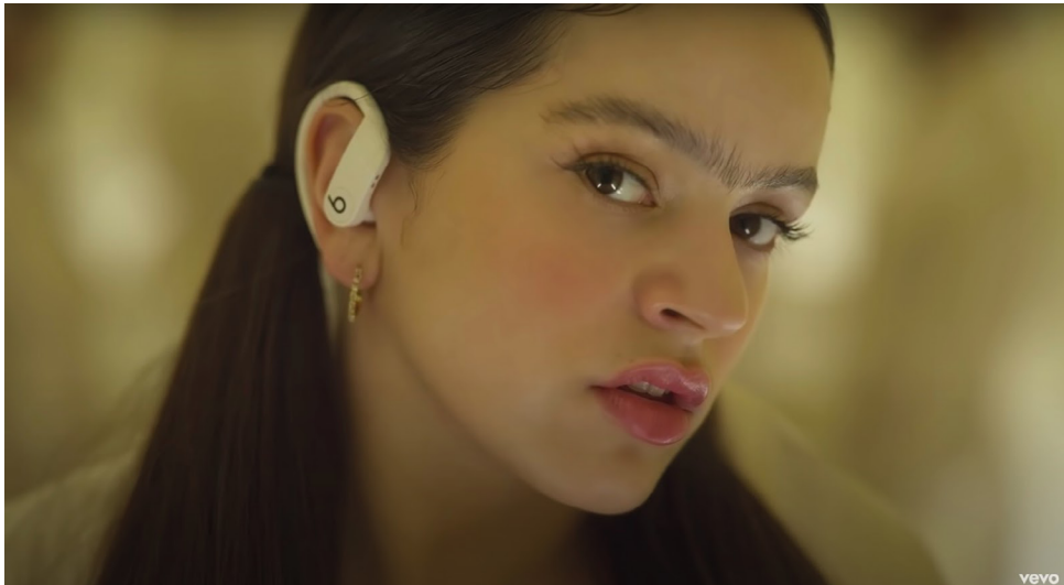
Figura 16. Escenario (B).

El segundo escenario (B) es Rosalía nos muestra un lado más íntimo, ya que por lo general está en primer plano, nunca deja de ver directamente la cámara, la cámara casi no se mueve y ella no baila. Aunque se encuentra sobre la banda industrial como si fuera una caja más (equiparando como un producto industrial) su mirada es desafiante e incluso hace muecas de desprecio (Fig. 16).