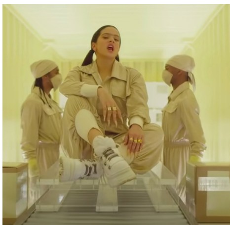
Figura 10. Rosalía en videoclip A Palé.

En cuanto a los tres looks que aparecen en el video, el primero es un boiler suit color blanco (Fig. 10), el cual sigue una tendencia bastante popular en el 2019. Otro de los looks se trata de un body con aplicaciones en color lila, el cual acompañó de una capa de gasa en la misma tonalidad y unas botas blancas de Buffalo (Fig. 11). El último look pensado por Samantha Burkhart (quien ha trabajado con personajes como Lady Gaga) consistió en un conjunto de piel color café, sin una pierna y un body en tono nude con aberturas en la cintura y el esternón (Fig. 12).