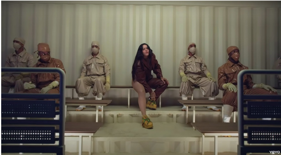
Figura 18. Escenario (D).

A partir de entonces aparece el escenario D, en el cual ella está sentada y la cámara ya no se acerca tanto a su cara, sin embargo, la mirada sigue siendo directa. Los planos son en su mayoría frontales y la pose de ella es un tanto masculina; con las piernas abiertas y los brazos recargados (Fig. 18).