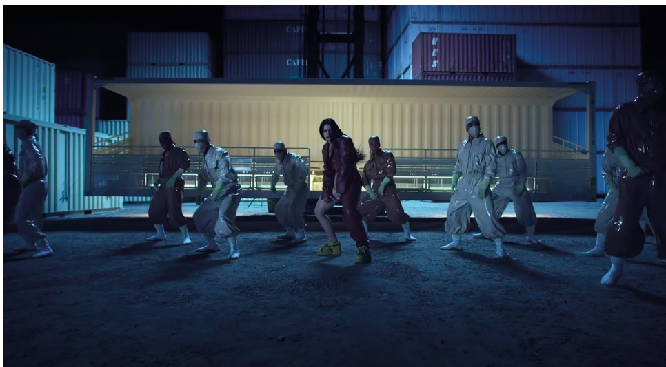
Figura 19. Escenario (D).

Al final, en el último escenario (E) la vemos bailando rodeada de bailarines, los planos se abren todavía más y aunque todavía ve fijamente a la cámara, pero a veces ya no lo hace y sin la necesidad de cubrir su rostro, lo que nos dice que se siente cómoda viendo a la cámara, pero ya no tiene la necesidad de sostener la mirada (Fig. 19).