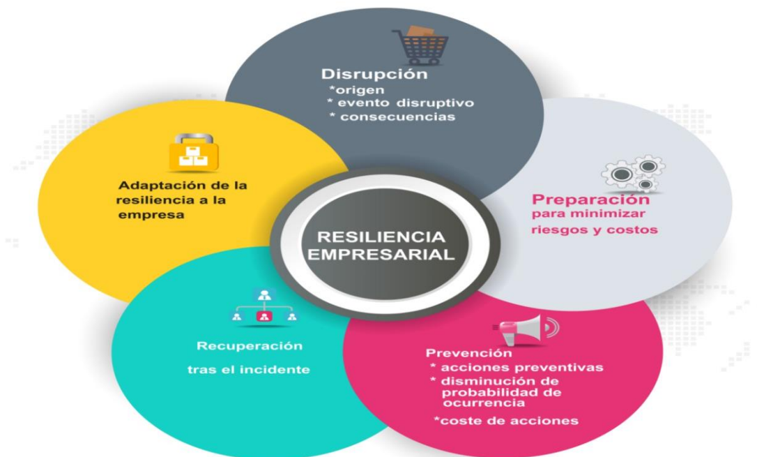
Figura 2. Esquema de propuesta. Elaboración: Los autores.

Esquema de la propuesta para mejorar la resiliencia empresarial en los negocios de la ciudad de cañar, y de esta forma permitir a los administradores crear un ambiente de resiliencia y enfrentar cualquier tipo de cambio o crisis