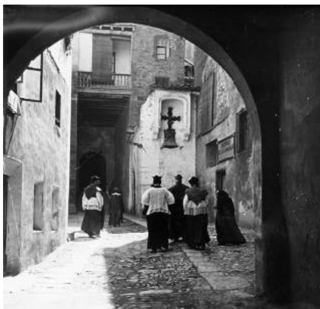
Tortosa 1914. Autor Josep Salvany Blanch (Biblioteca de Catalunya).

El 1860 la comarca comprenia 28.205 pobladors, el 1887 creixia a 28.745 i ho seguirà fent el 1900 amb 31.181 hab. A través del buidatge dels llibres parroquials i del Registre Civil d'alguns municipis, coneixem la periodificació de les crisis de-