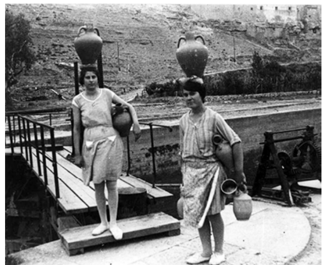
Dones carregant aigua a Flix, 1930.

La singularitat de les prioratines en marxar casades, fa que els seus esposos tinguin oficis relacionats amb l'economia d'origen, com és el conreu de la terra (un pagès del Lloar i un altre del Molar) o la reconversió en la jardineria (un jardiner de Cornudella del Montsant), o bé mantinguin les existents (un propietari i un comerciant també de Cornudella), en altres casos la integració es fa com a simple jornalier (de Cornudella, del Mas-roig i de