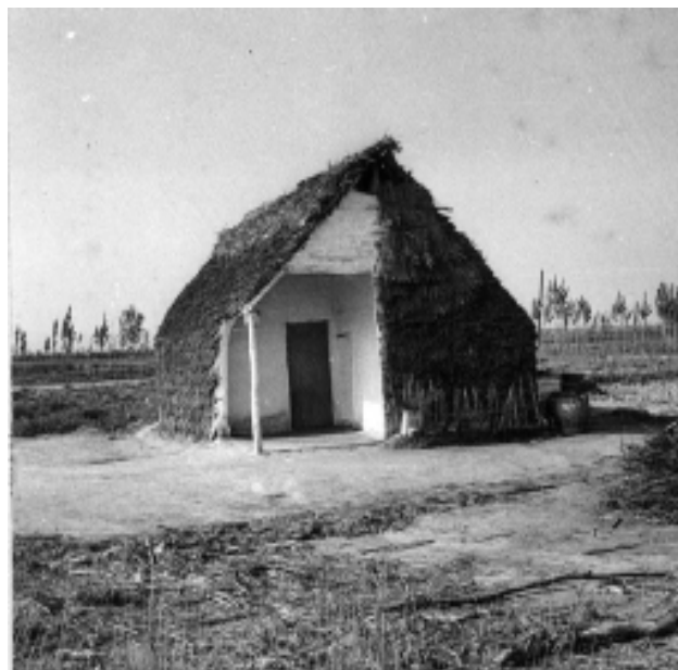
Barraca a la Cava, 1936.

más indispensables a varias familias. Lo peor, es que la situación no tiene trazas de mejorar, pues los fríos de abril último abrasaron los viñedos, y se ha perdido también la cosecha de almendra" ( El correo de la Provincia , Tarragona, 21 de maig de 1892). Les inclemències climatològiques també són abundants: sobre les conseqüències de l'aiguat de Santa Tecla del 23 de setembre de 1873 al Priorat s'escriu: "En Cornudella [del Montsant] se inundó la población, desplomándose por completo una casa y la mitad de otra. Del molino del puente ha caído la mitad, pereciendo ahogado un rebaño entero (...). En la Vilella Baja, se desplomaron por el temporal catorce casas, muriendo ahogado un vecino de la población. En Porrera no han quedado árboles ni vides en los campos inmediatos a los barrancos. El río se ha llevado un molino de aceite, parte de una casa e innumerables muros. Las casas próximas a su ribera han sido arrastradas por las aguas"(...). Noticias de Scala-Dei dicen que aquellos campos han sufrido grandes perjuicios (...). En las riberas del Ebro no ha quedado ningún molino harinero, ni de aceite. En Móra la Nueva han sido derribadas dos casas, una por una exhalación y la otra por el aguacero", (...). En Ginestá, el barranco de San Isidro invadió una casa, ahogando a un anciano, su hijo y una nieta. De otras casas se llevó cuatro lagares de aceite y trescientos carneros", ( DT , 26 de setembre de 1874). 17