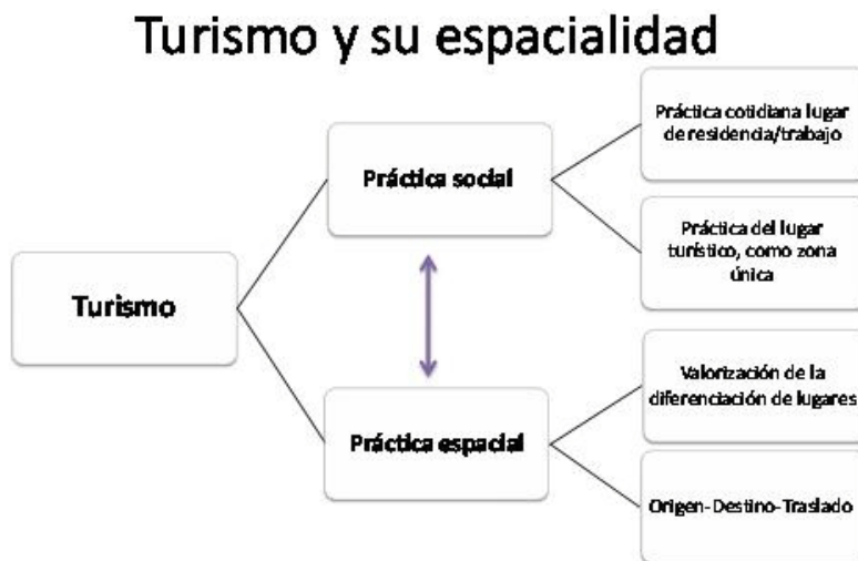
FIG. 2. TURISMO Y SU ESPACIALIDAD