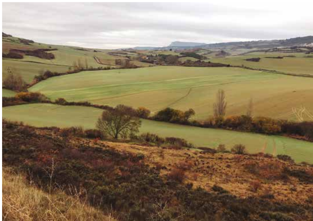
Figura 2. Campos próximos al río Ubagua.

Otra posibilidad de interés es el estudio del contexto del castillo de Oro, a escasos cinco kilómetros, como hipotético bastión refugio en esa batalla. No debemos olvidar que las tenencias eran distritos que abarcaban una amplia extensión, por lo que no se puede descartar el castillo de Oro como parte de la tenencia de Muez y que las fuentes lo mencionaran como tal siendo en realidad el situado en la Peña Grande o castillo de Oro.