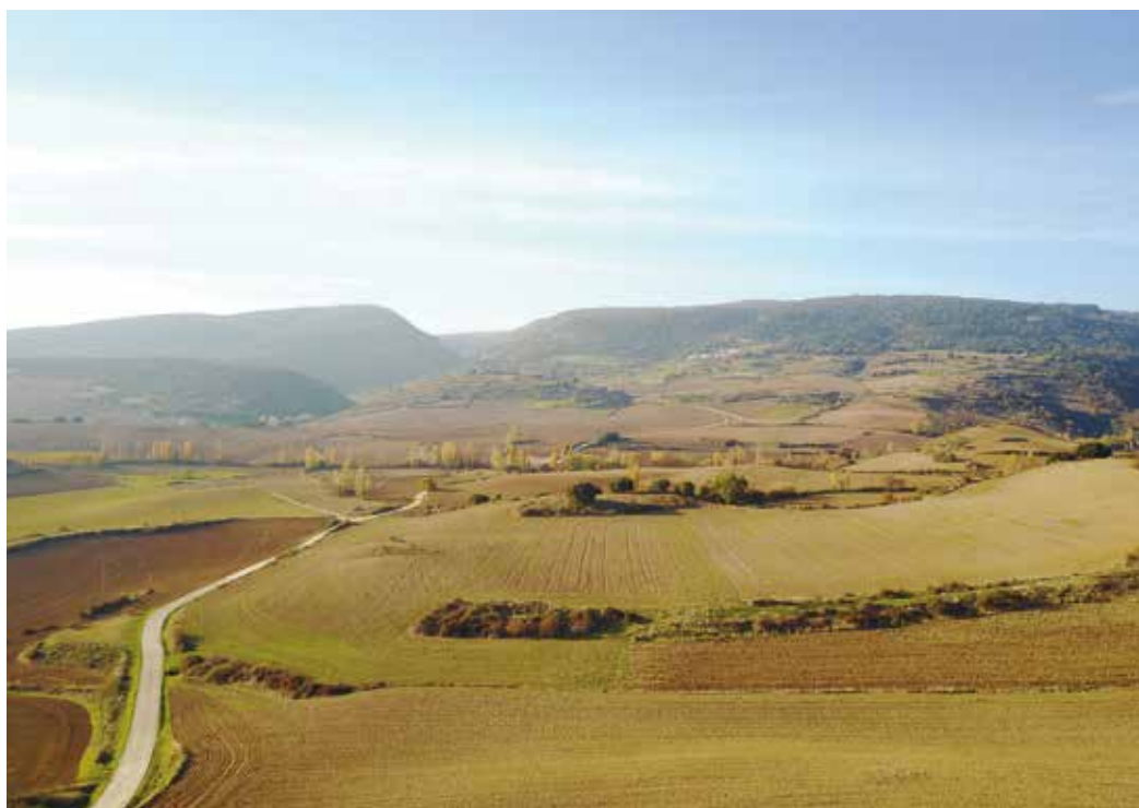
Figura 1. Toma aérea de la zona de estudio.