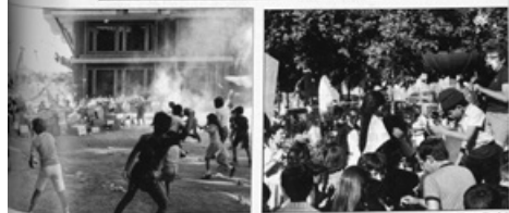
El infants esperen dalerous l'arribada de la Fiestu del Canigó i l'encesa dels tradicionals fets de Sant Joan. Mentre els petards no paraven d'explotar.