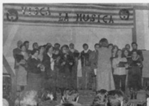
Un any més s'ha celebrat la festivitat de Santa Cecília on es citaren les Entitats Musicals de la Vila.

Quinzenal informatiu local i comarcal Any I III Aposta Número 5 Bellpug, 1 de Desembre del 1979 Preu: 30 Ptas.