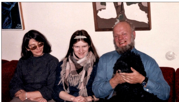
Juozas Aputis con su mujer Virginija y su hija Vijolė en su casa de Vilna, 1985

Juozas Aputis (1936-2010) es una de las voces más destacadas de la prosa lituana del siglo xx y uno de los escritores que más ha contribuido a modernizarla desarrollando el género del relato.