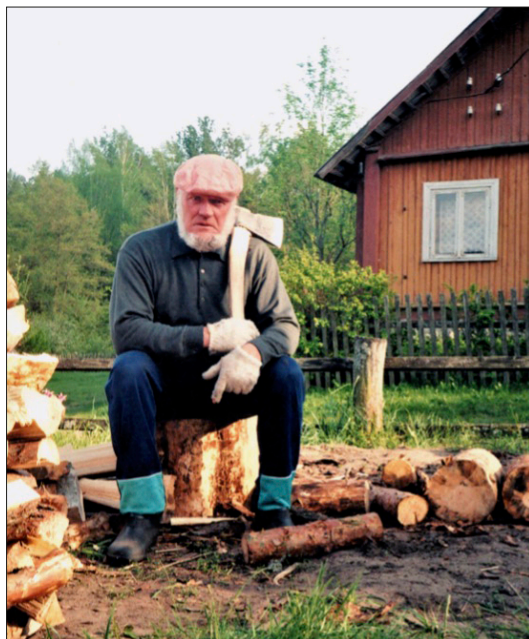
El autor junto a su casa de Zervynos

En la pluma de J. Aputis cobran vida múltiples personajes que configuran el microcosmos del relato, integrado no únicamente por personas, sino también por animales, árboles, plantas... En la visión y expresión del autor, los animales parecen realizar acciones humanas, las cosas también adquieren características de seres animados. El reconocido crítico literario Albertas Zalatorius (1988, 176-189) destaca que J. Aputis simplemente ni podía ni sabía escribir de forma superficial y que —dominando la palabra y concediendo suma importancia al aspecto estético— no pretendía solo recrearse en el lenguaje, sino emplearlo para expresar algo esencial. Añade que en la obra de Aputis se da particular importancia a la memoria, la reflexión sobre las propias acciones, la conciencia; sus textos enfrentan al lector con la necesidad de desprenderse de la carga de un yo artificial, de las propias caretas. Ayuda así el autor a alcanzar una comprensión del mundo no contaminada por las opiniones colectivas ni por todo lo que no eres tú mismo. Al leer los relatos de J. Aputis, el autor con su entonación íntima, su envidiable capacidad de observación y su tolerante