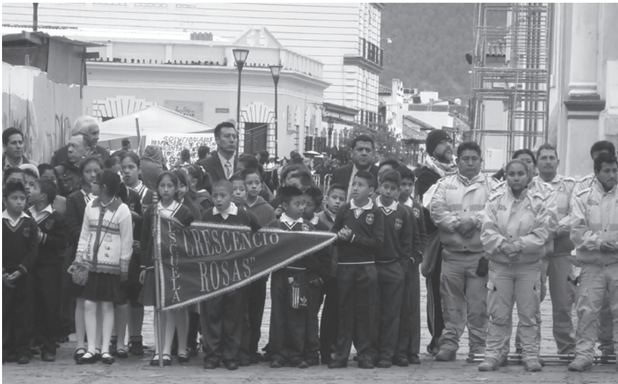
Fotografía 1. Celebración del 5 de Febrero, 2016.

En una fría mañana del 5 de febrero último, en la plaza central de San Cristóbal de las Casas frente al Palacio Municipal en construcción, se reunieron autoridades del Estado y la Ciudad acompañados de escolares, una banda militar y personal de servicios ciudadanos. La reunión tenía como objetivo festejar los 99 años de la actual Constitución Mexicana (1917), una de las grandes efemérides que se celebran en la actualidad en ese país (véase Fotografía 1). Más allá de los periodistas, unos turistas y unos pocos habitantes de la ciudad, la celebración no era tan concurrida como se podía esperar. Los discursos estaban dirigidos a rescatar la esencia de la nación mexicana en general, pero también el tema de la integración de todos los “mexicanos”, es decir, la formación de la nación mexicana. Un discurso muy significativo pues en ese mismo momento, a unos metros del festejo, la plaza frente a la Catedral de San Cristóbal de las Casas estaba ocupada por representantes indígenas y campesinos del Estado que protestaban por las condiciones económicas y la poca atención a sus necesidades por parte de las autoridades. Un símbolo de las contradicciones que atraviesan a todos los habitantes del Estado desde el punto de vista étnico y social.