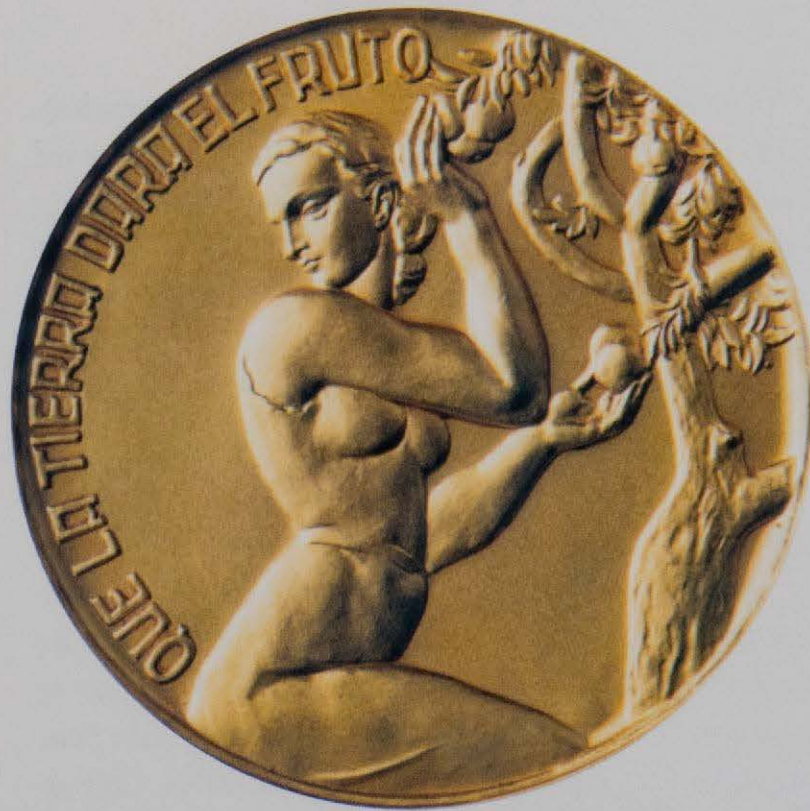
Medalla oficial de la vila Nules. E. Giner.