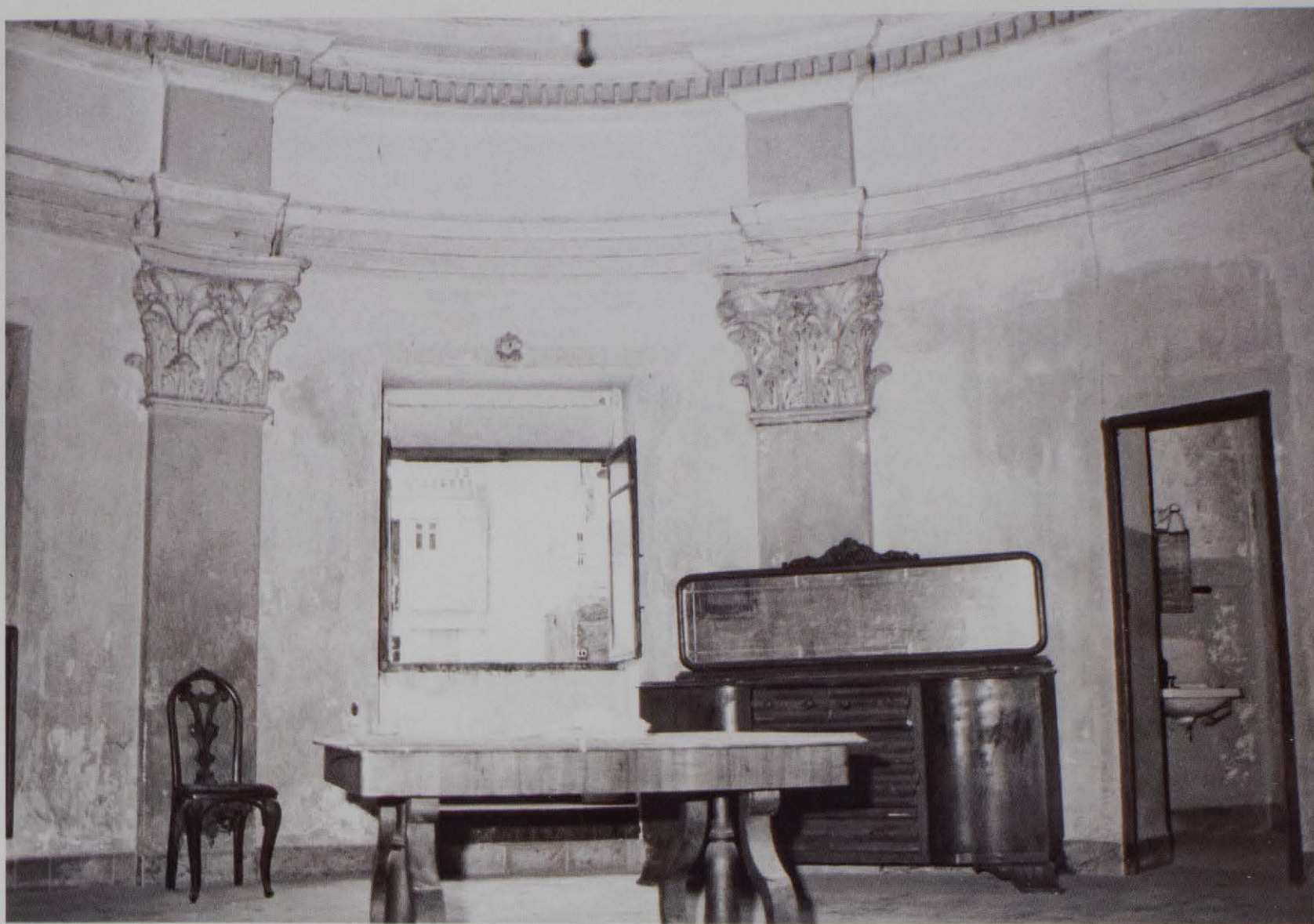
Després l'abolició dels senyorins, el Fort va passar a mans privades que el van adaptar com a vivenda i fleca.