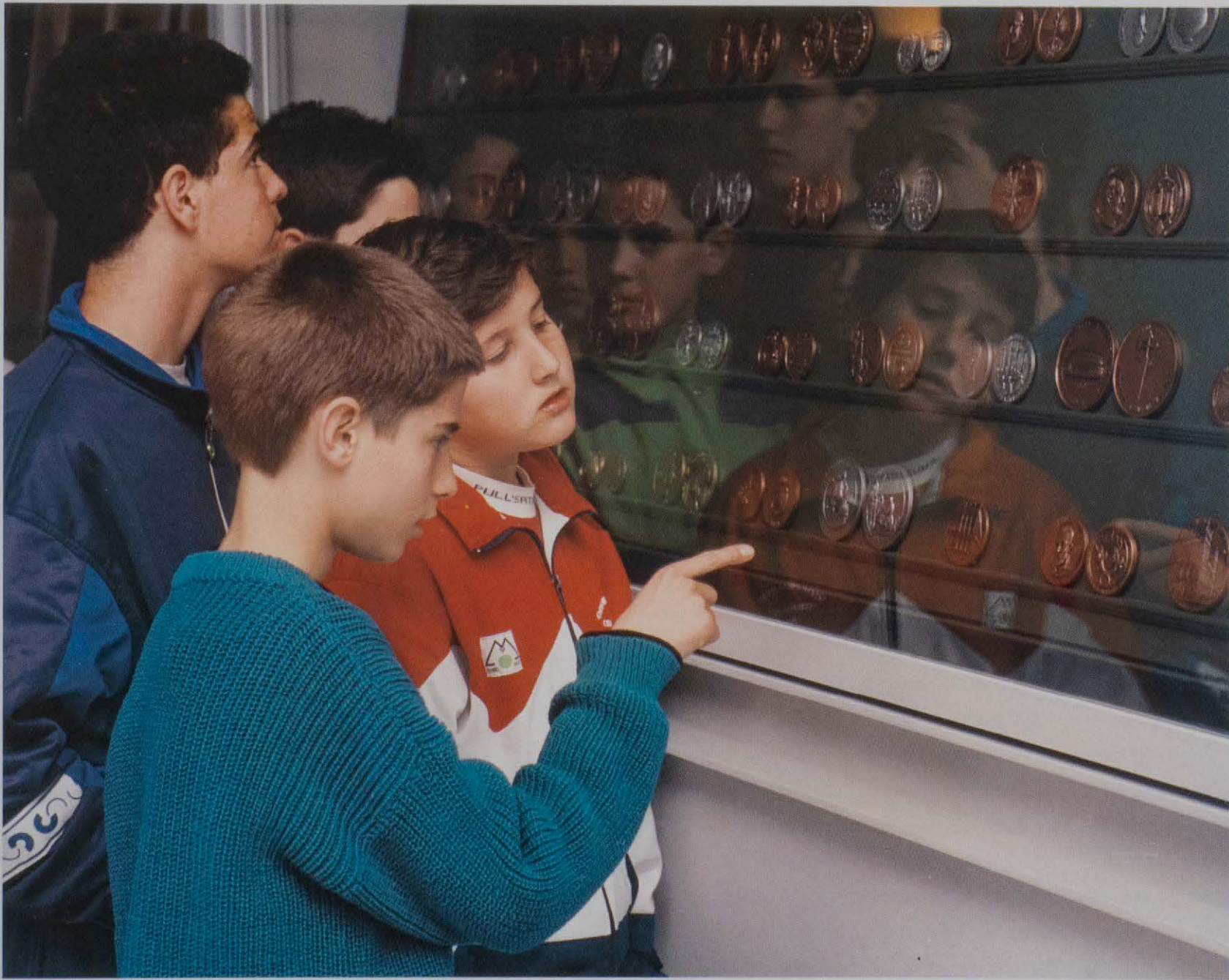
Les visites d'escolars són freqüents al Museu de Medallística.