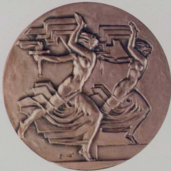
Medalla de la Victoria. E. Giner.