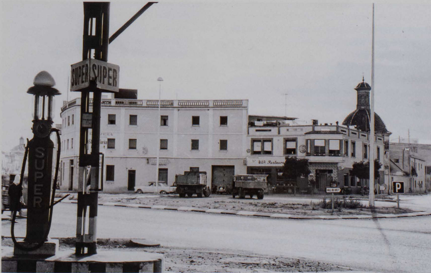
Malgrat el pas de guerres, sobretot la civil de 1936, en la qual més de dos terços de la població van quedar arrasats, el Fort es va mantindre en peu.