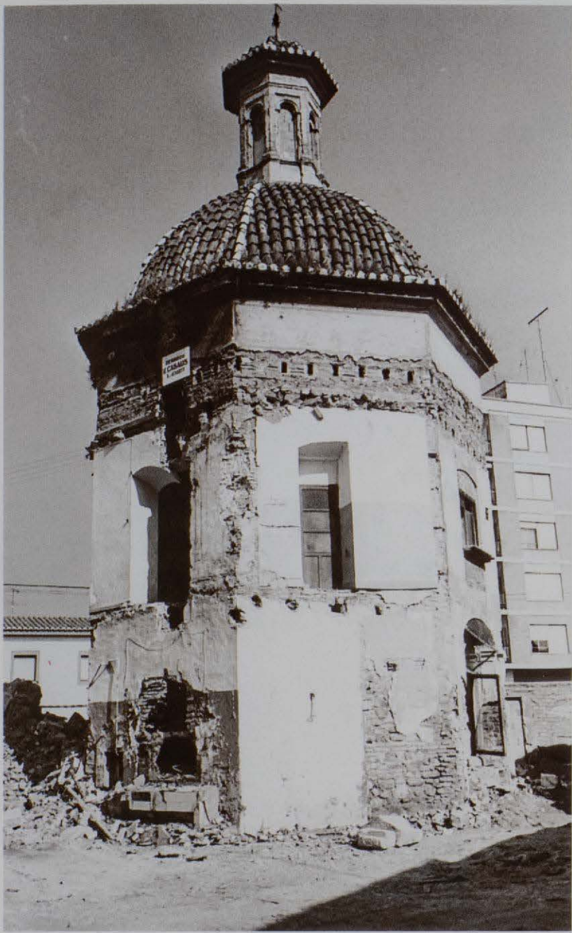
L'enderrocament de les construccions adosades, va deixar a vistes la capella central de l'esmita, es poden veure les "llagues" del forjat que ens marquen l'altura i inclinació de la teulada de les dependències desaparegudes.

El 7 de maig de 1982, a instàncies de l'actual Cronista de la Vila, la Comissió Provincial de Patrimoni va revocar la dita llicència d'enderrocament i va iniciar els tràmits per a la protecció de l'ermita de Sant Miquel "el Fort".