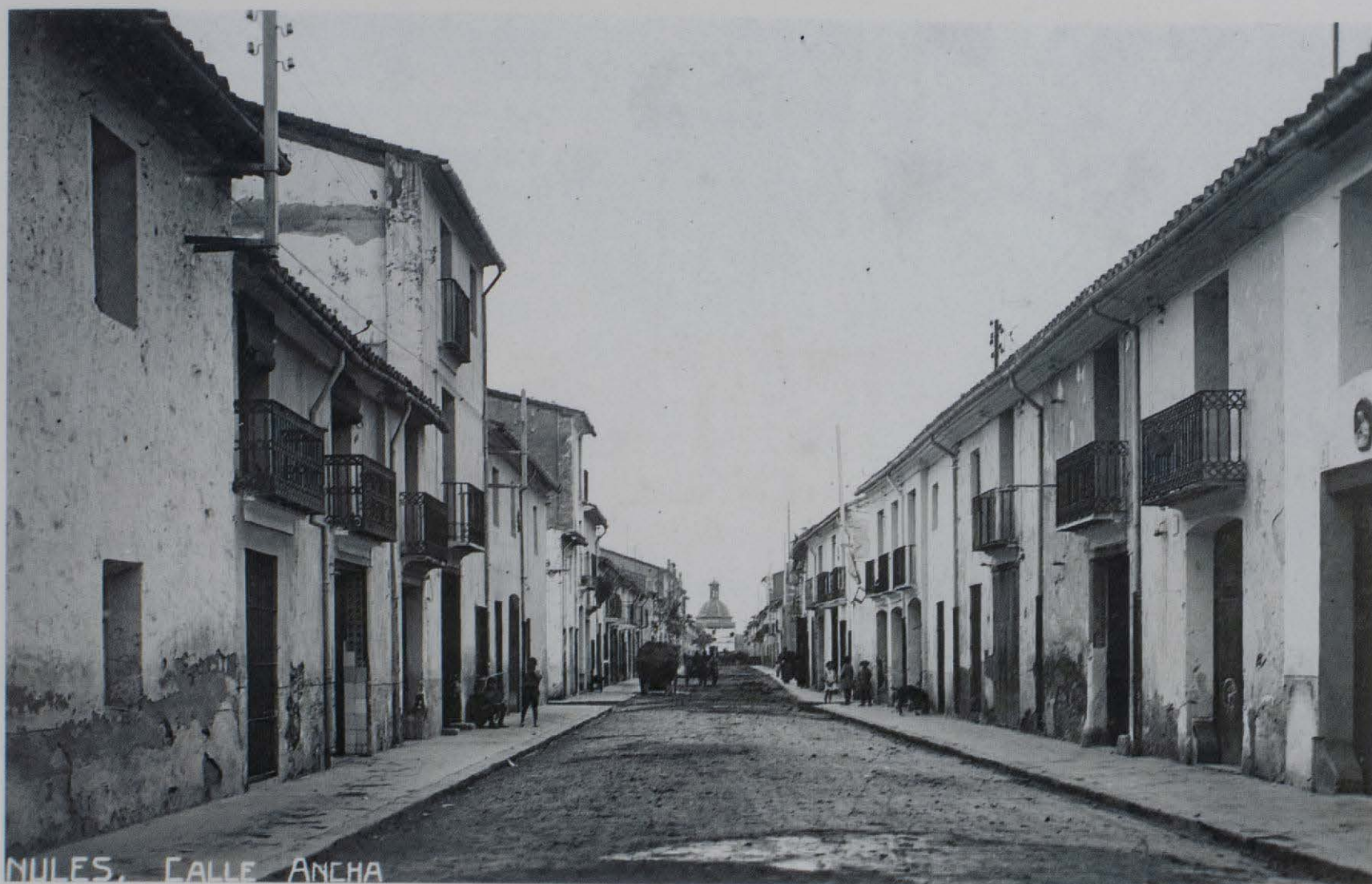
La imatge del Fort sempre ha marcat el paisatge urbà del Raval de Vila-real, de Nules.

Vicent Granell, "per lo moltíssim que la vila li deu", qui fugia de la ciutat de València. El dia 1 de novembre del mateix any ens consta que es van acollir algunes persones "de molta correspondència", que havien aplegat de València fugint del mal contagiós, però sense que pogueren entrar a la vila, i el 25 de novembre del mateix any el Consell acollia a l'ermita el Governador General del Marquesat (7).