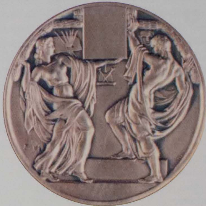
Medalla per a premi de l'escola de BB.AA. de Sant Carles, de Valencia. E. Giner.