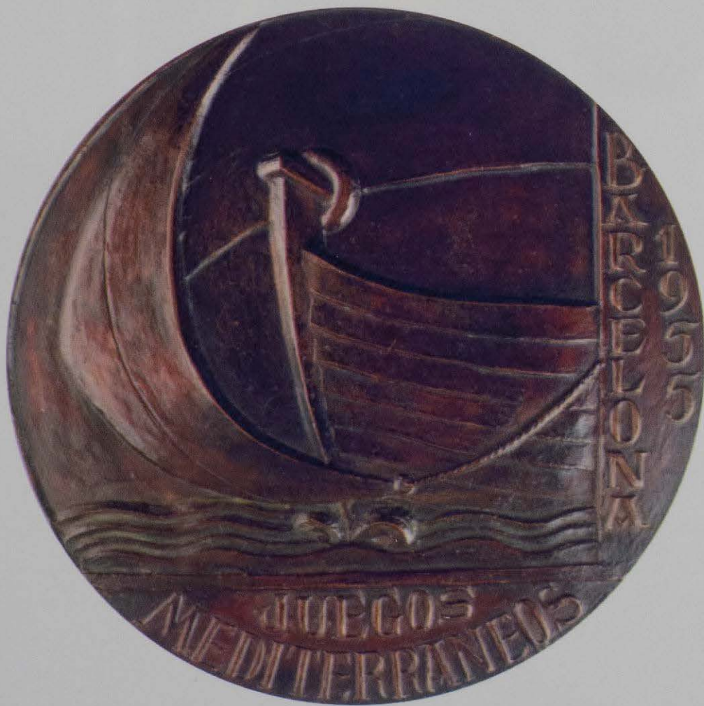
Plaqueta model per a la medalla dels focs de la Mediterrània, a Barcelona. E. Giner. 1955.

17.- Al llibres de comptabilitat de la casa del Marqués de Nules, conservats a l'Arxiu de la Diputació de València, podem trobar els asentaments en què consta que per als Marquesos de Nules treballaren arquitectes