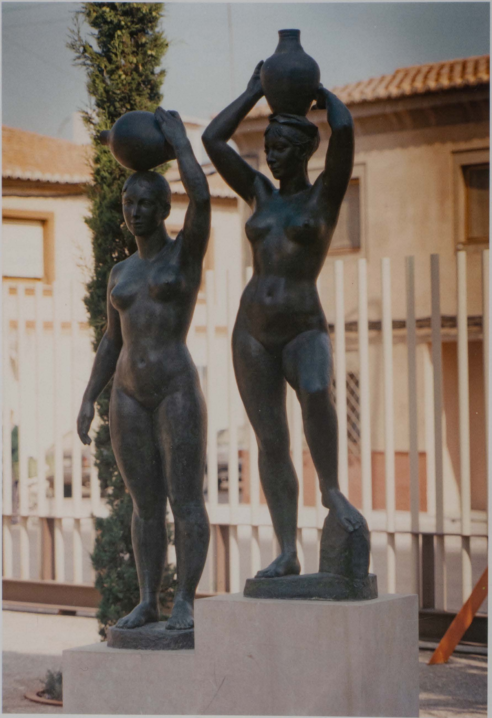
Museu de Medallística "Enric Giner". Grup escultòric de "Aguadoras" de Octavio Vicent, amb el qual va guanyar la medalla nacional d'escultura, l'any 1948.