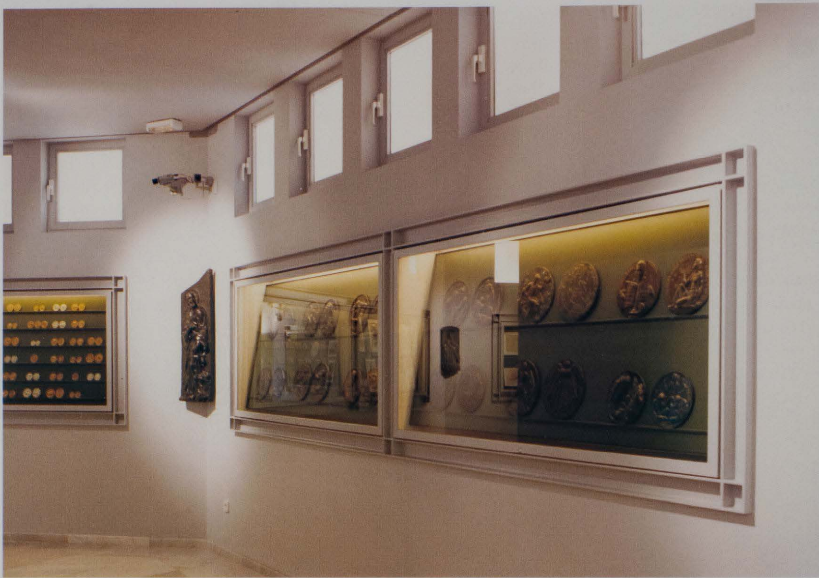
Vista general de la zona de la colecció permanent de medalles.

que ens dóna idea de l'aspecte exterior de l'antiga construcció, per la seua discreció i funcionalitat podem considerar modèlica. D'altra banda, el projecte ha estat completament respectuós amb els elements originals que estaven danyats, els quals s'han recuperat a la manera de l'època en què es va bastir l'ermita, com és el cas dels estucs i dels esgrafiats.