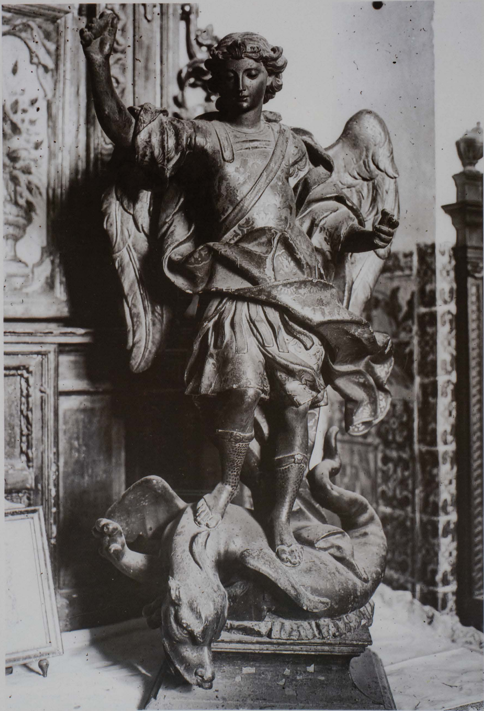
Imatge de Sant Miquel (1756-57). Talla que presidia el retaule de l'ermita, iniciat per Francesc Vergara i rematat pel seu fill Ignasi. Destruïda al mes de juliol de 1936.