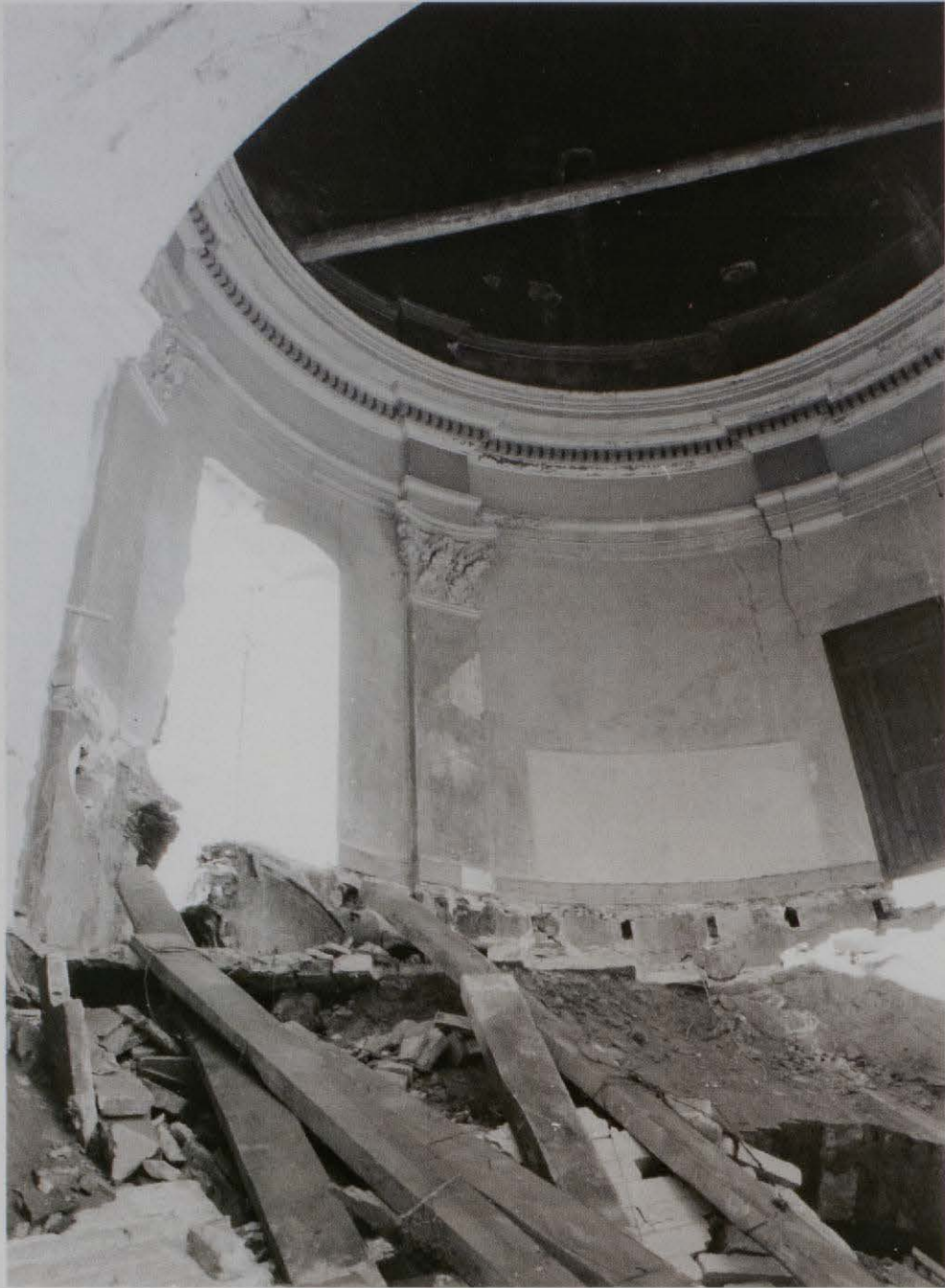
Detall de l'interior de la capella un cop trets tots els afegits. Pot comprovar-se la bona conservació de l'entaulament i pilastres originals