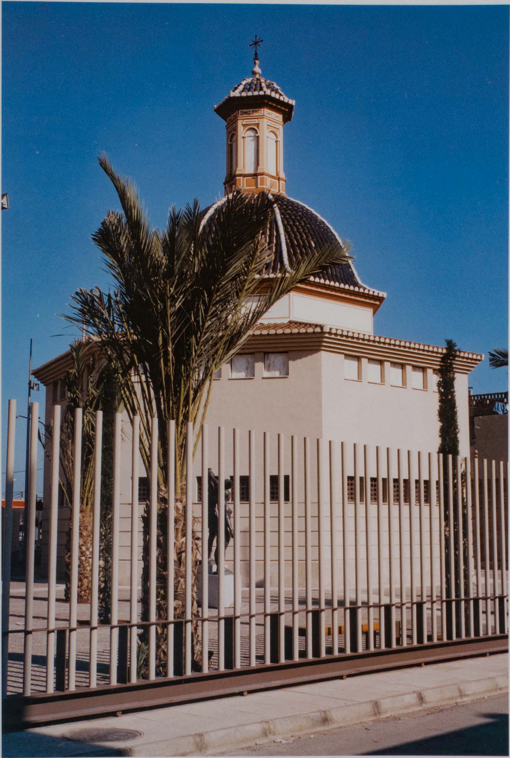
Vista general del Fort després de la seua restauració.