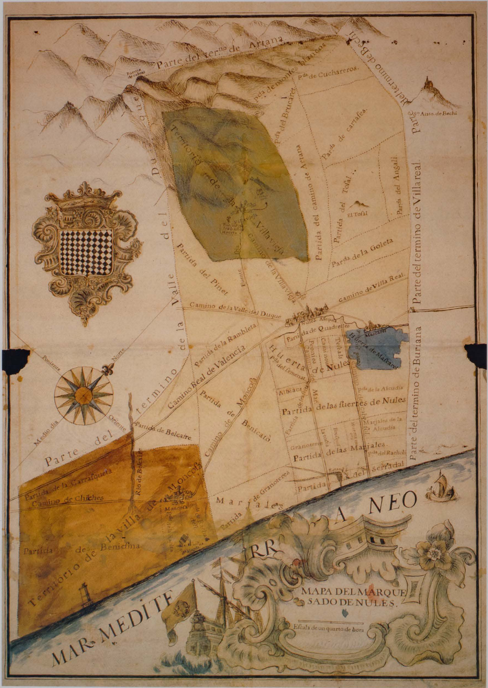
Plànol del marquesat de Nules (2 a meitat S. XVIII). A la part esquerra del ideograma que representa la vila de Nules, pot veure's la silueta de l'ermita de Sant Miquel.