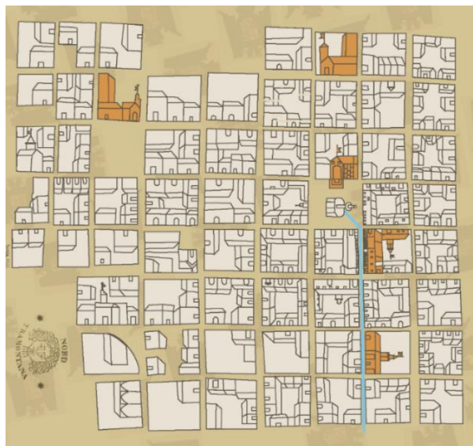
Imagen 1: Plano de Tunja de 1623 con las sedes hospitalarias 29 .

Todo inició en 1773, cuando las autoridades de la ciudad alertaron a la Superior Junta de Temporalidades sobre el desplome de una de las naves de la iglesia de los expulsados Jesuitas y el deterioro general por humedad de los bienes del templo de Jesús 30 . En mayo de 1775, el cura mayor de la parroquia de Santiago, en cuyo vecindario se encontraba el antiguo colegio e iglesia, y el cabildo, se dirigen al virrey y a la Junta de Temporalidades para informar, en primer lugar, de los rendimientos de cofradías y cultos de la antigua iglesia y proponer que puedan aplicarse «para Hospital de pobres enfermos porque el que hay es muy reducido, húmedo y de estructura débil y deleznable, mayormente bañado por las aguas que corren por la ciudad, los cimientos de sus paredes, que son de tierra y hállase desplomada la iglesia» 31 .