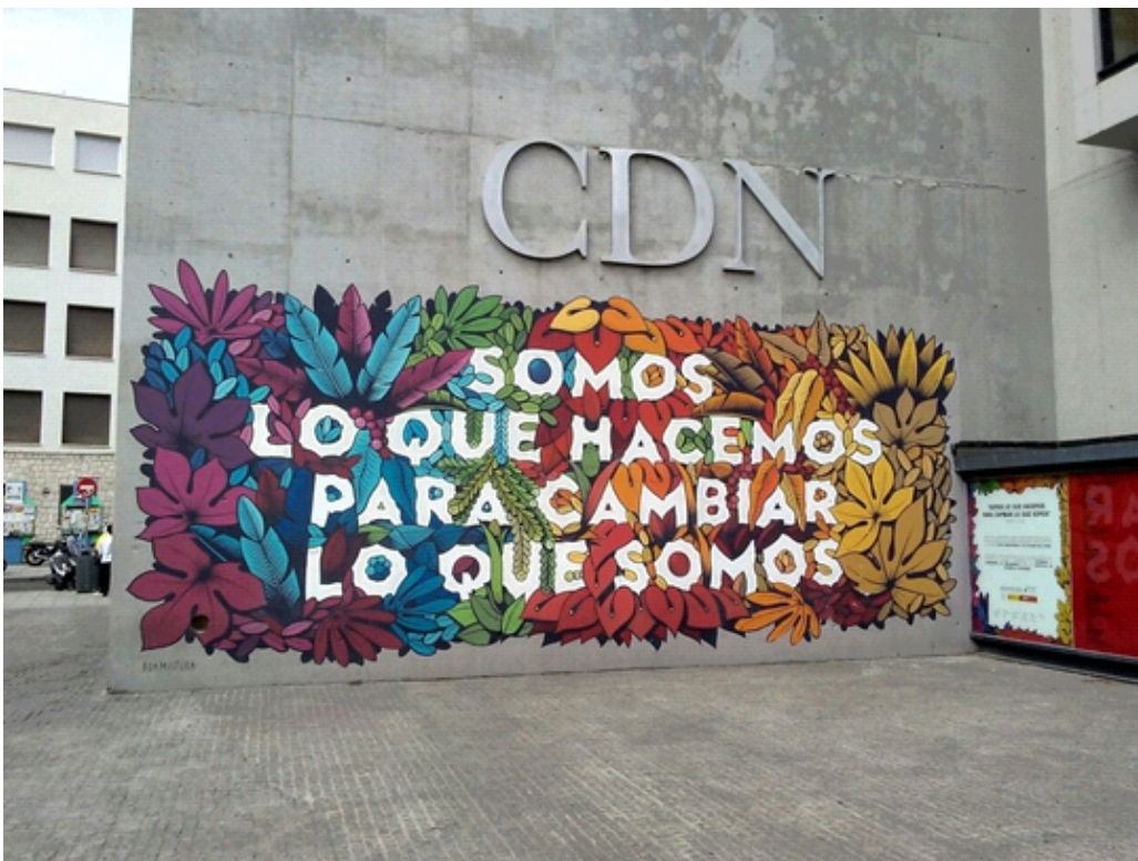
Figura 1. Boa Mistura, Centro Dramático Nacional (2018-2020) [fotografía].