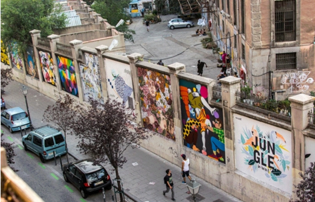
Figura 2. Vista de los muros exteriores del Centro Social Autogestionado La Tabacalera, C/ Miguel Servet, Madrid [fotografía].