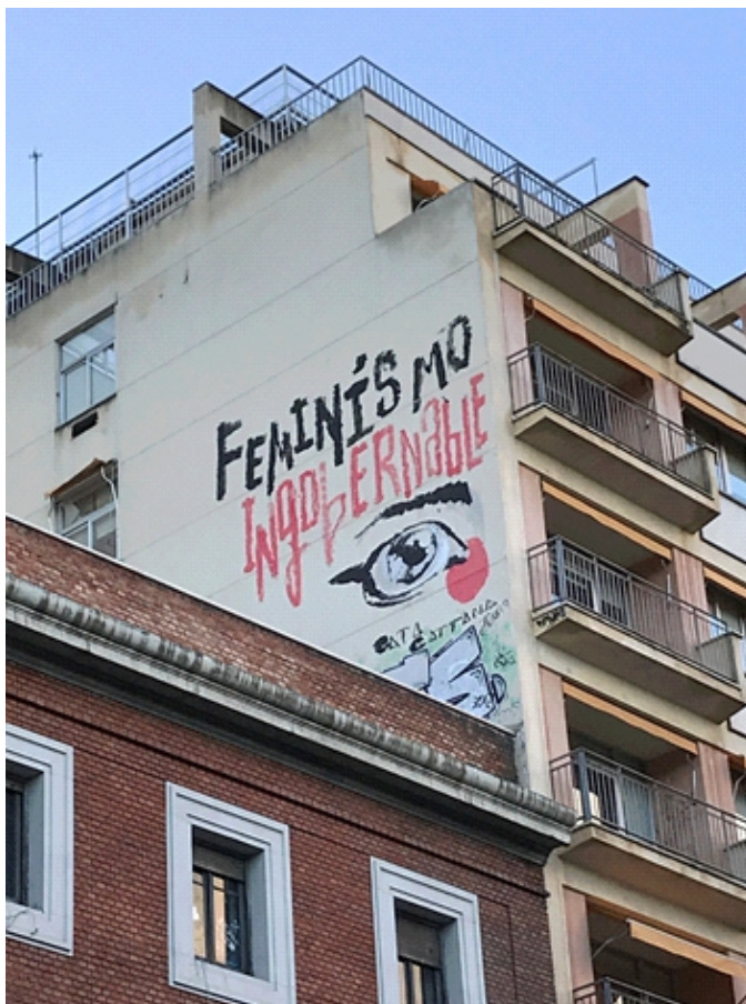
Figura 3. Vista desde el Paseo del Prado del mural sobre la pared colindante al antiguo Centro Social Okupado Autogestionado "la Ingobernable" [fotografía].

En este sentido, la artista y teórica Martha Rosler señala al artista como un agente contradictorio, ya que a la vez que actúa como potenciador del problema, también activa el problema para su crítica (Rosler, 2001). Señala y, a la vez, atrae y estetiza. Por ello es muy necesario que ese artista tome conciencia de su lugar como efecto, un lugar que a su vez es igual de contradictorio en términos de acumulación de capital simbólico. Aunque los discursos que presentan los diferentes artistas sean abiertamente críticos, estos acaban en el absurdo si se obvian los marcos sociales y económicos que se mantienen en las ciudades, quedándose tan solo en un 'embellecimiento urbano'.