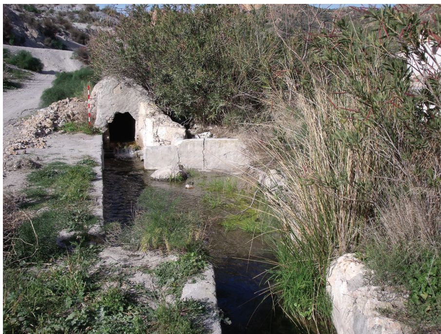
Figura 3. Bocamina, abrevadero y lavadero del Caño de Béjar

2 de enero de 2013.