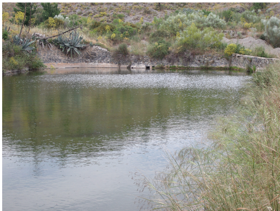
Figura 8. Balsa que recoge las aguas alumbradas por el sistema de Los Cotes-Cegarras

Fotografía de Gómez-Espín, 5 de abril de 2009.