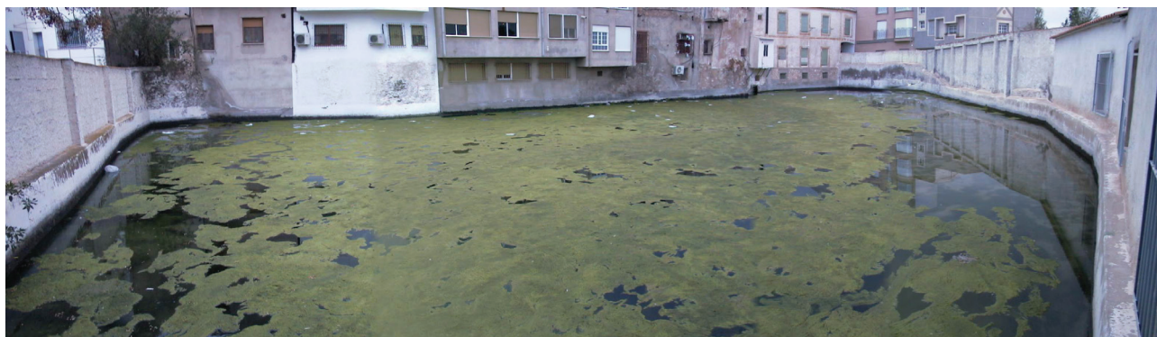
16 de enero de 2005.

La técnica del pozo horizontal cubierto estaba extendida en un territorio seco como el Sureste donde se disputaban la propiedad y uso de las aguas. En los inicios del siglo XXI existían todavía en activo un gran número de cimbras en el río-rambla Almanzora. En octubre de 2001 la Junta Central de Usuarios de Aguas del Valle del Almanzora (JCUAVA) reflejaba entre los recursos propios la captación de agua por 9 pozos, 2 cimbras y 8 fuentes en el Alto Almanzora; por 12 pozos, 7 cimbras y 8 fuentes en el Medio Almanzora, y por 4 cimbras, 75 pozos y una desaladora en el Bajo Almanzora. Las fuentes eran puntos de emisión de agua captada a través de minados y de qanat . Las cimbras eran una forma de alumbrar agua en los lechos del Almanzora y de su red de afluentes 8 .