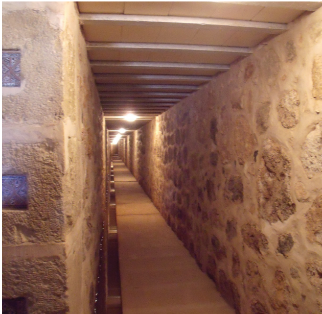
Figura 13. Rehabilitación del qanat de Casa Herrera (Jumilla)

10 de enero de 2012.