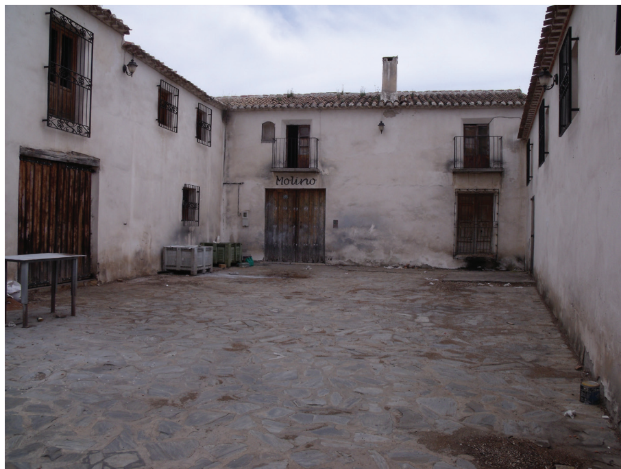
5 de abril de 2009.

convertía en presa subálvea con galería inscrita al atravesar la rambla de La Murta, continuaba como galería hacia Balsapintada con construcciones como el Canal del Sifón, al paso del ramblizo del Correo 31 .