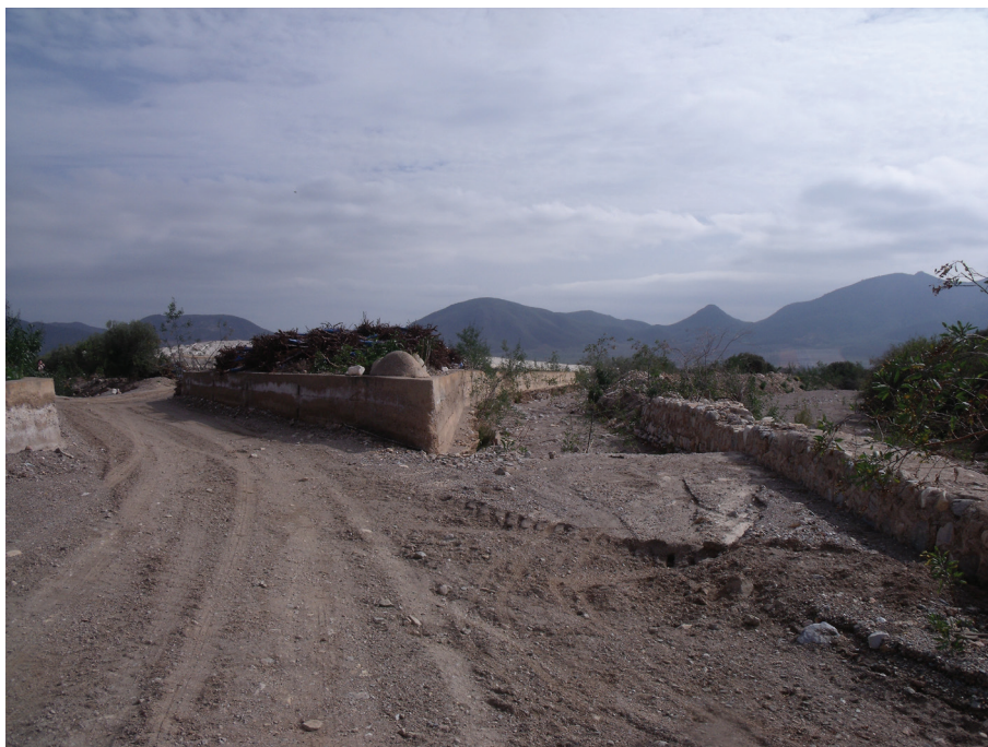
9 de febrero de 2020.