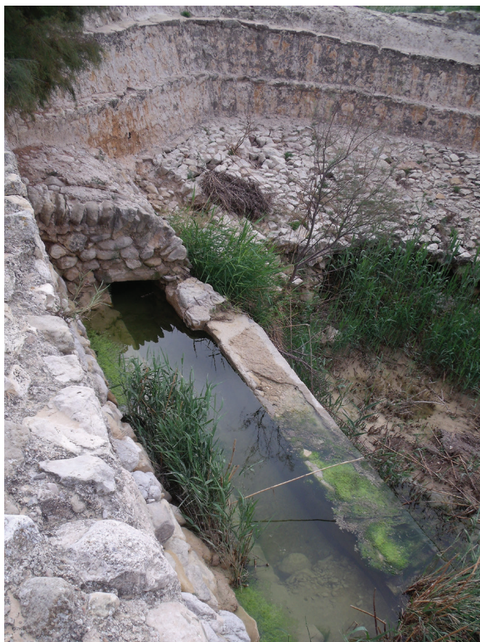
Fotografía de Gómez-Espín, 21 de noviembre de 2015.