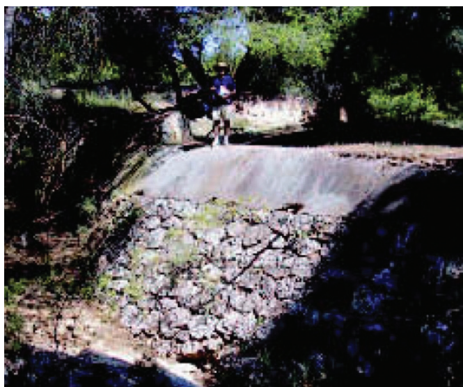
Figura 11. Galería inscrita en presa subálvea, al paso del qanat por la rambla de Las Tobarrillas en Yecla