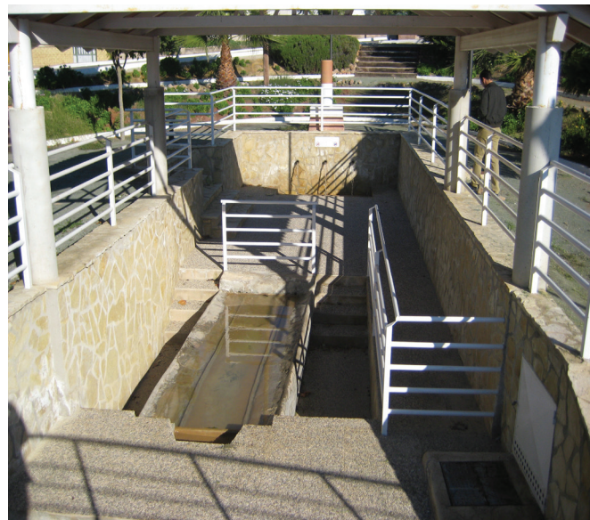
Figura 12. Fuente de Los Caños y lavadero de Góñar

24 de octubre de 2007.