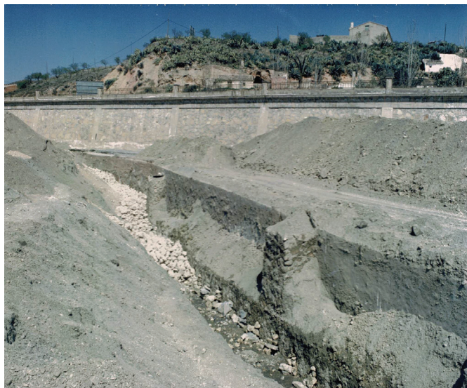
Figura 10. Limpieza del Contracaño en la rambla de Nogalte. Modelo de galería drenante antepuesta a presa subálvea