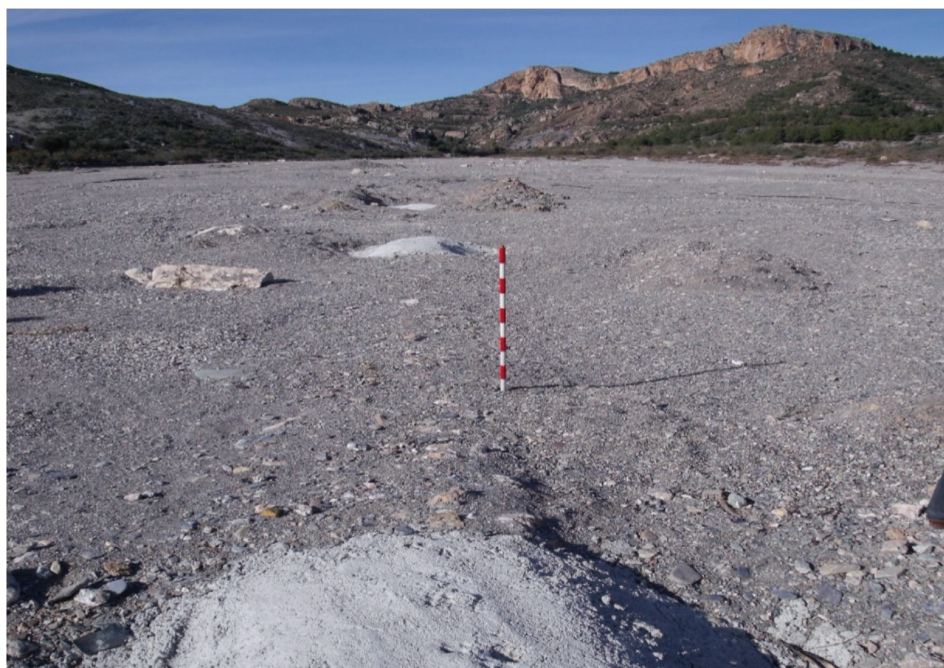
Fotografía de Gómez-Espín, 2 de enero de 2013.

sito detrítico que es el cauce de la rambla. Para su construcción se abrió una gran zanja o tajea en los depósitos del cauce de unos 15 metros de anchura por unos 120 metros de largo; en forma de arco transversal (diagonal). Con una profundidad de más de 8 metros, hasta llegar al impermeable de base, un conglomerado que los más ancianos decían “era el firme de los montes que se unían bajo el lecho de la rambla”. La presa es de forma trapezoidal, con una base de 4 metros y la cúspide de 1 metro, realizada en piedra y cal hidráulica.