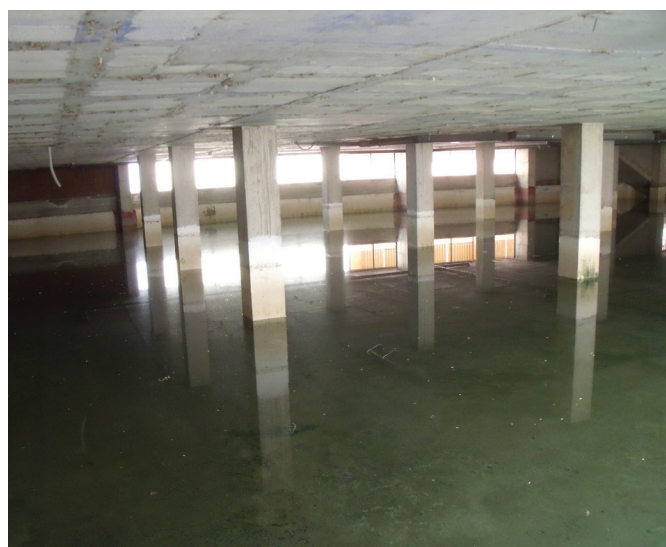
Fotografía de Gómez Espín, 21 de diciembre de 2007.