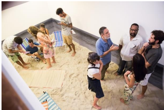
Figura 5. Banco de los IReales 7.

Al comienzo de la actividad: una mezcla de sorpresa, cierta molestia y desconfianza por la incógnita que cuestiona la seriedad de tal propuesta. Algunos cuchichean: ¿será posible? Se retoma algunas veces la pregunta en cuestión: ¿cómo vivir (bien) en el capitalismo sin dinero? Junto a educadores/as del MAR, investigamos el valor de las cosas, las formas alternativas de trueque y las colectividades/colaboraciones en la contemporaneidad. Acto seguido nos presentaron la obra: Banco de los IReales : "El Banco de Tiempo es una herramienta de desarrollo de trueques sociales que permiten una nueva forma de relacionarse, entre los miembros de una comunidad". El Banco de los IReales estaba localizado en el primer piso del Pabellón de Exposiciones. De entrada, evidenciaba un extrañamiento similar al ocasionado por la pregunta de la propuesta. El banco tenía ambiente de playa, arena en el suelo, un gran reloj de arena, sillas de playa, un gerente, una tablet para realizar el registro de los nuevos usuarios; y una condición: quitarse los zapatos para ingresar al banco. En la tableta, se podían evidenciar registros y experiencias de otros usuarios del banco, tanto de esa filial como, de otras alrededor del mundo. También, era posible ver algunos anuncios de trueques, ofertas y demandas de servicios colaborativos.