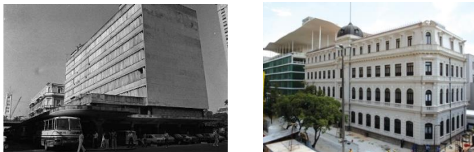
Figura 1. Marcas del tiempo