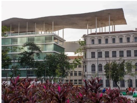
Figura 3. Museu de Arte do Rio

del MAR (figura 2), la cual se convirtió en marca de reconocimiento visual del museo. Ola suspendida, movimiento incesante inmóvil, apoyada en los dos edificios. Desplazamiento sin locomoción, movimientos entre educación y arte impulsados por los vientos del MAR. La onda parece tejer el viento que circula entre la Escuela de Mirar y el Pabellón de Exposiciones.