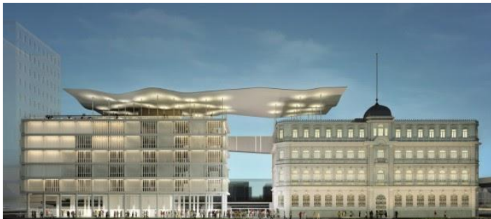
Figura 2. Vista del MAR

La solución de conexión arquitectónica está compuesta por un techo en forma de cobertura fluida de concreto, simulando una ola