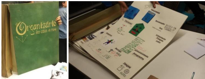
Figura 4. Organizador de las cosas del mundo. (Fuente: Munhoz, 2016).

Desafiados a categorizar las cosas del mundo, se percibe como algunas categorías se superponen y otras se contradicen. Sorpresa o desacuerdo, y ante este último, la elección de reorganizar, corregir, comentar, hacer notas aclaratorias o notas al pie. En esa mixtura, son ratificadas algunas categorías y son configuradas las condiciones para pensar otras. Al final, una sensación extraña: en esa aglomeración de capas y de múltiples clases (activando la memoria individual o colectiva), se produce un libro infinito, en construcción infinita, al estilo de la biblioteca borgeana.