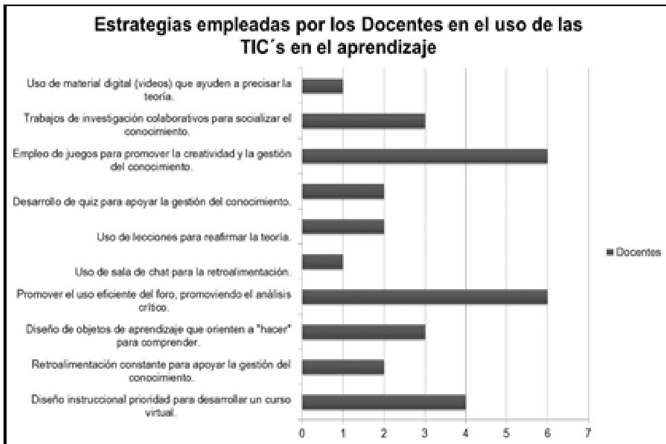
Gráfico 1. Estrategias empleadas por los docentes en un ambiente virtual de aprendizaje.

La retroalimentación constante como apoyo al desarrollo de la gestión del conocimiento, el uso de lecciones para apoyar la teoría y el desarrollo de quiz como ayuda para la gestión del conocimiento obtuvieron el 6.67% respectivamente. Y por último el uso del chat, y los videos obtuvieron el 3.33% de preferencia como estrategia docente para promover la gestión del conocimiento a través de la socialización por medio de las tecnologías de información en el aprendizaje.