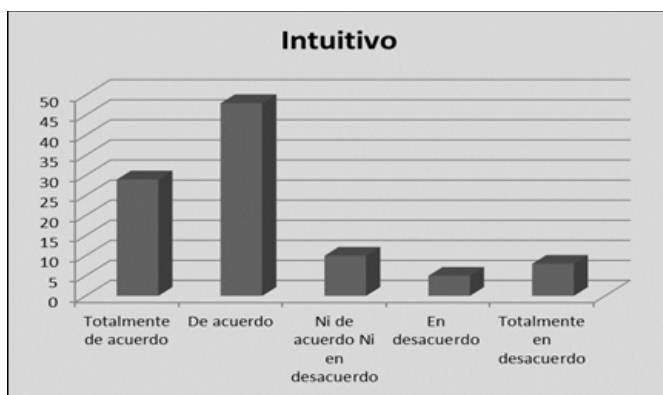
Gráfico 4. Intuición como competencia desarrollada por medio de las TIC.

Mientras que la competencia que los aspirantes consideran estar de acuerdo es la intuición, siendo el modo de percibir y de conocer. La explicación se da en torno a que la virtualidad implica inferir, por medio de investigar, conocer y aplicar (gráfico 4).