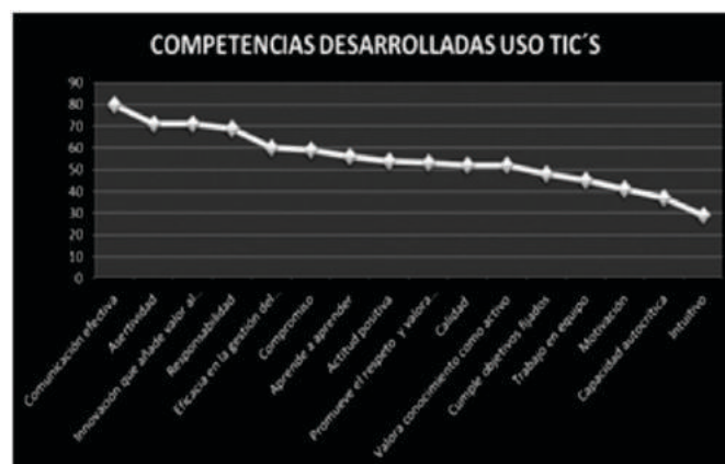
Gráfico 2. Competencias desarrolladas de los aspirantes. Fuente: Elaboración propia a partir del análisis de resultados.

En el gráfico 2, se identifican las competencias que los aspirantes indican haber desarrollado durante el propedéutico a distancia, como parte del proceso de ingreso a la FCA-UAQ, en donde la comunicación efectiva se posicionó en primer lugar al recibir 80 respuestas en el indicador: Totalmente de acuerdo, al mencionar que sí se desarrollan habilidades comunicativas hacia el docente y hacia el grupo; por medio de la retroalimentación efectiva.