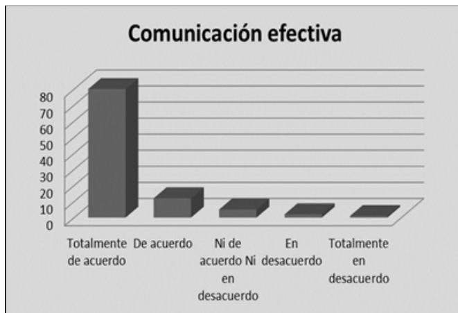
Gráfico 3. Competencia más desarrollada.

Enlistando el orden en que los aspirantes evaluaron las competencias desarrolladas, la innovación que añade valor al conocimiento fue la segunda mejor evaluada, la responsabilidad, la eficacia en la gestión del conocimiento, el compromiso, el concepto “aprender a aprender”, la actitud positiva, promotor del respeto y valora las aportaciones de sus compañeros, calidad, valora el conocimiento como activo, cumple objetivos fijados, trabajo en equipo, motivación, capacidad autocrítica e intuitivo como última competencia desarrollada.