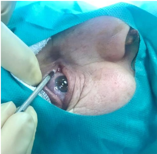
Figura 3. Dilatación punto lagrimal inferior.

Si el procedimiento ha producido erosiones en el septum o hay sospecha de que se pueda producir una sinequia colocamos placas de fluoroplástico suturada en el septum durante 15 días.