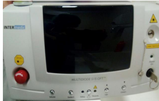
Figura 1. Equipo láser INTERMEDICS.

Para tratar de minimizar en lo posible el daño térmico en los canalículos se introduce con la sonda de vías viscoelástico en los canalículos y el saco.