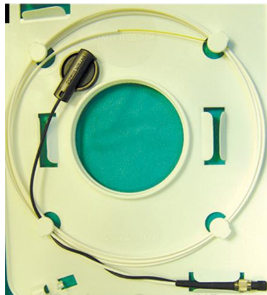
Figura 2. Sonda equipo láser

Una vez que tenemos la fibra sobre el hueso se realizan los disparos (10W), y para permitir visualizar por transiluminación la localización de la fibra de láser se disminuye la luz del endoscopio introducido en la fosa nasal. (Figuras 4 y 5)