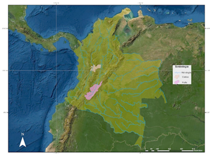
Figura 2. Ubicación de hidroeléctricas El Quimbo y Monte Bonito.