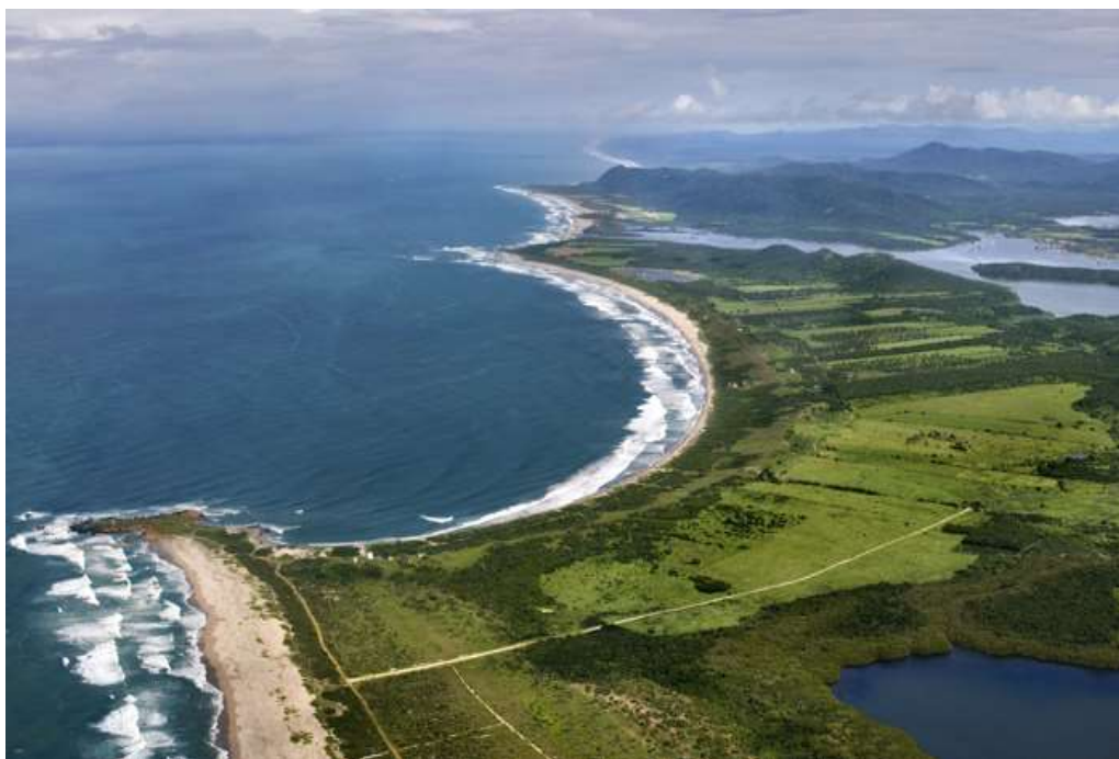
Figura 2: playa de Chalacatepec en el municipio de Tomatlán Jalisco.