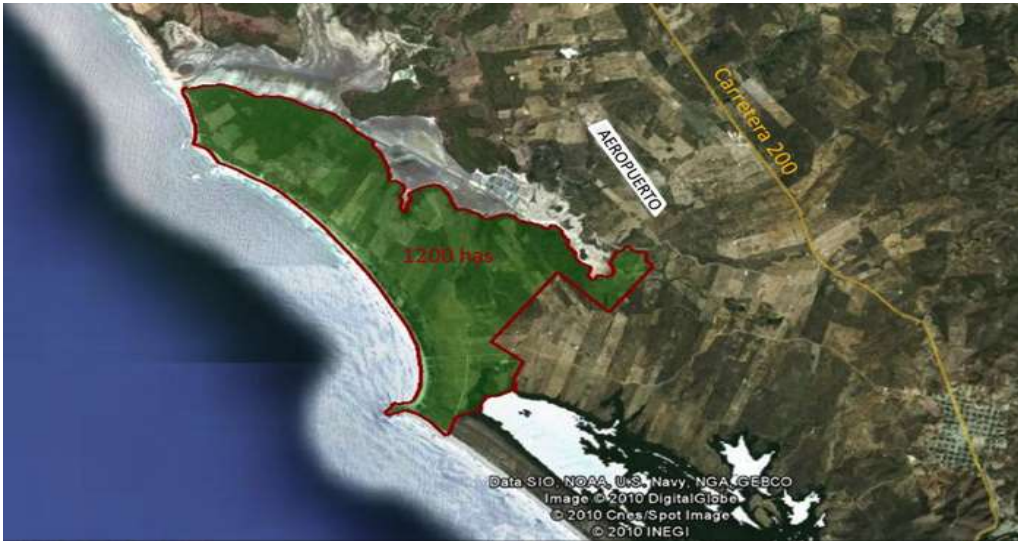
Figura 3: Figura 3: mapa que muestra el área del proyecto “Nuevo Cancún” en la Playa de Chalacatepec.

La superficie territorial que tiene contemplado este proyecto de desarrollo turístico es de 1200 hectáreas (Figura: 3) y se tiene contemplado su tiempo de construcción para varios años, así poder cumplir con su cometido en cuartos construidos que rebasa los cientos de alojamiento o cuartos habitación.