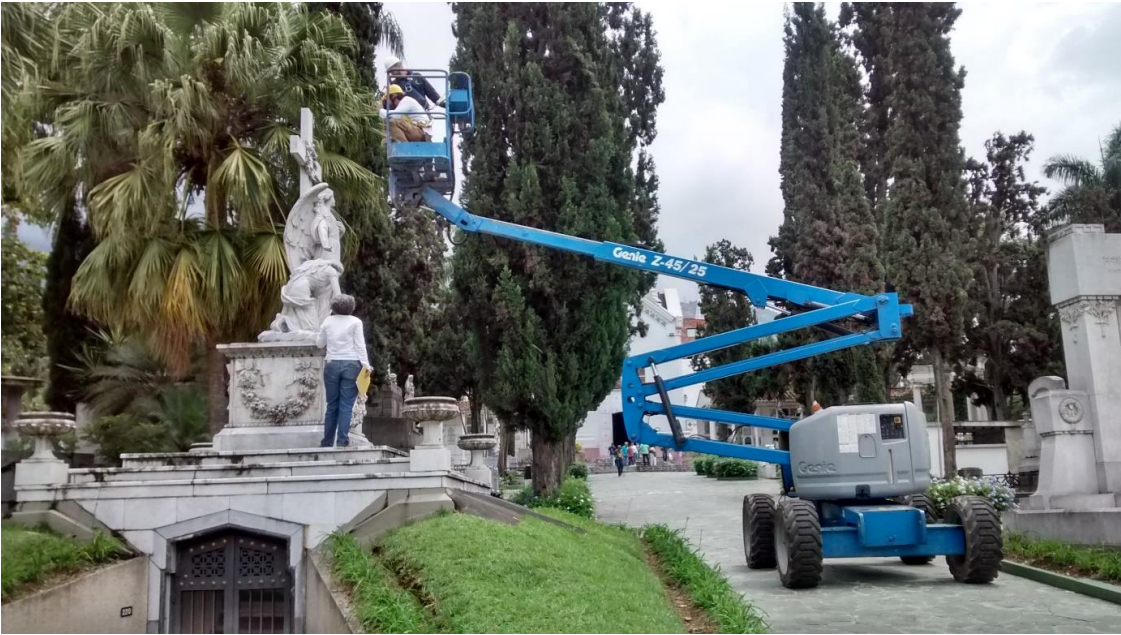
Imagen 1. Utilización del elevador eléctrico para la revisión de los mausoleos en alturas.