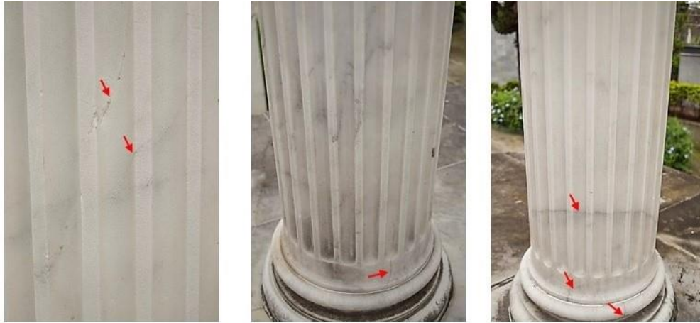
Imagen 4. Fisuras y fracturas presentadas en las columnas del mausoleo 502

en un estado de alerta, ya que el colapso de estas columnas podría generar daños irreparables en la obra y accidentes a los visitantes.