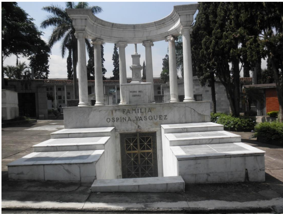
Imagen 2. Vista general mausoleo 502

Teniendo en cuenta los criterios anteriores, se procedió a la jerarquización de las piezas agrupándolas por tipo de material ya que de esta manera era más fácil evaluarlas, de este modo se evidenció que la pieza que requería atención inmediata es la 502.001, correspondiente a las columnas del Mausoleo 502 de la Familia Ospina Vásquez.