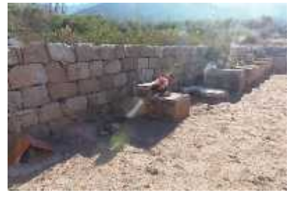
Fig. 39 - SANTA VERA CRUZ