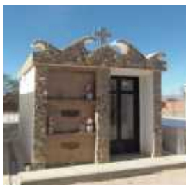
Fig. 55 - ANILLACO