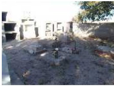
Fig. 38 -SAN PEDRO