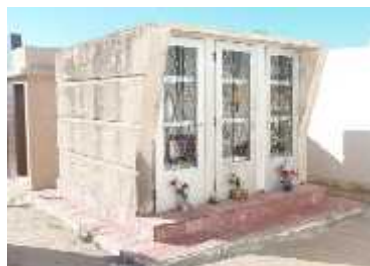
Fig. 58 - SAN PEDRO