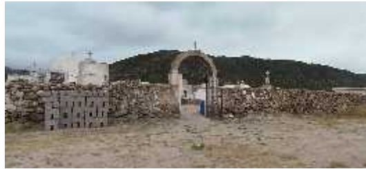
Fig. 16 - CHUQUIS