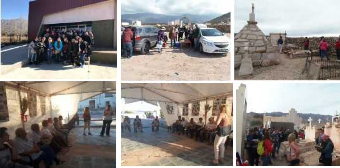
Fig. 61 – DIFUSION Y CONCIENTIZACION