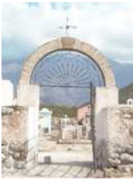
Fig. 26- CHUQUIS