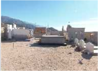
Fig. 41 - AGUA BLANCA