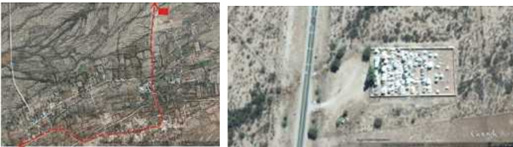
Fig. 5 - PINCHAS