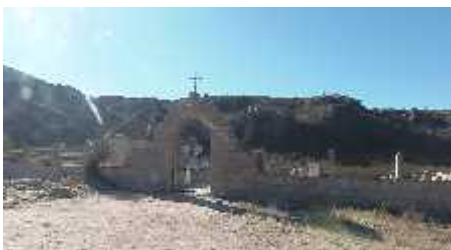
Fig. 13 - LAS PEÑAS