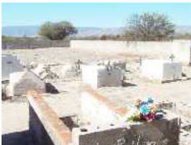
Fig. 36 -ANILLACO