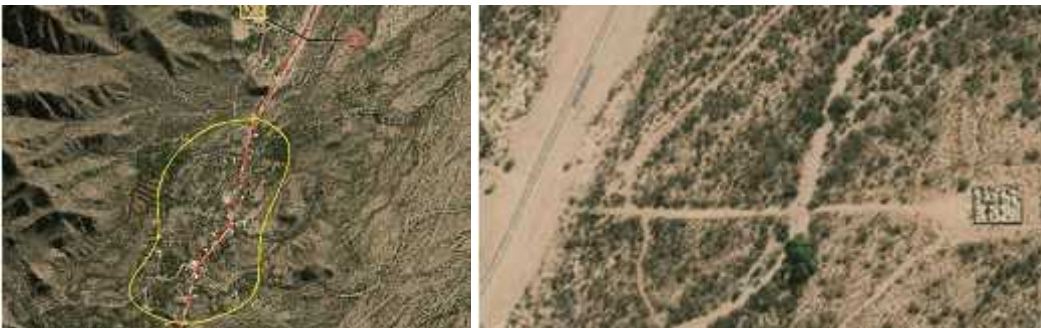
Fig. 4 - AGUA BLANCA