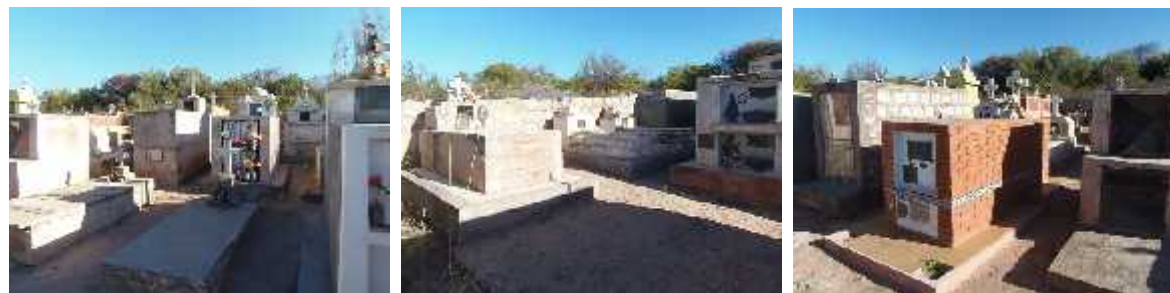
Fig. 49 - SANTA VERA CRUZ