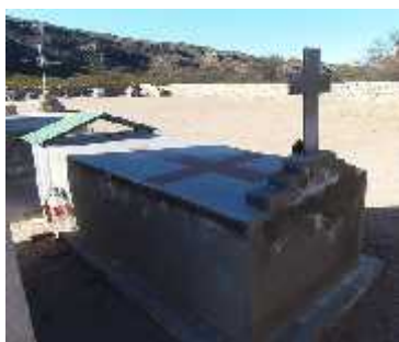
Fig. 50 - LAS PEÑAS