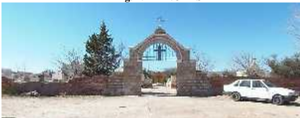
Fig. 17 - AMINGA