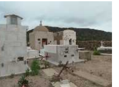
Fig. 43 - CHUQUIS