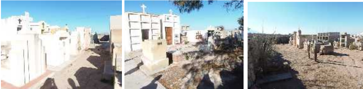
Fig. 48 - SAN PEDRO