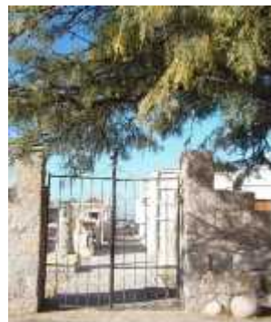
Fig. 31 - SAN PEDRO