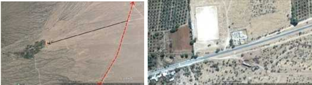
Fig. 11 – SAN PEDRO