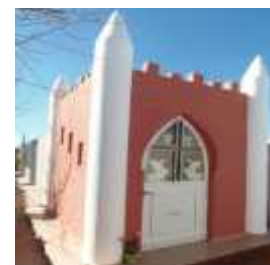
Fig. 56 - LOS MOLINOS