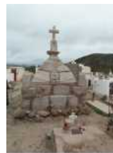
Fig. 53 - CHUQUIS