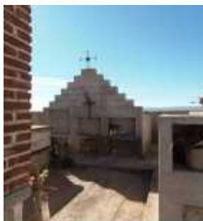
Fig. 51 - AGUA BLANCA