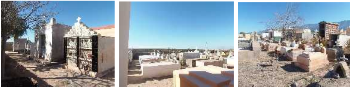
Fig. 47 - ANJULLON