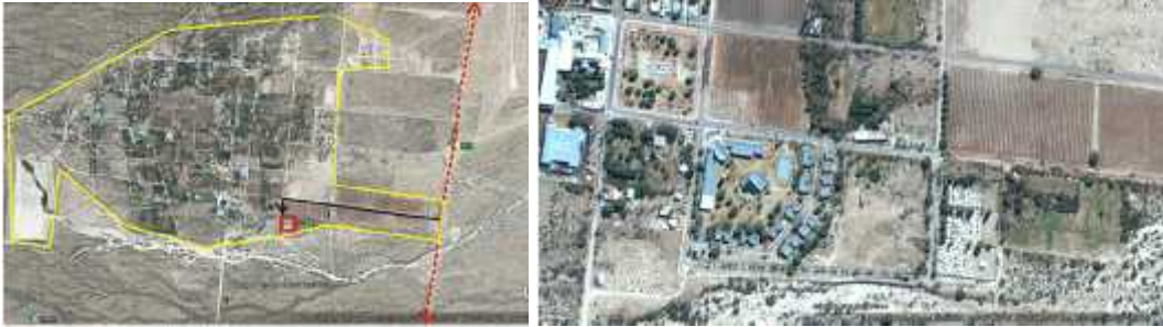
Fig. 8 – ANILLACO