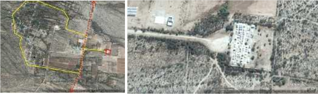
Fig. 7 – AMINGA