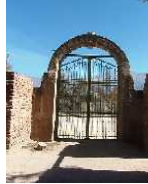
Fig. 28 - ANILLACO