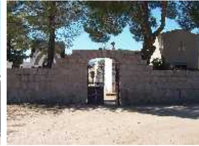
Fig. 25 - PINCHAS