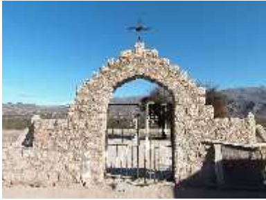
Fig. 23 - LAS PEÑAS