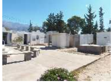
Fig. 45 - ANILLACO