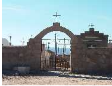
Fig. 24 - AGUA BLANCA