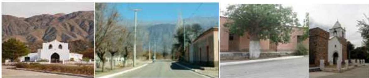
Fig. 2 – PUEBLOS DE LA COSTA