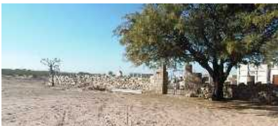
Fig. 21 - SAN PEDRO