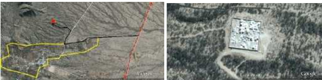
Fig. 6 - CHUQUIS