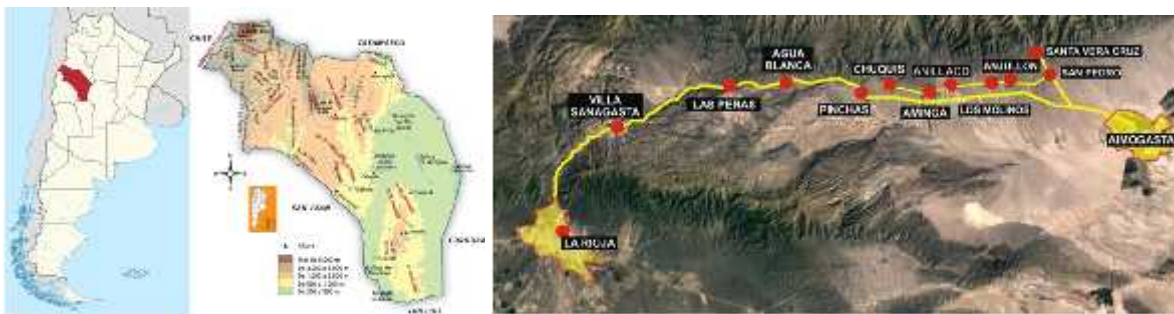
Fig. 1 – ARGENTINA – LA RIOJA – CORREDOR DE LA COSTA RIOJANA

En la ladera oriental de la sierra del Velasco, en el circuito denominado la “Costa Riojana”, se encuentran diez pintorescas poblaciones que invitan a recorrer sus calles y conocer su historia ( figura 1 y 2 ). Pueblos encadenados por caminos sinuosos entre un rojo de enormes moles rocosas y un verde inusual en la provincia, con sus árboles frutales, olivos, dulces y vinos artesanales, tambos y antiguas iglesias. Cuando se habla del “Camino de la Costa” en La Rioja, no se alude a ningún circuito que corra a la vera de ríos u otros cursos de agua, sino la zona que bordea el cordón de Velasco, con unos 10 pueblitos ubicados sobre la ruta provincial 75, en un microclima especial. Su pintoresco ambiente, en el que prevalece el verde en valles, quebradas y cerros, con grandes nogales, olivos, durazneros, manzanos, membrillos y frescos viñedos entre altos cardones, la convirtieron en el lugar preferido para realizar un atractivo paseo. El circuito tiene su punto inicial en la ciudad Capital, y se adentra en una serie de pequeñas localidades que aún conservan sus tradiciones y costumbres; una excursión que transita la Ruta Nacional 75 hacia el norte, en paralelo a las Sierras de Velasco. La Costa Riojana constituye un paseo sumamente diferente, caracterizado por una paz imperturbable, un profundo silencio y un singular microclima que invita a disfrutar de la vida en contacto con la naturaleza.