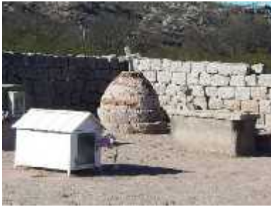
Fig. 33 -LAS PEÑAS

perdida. Por tal motivo consideramos que la ubicación específica de sus enterramientos, da origen a un lugar significativo para la gente, además cada tumba denota el esfuerzo por expresar la individualidad de los niños enterrados.