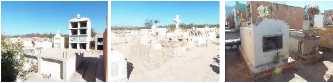
Fig. 46 - LOS MOLINOS