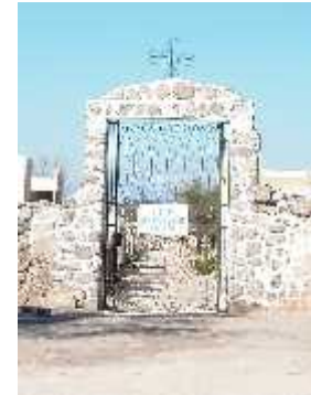
Fig. 29- LOS MOLINOS