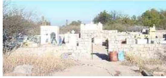
Fig. 22 - SANTA VERA CRUZ