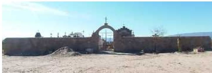
Fig. 14 - AGUA BLANCA