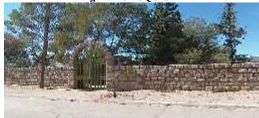
Fig. 18 - ANILLACO