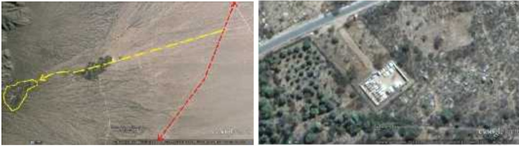
Fig. 12 - SANTA VERA CRUZ

Los cementerios de la Costa son retratos de las familias originarias de cada pueblo (por ejemplo, en Pinchas, flia Fuentes, en Aminga, flia Barros), que se materializan en los mausoleos, siendo las construcciones más sobresalientes en cuanto a arquitectura, morfología y tecnología. Hay una serie de aspectos que le otorgan el carácter tipológico a estos cementerios rurales: