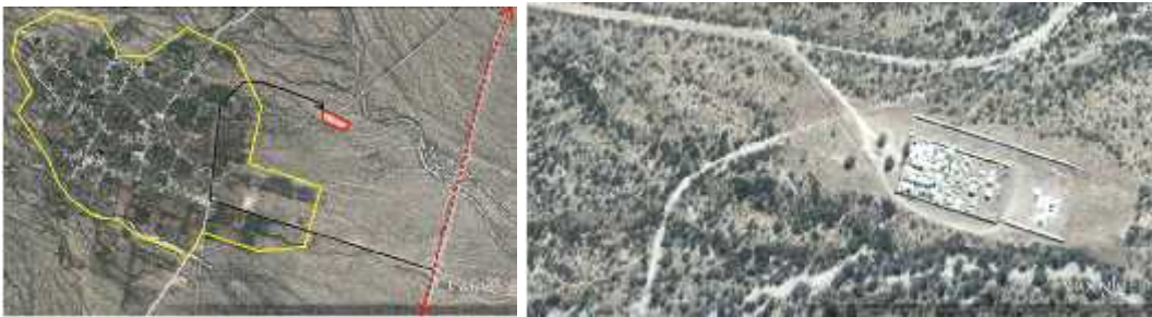
Fig. 10 – ANJULLON