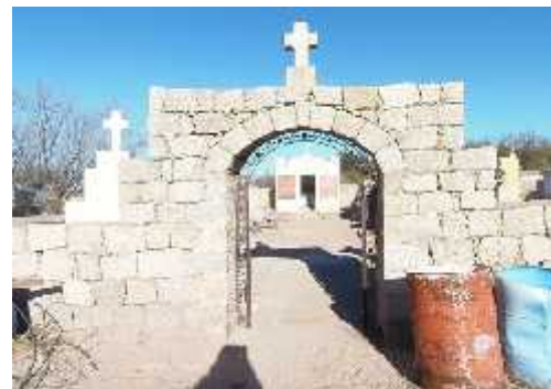
Fig. 32 - SANTA VERA CRUZ