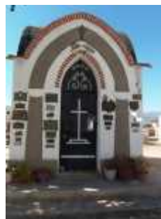
Fig. 52 - PINCHAS