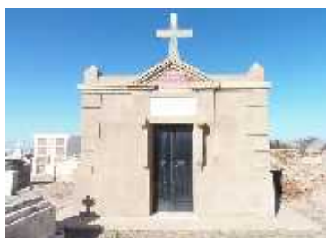
Fig. 57 - ANJULLON