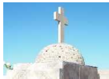
Fig. 59 - SANTA VERA CRUZ

Las razones para resignificar los cementerios de la Costa como iconos del Patrimonio Riojano es que están dotados de historia, de edificios o bienes de interés patrimonial, elementos de arte, leyendas, costumbres; su desarrollo muestra el proceso urbano del pueblo al que pertenece, entendiendo la historia de la arquitectura del pequeño cementerio a partir del emplazamiento y desarrollo de la localidad costeña.