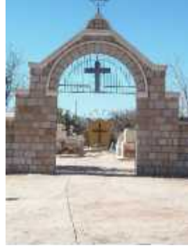
Fig. 27 - AMINGA