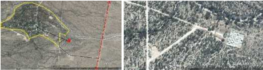
Fig. 9 - LOS MOLINOS