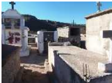
Fig. 40 - LAS PEÑAS