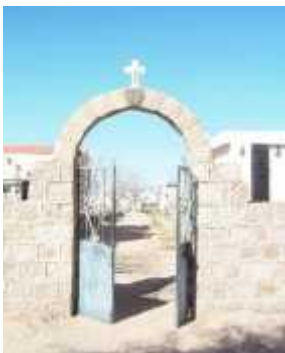
Fig. 30 - ANJULLON