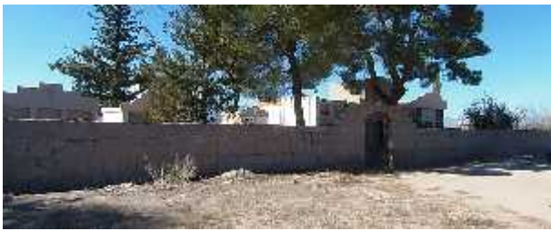
Fig. 15 - PINCHAS