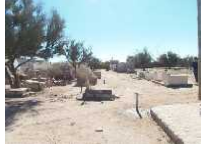
Fig. 35 -AMINGA