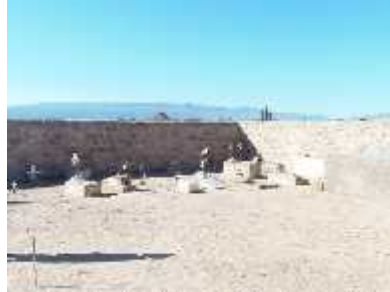
Fig. 34 -AGUA BLANCA