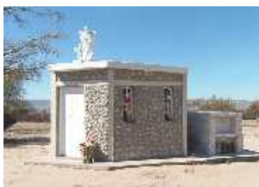
Fig. 54 - AMINGA